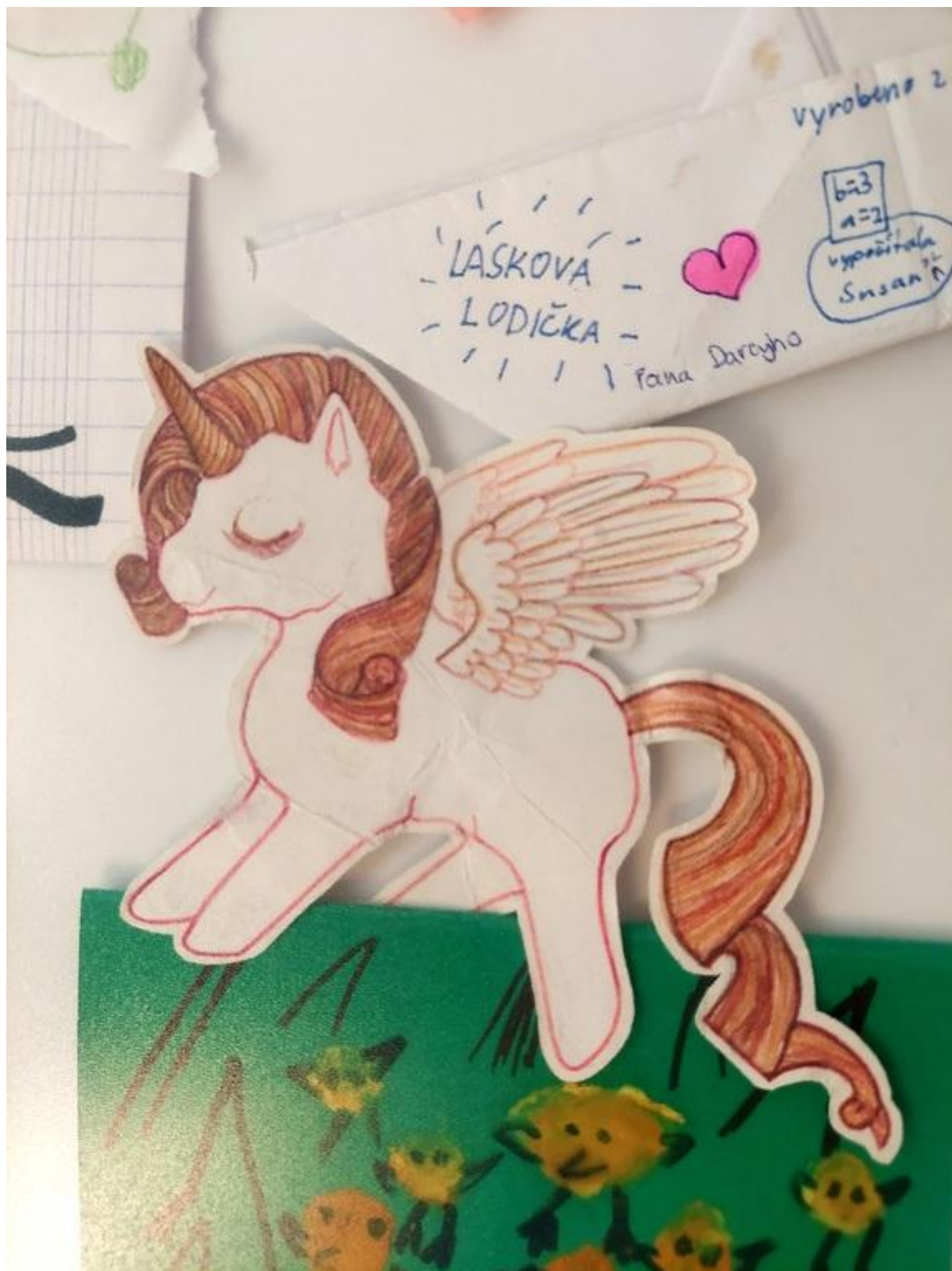
[11] Lásková lodička