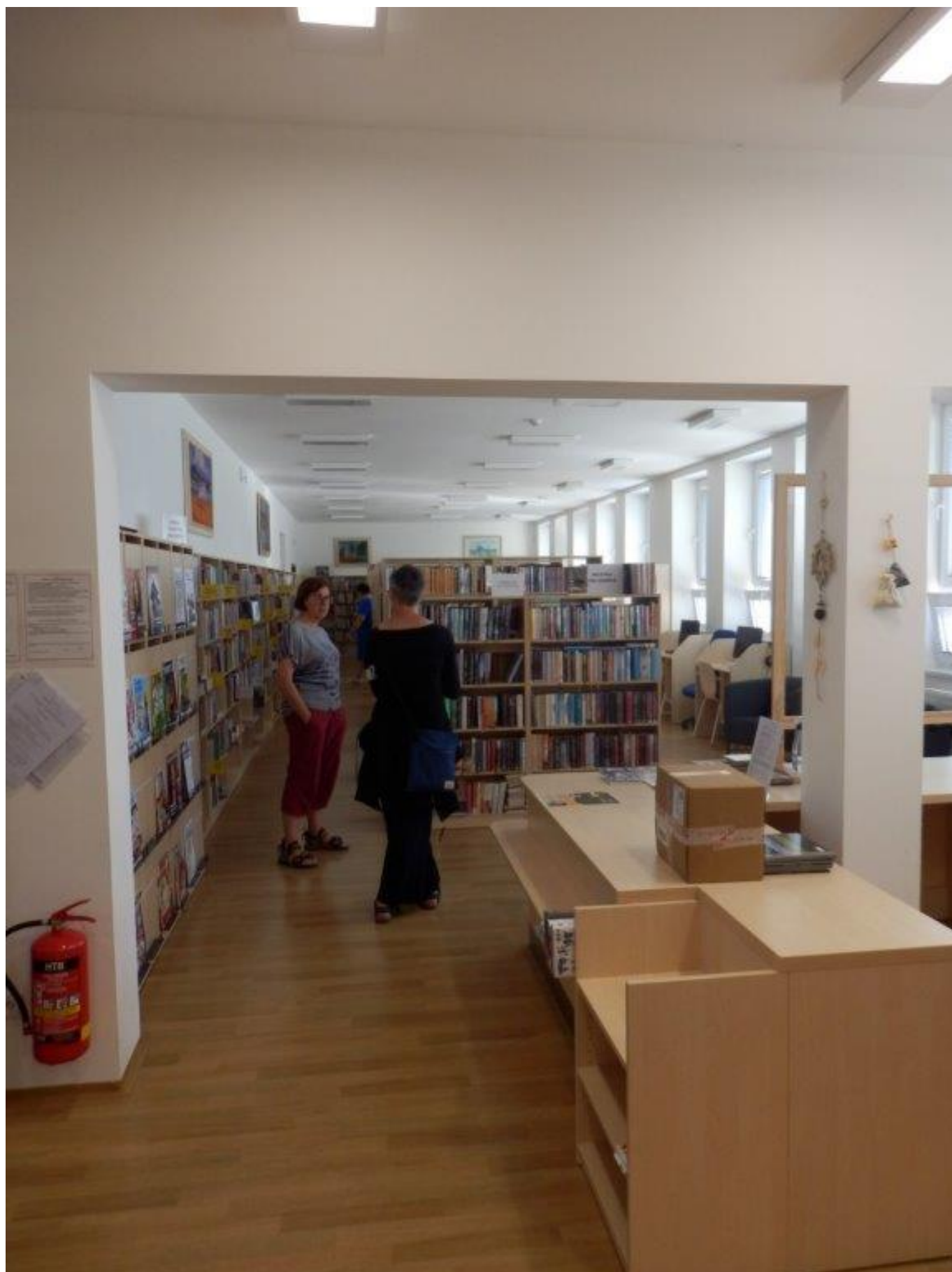
[20] Městská knihovna Nové Hradky