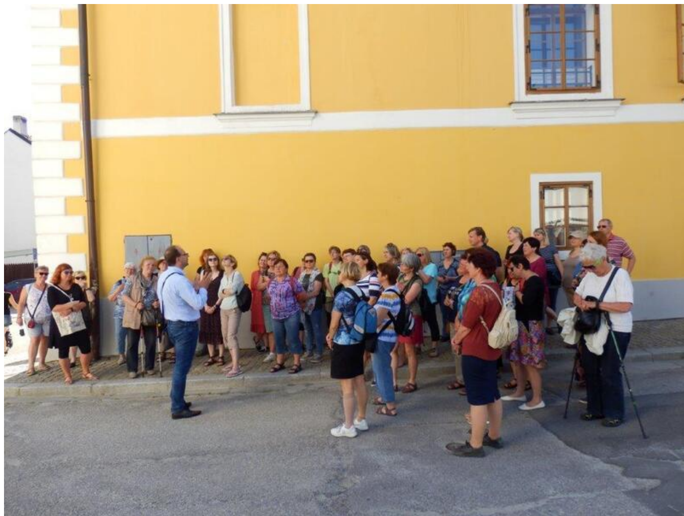
[15] Novohradské domy