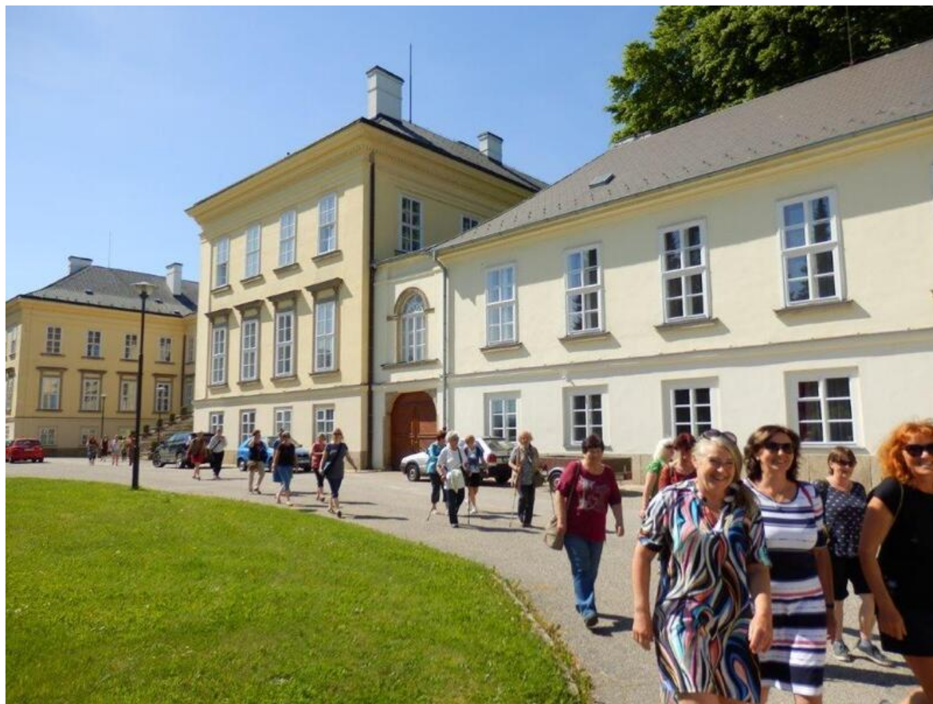
[14] Odchod na komentovanou prohlídku města