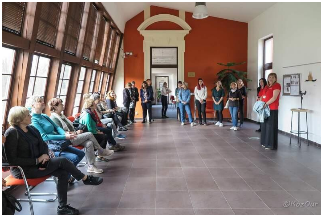
[17] Ostrovská knihovna je umístěna na zámku