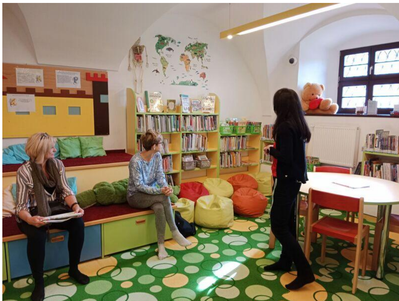
[18] V oddělení pro děti