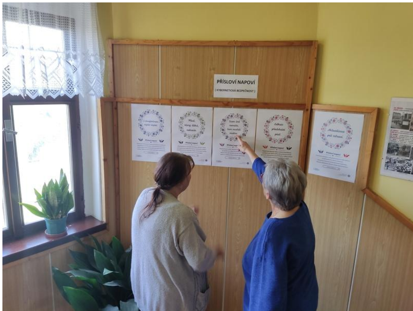
[11] Městská knihovna Duchcov