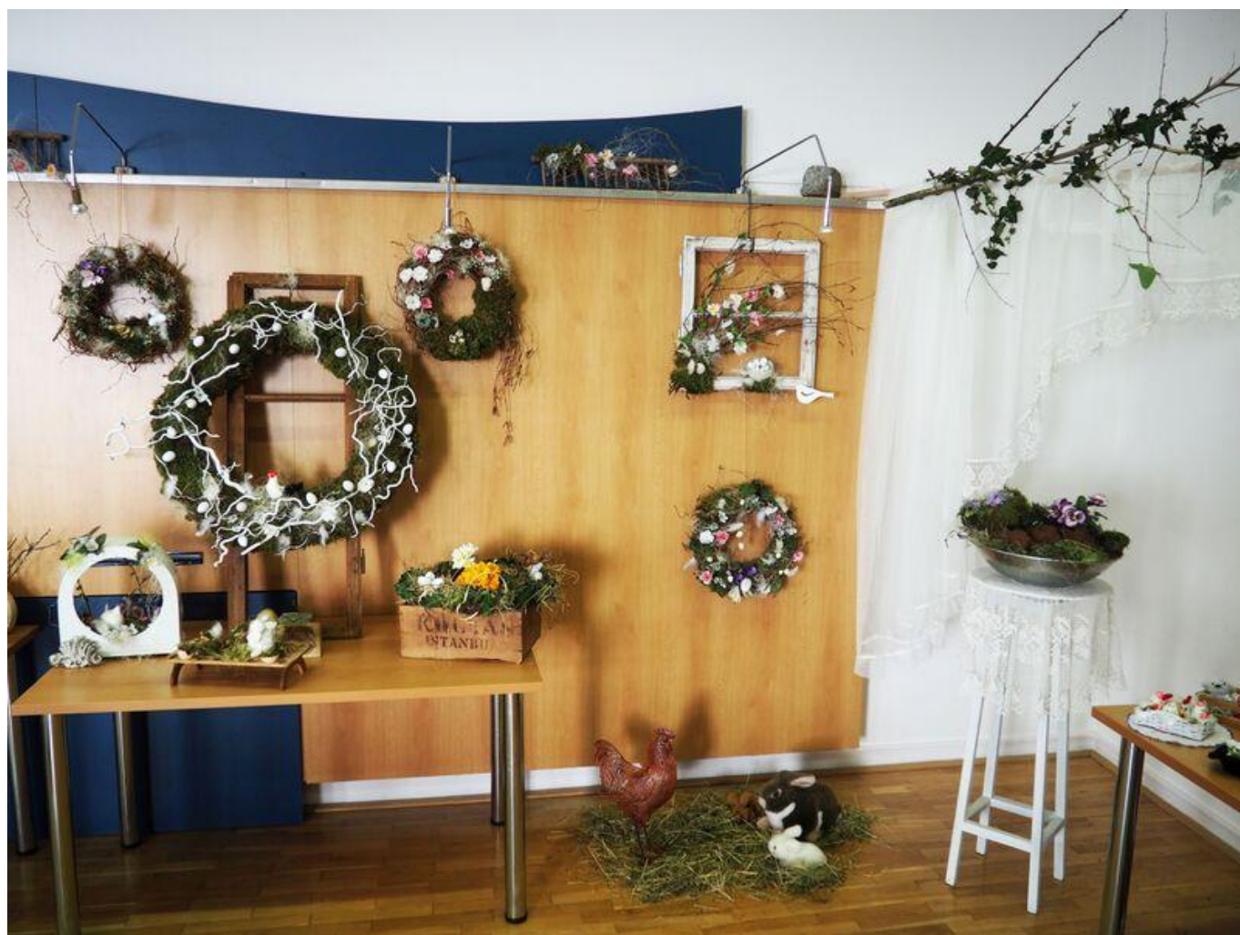
[15] Přírodní dekorace