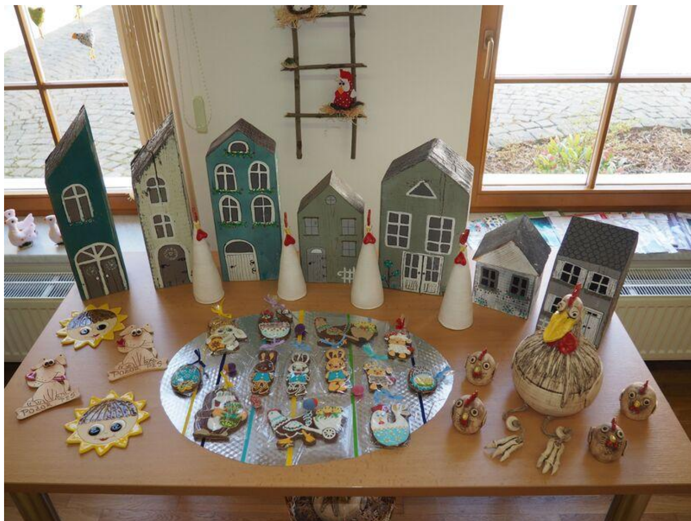
[17] Dřevěné domečky a velikonoční perníky