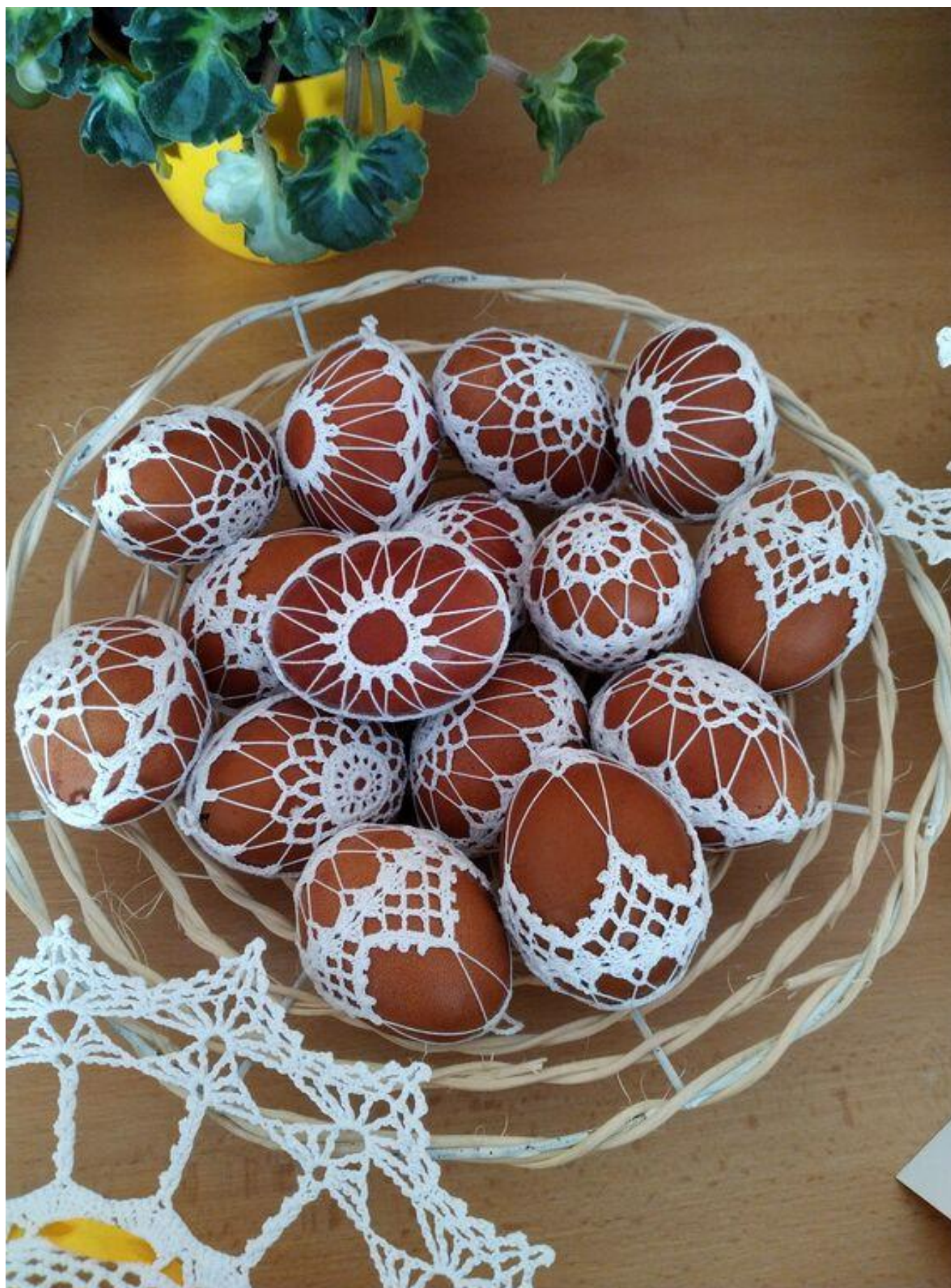
[21] Háčkované kraslice