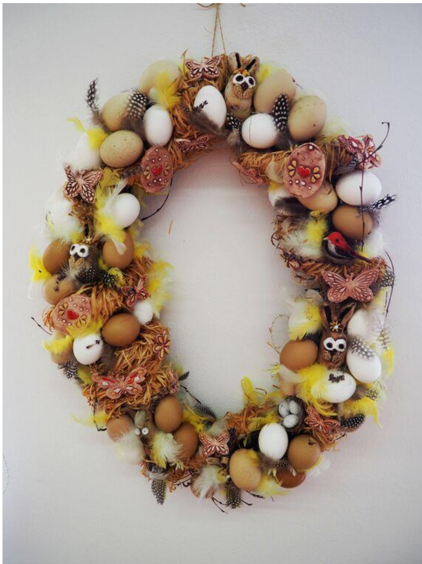
[16] Velikonoční věnec