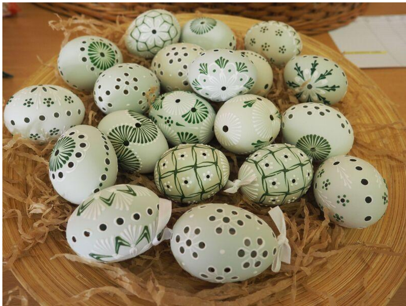
[20] Madeirové kraslice