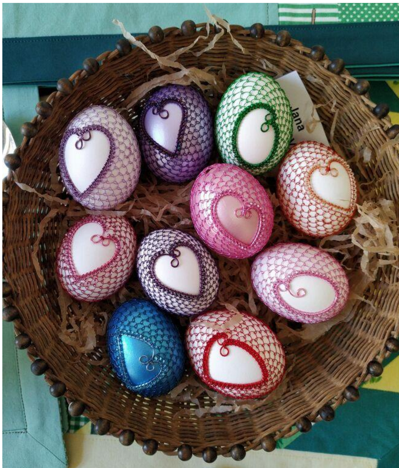
[19] Drátované kraslice