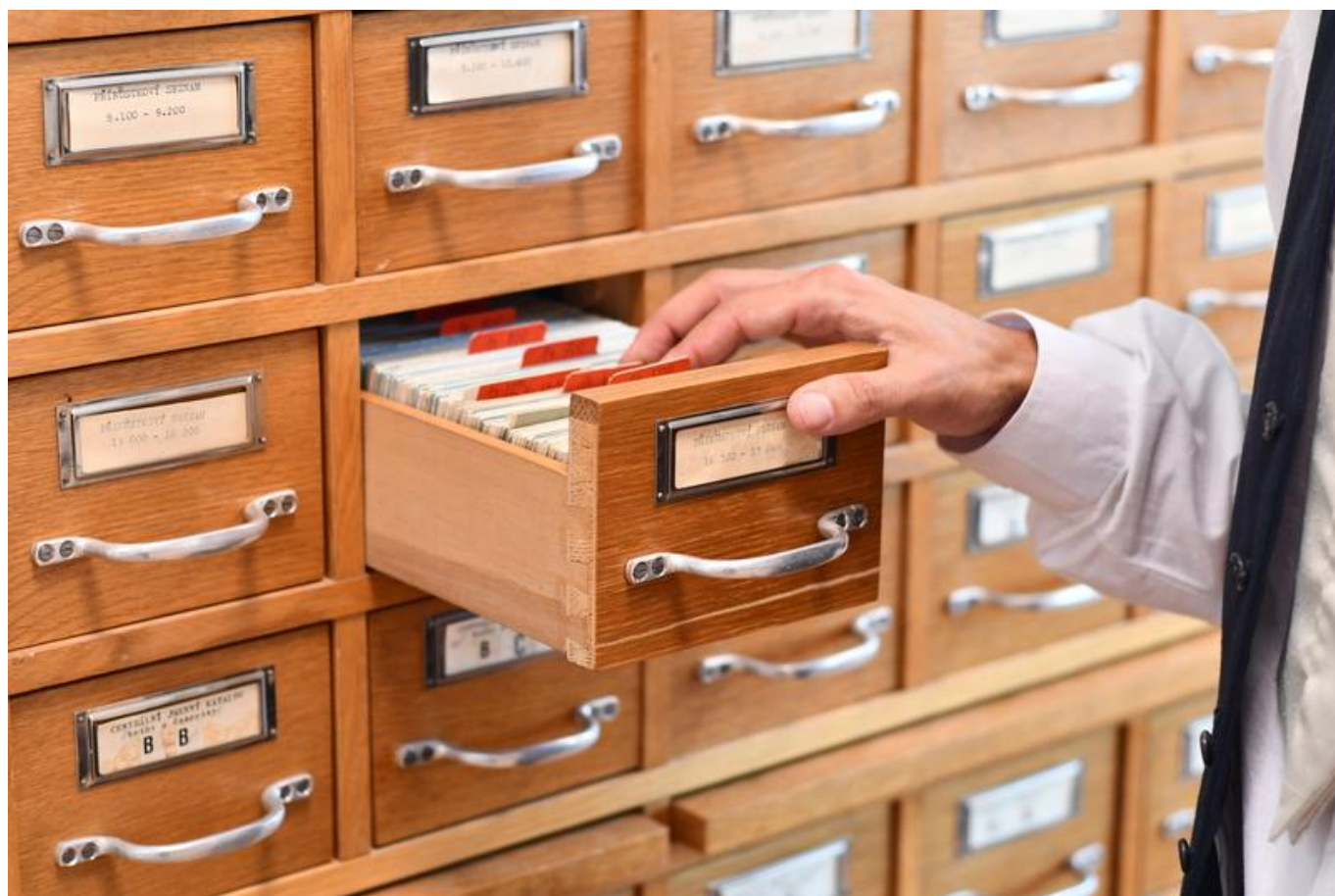
[16] Dobové vybavení K klubu a retrokavárna