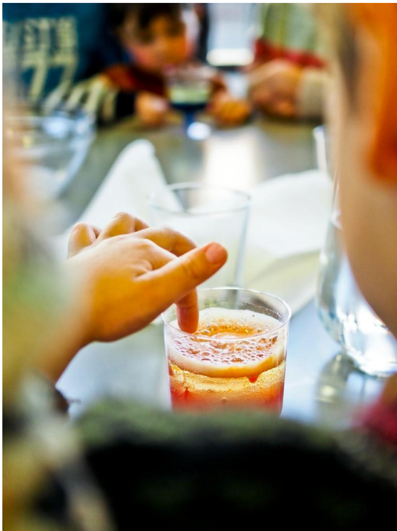
[22] Vyprávění příběhu o Marii Curieové v Knihovně Carlose Fuentesese - vědecké pokusy