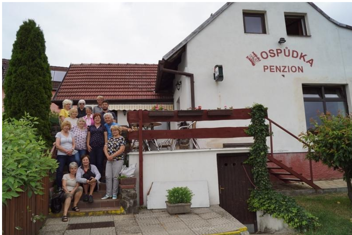
[18] Společná fotografie v Kocourově