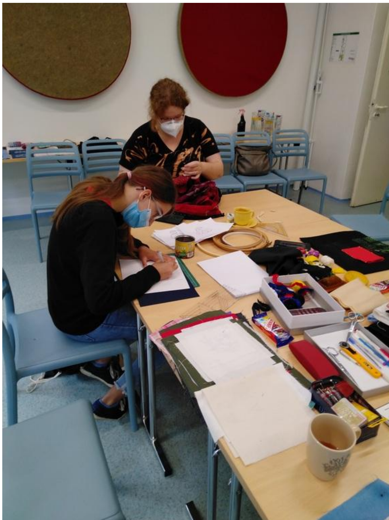
[13] Při vyšívání