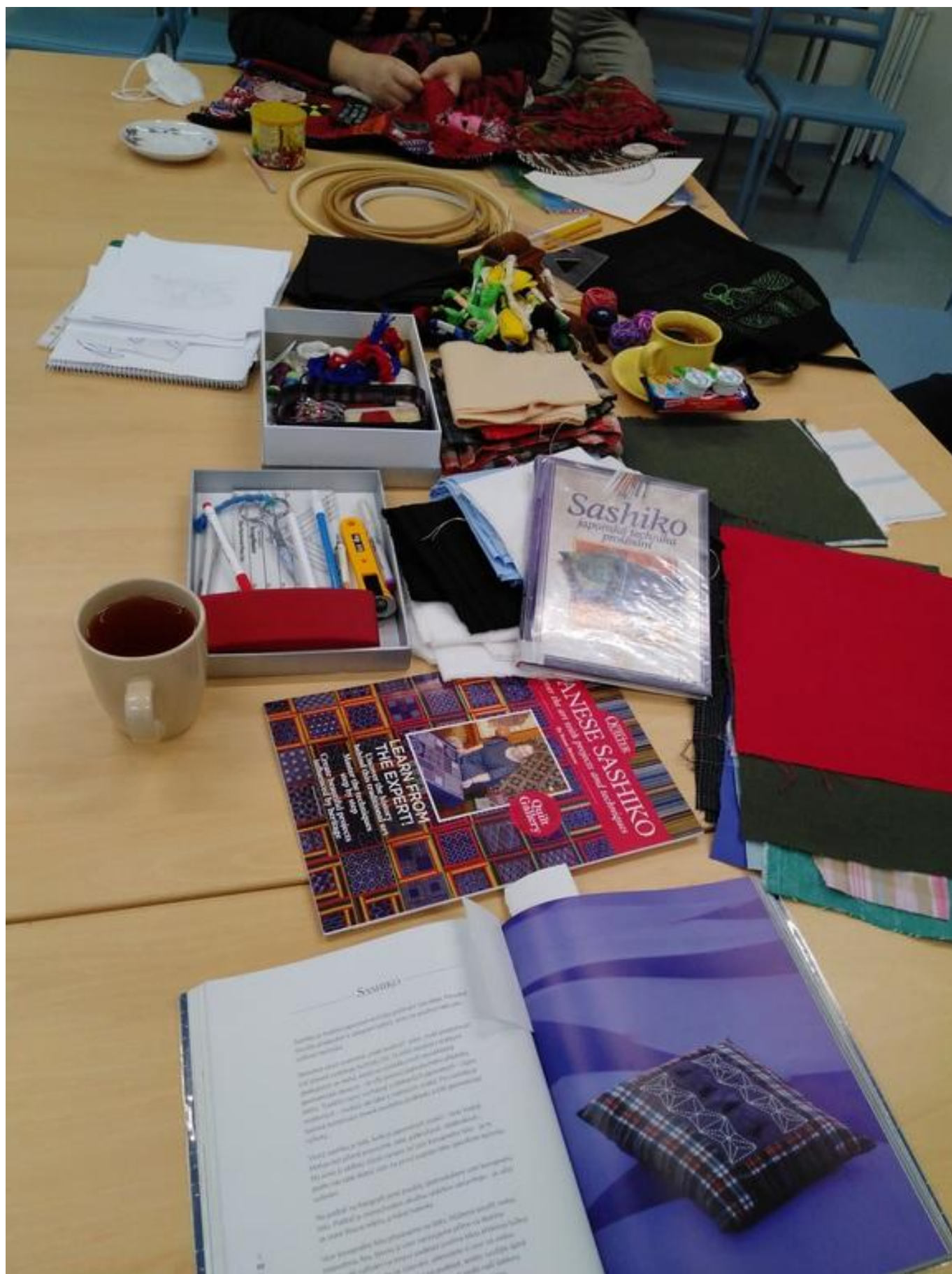
[14] Nechyběla ani související literatura