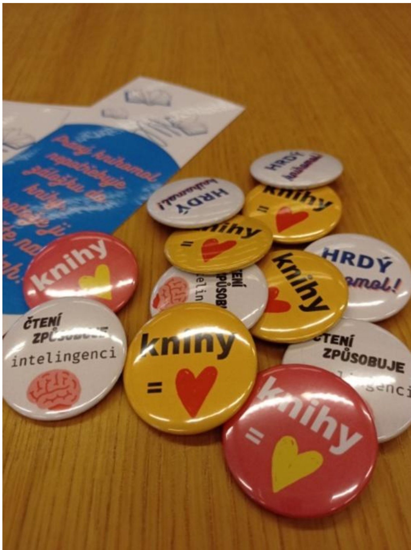
[18] Na luštitelé čekají drobné dárky s knižní tematikou