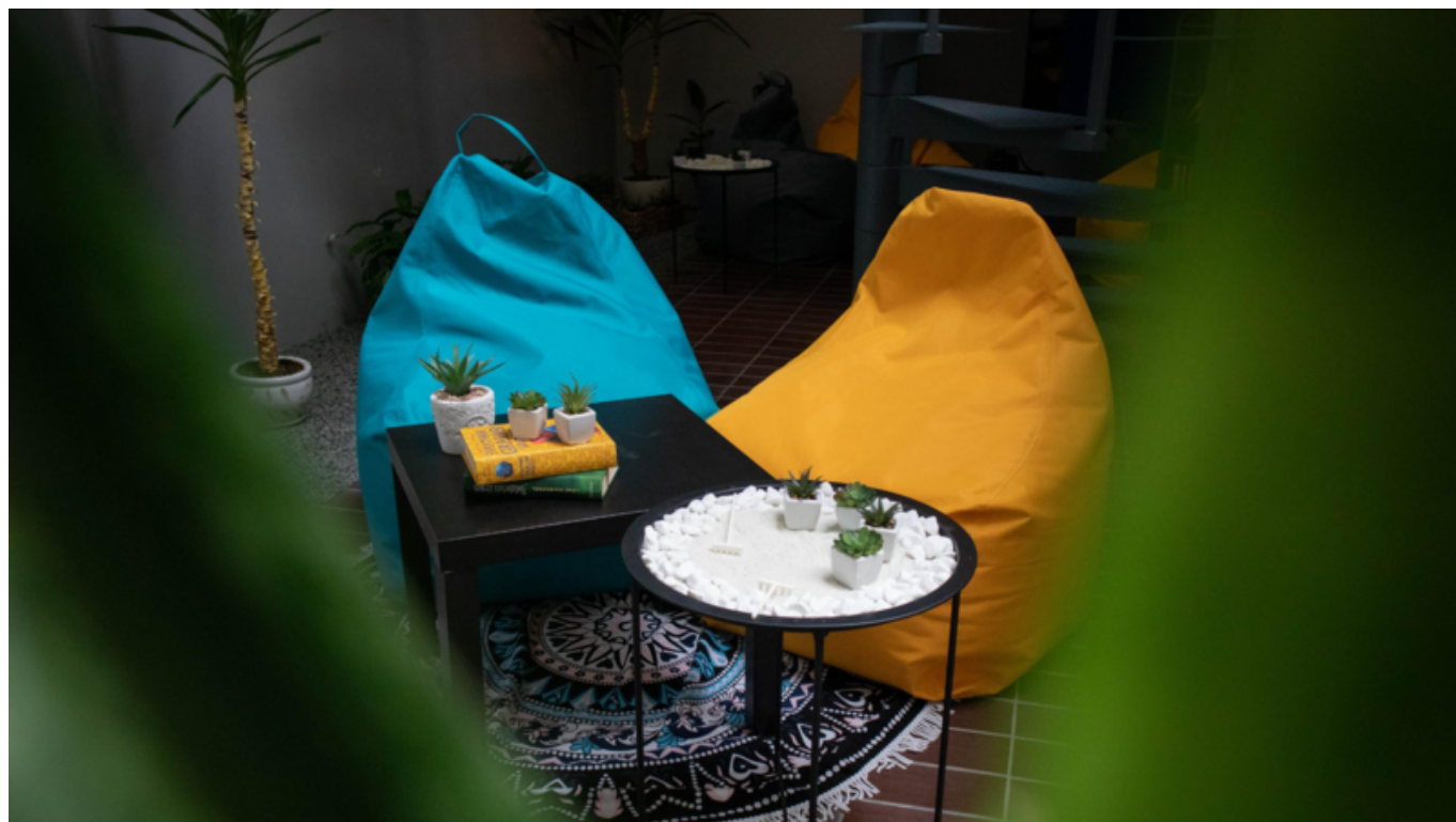
[24] Pohled do Zenové zóny