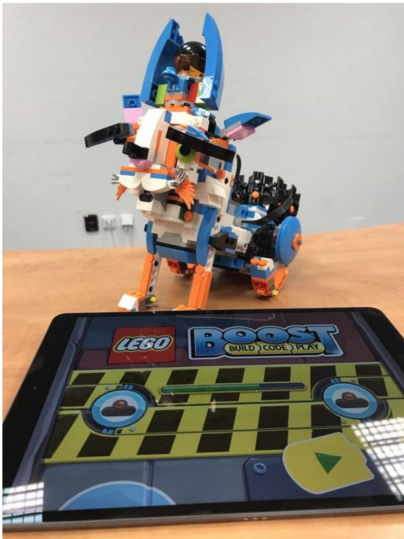
[17] Nechybí ani sada LEGO Boost