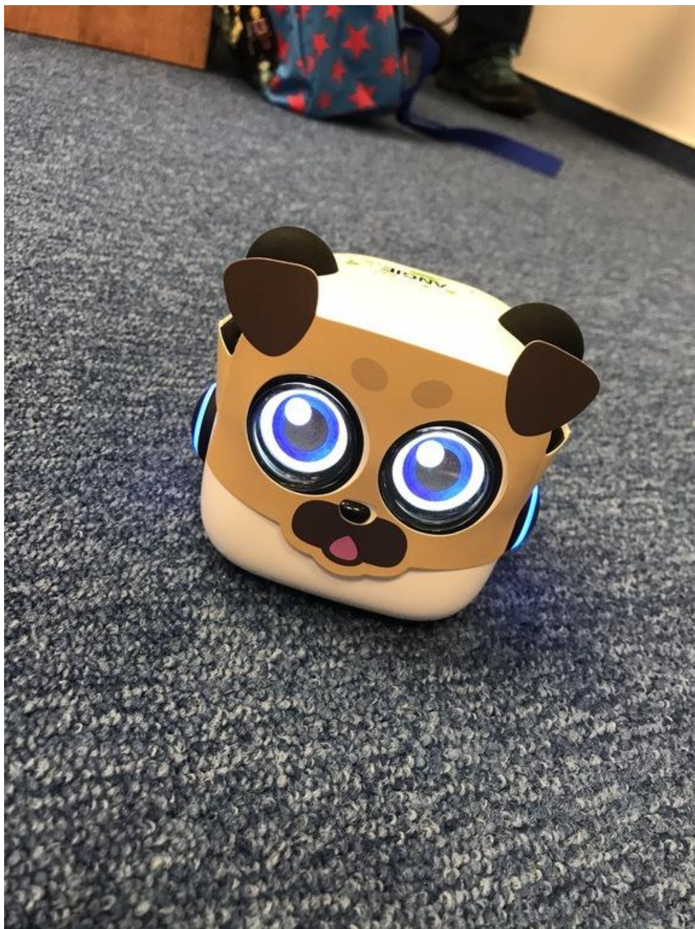
[29] Robůtek mTiny s maskou