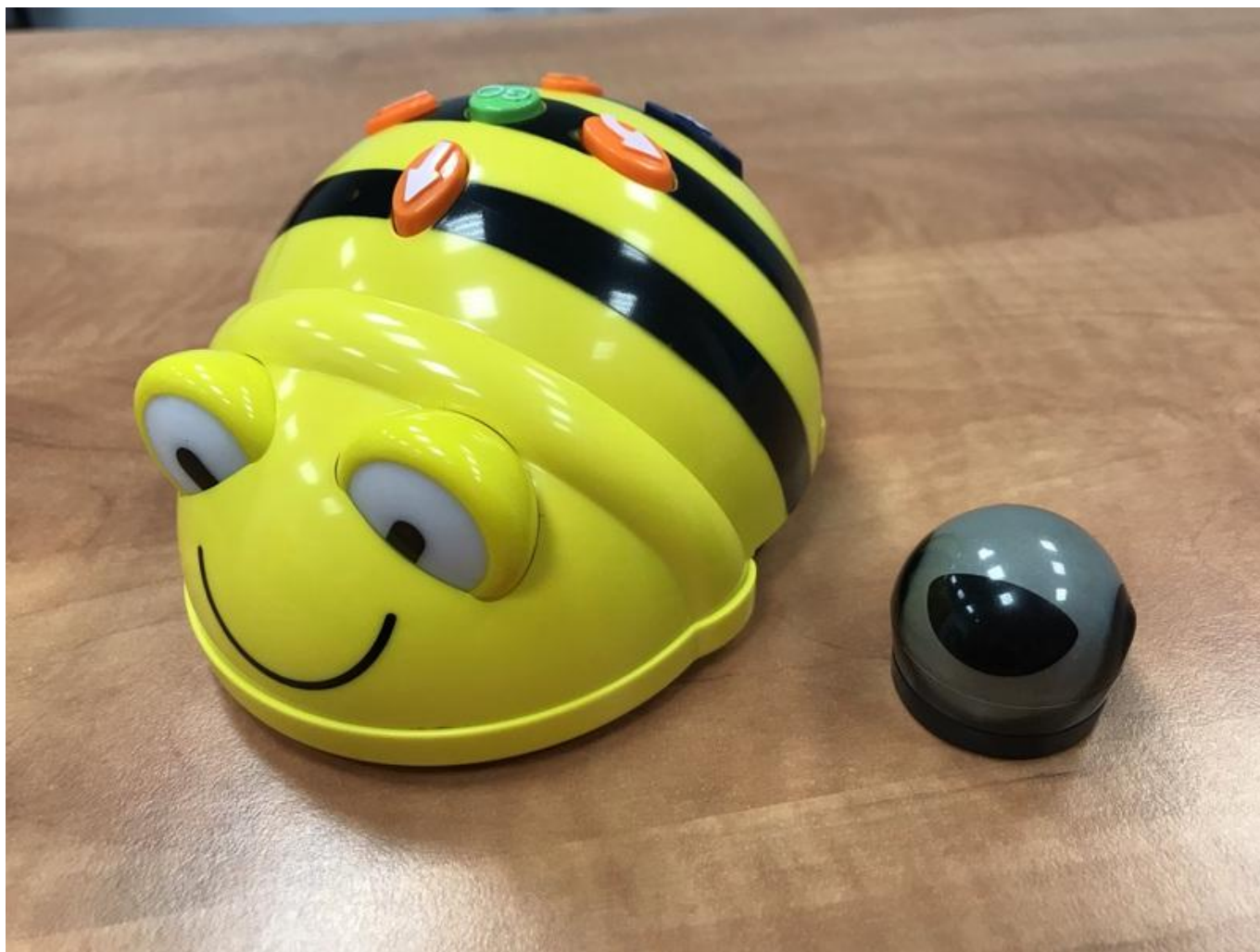
[16] Do vybavení Kreativní laboratoře patří Bee-Bot a Ozobot