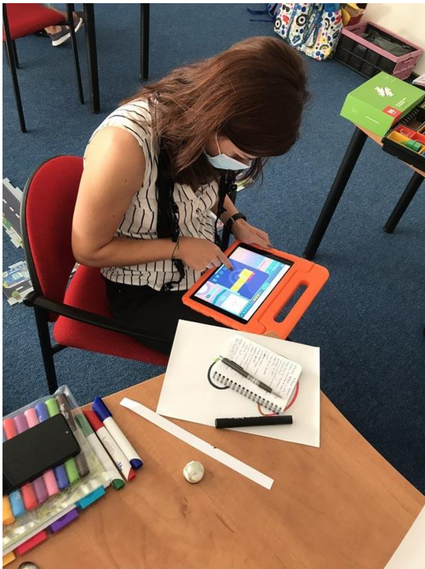
[25] Programování Ozobota