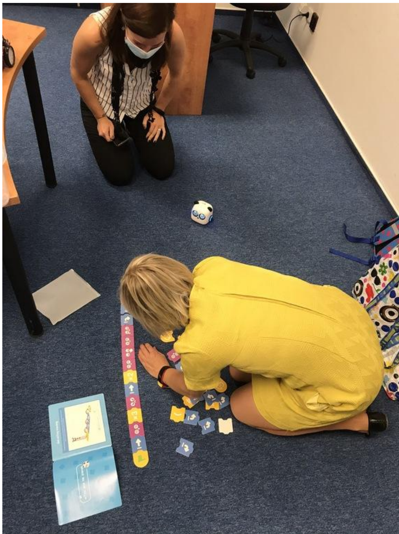
[26] S robůtkem mTiny