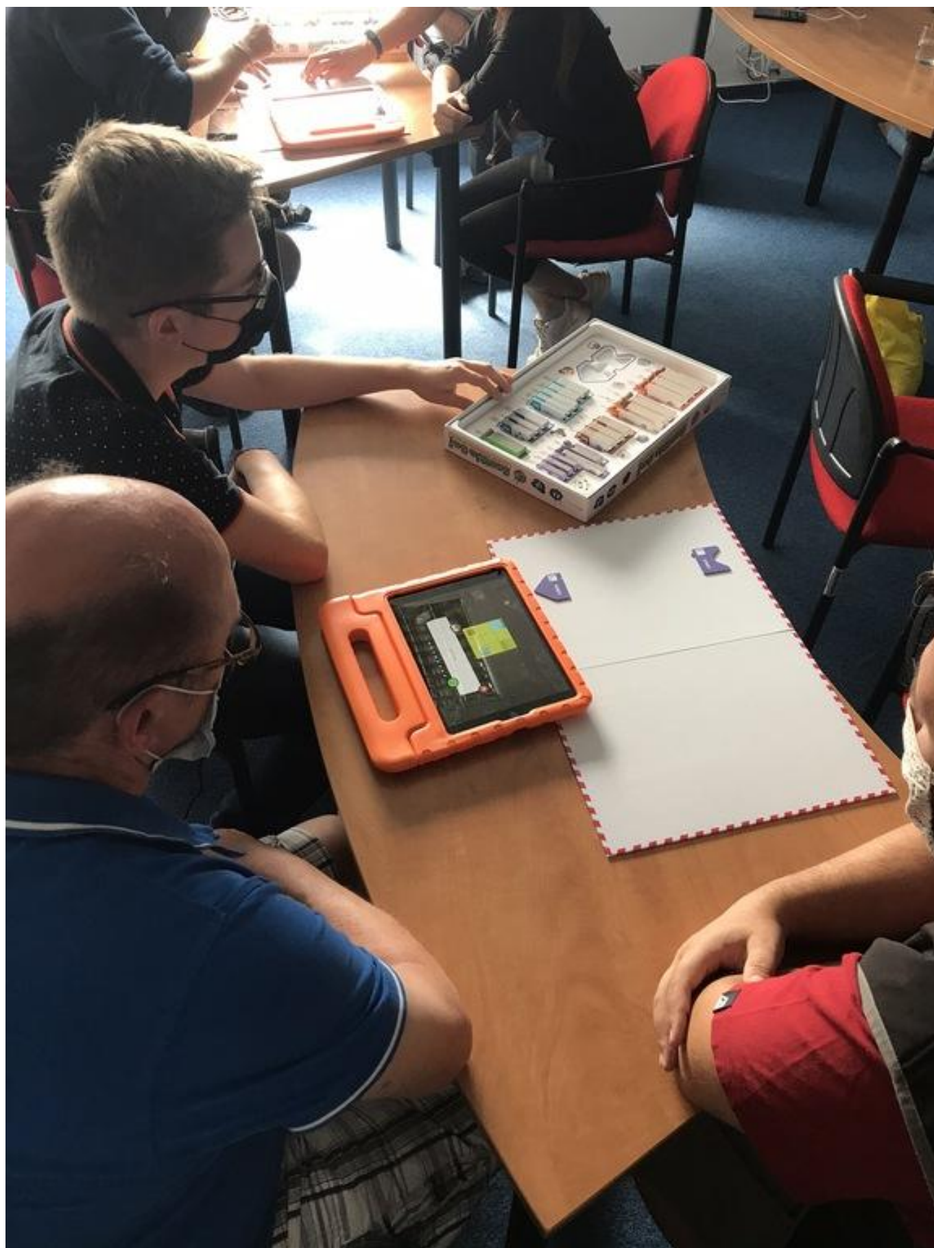
[23] S deskovou hrou Scottie Go! na workshopu robotiky pro začátečníky