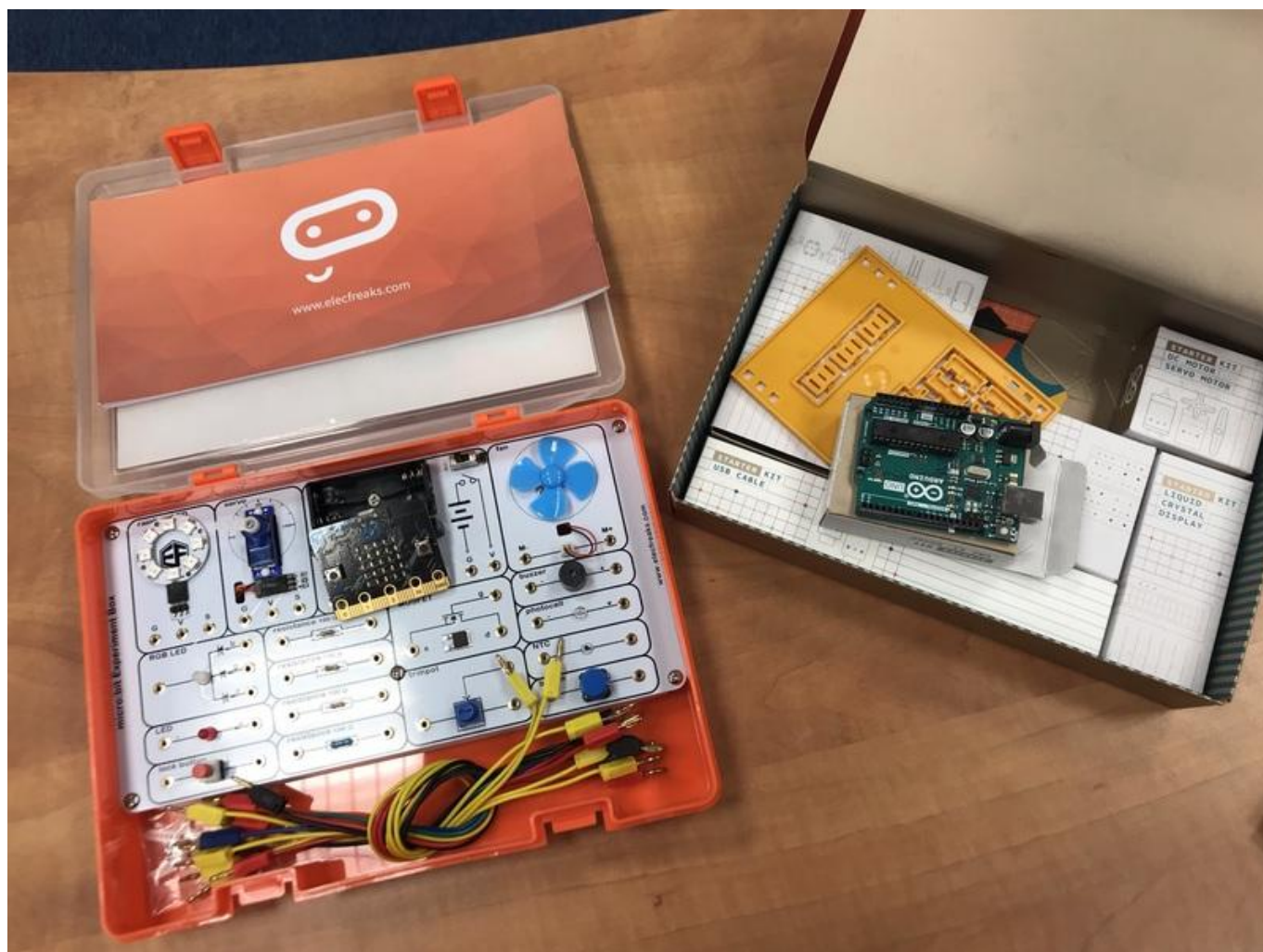
[19] Na uživatele čekají i počítače micro:bit a Arduino