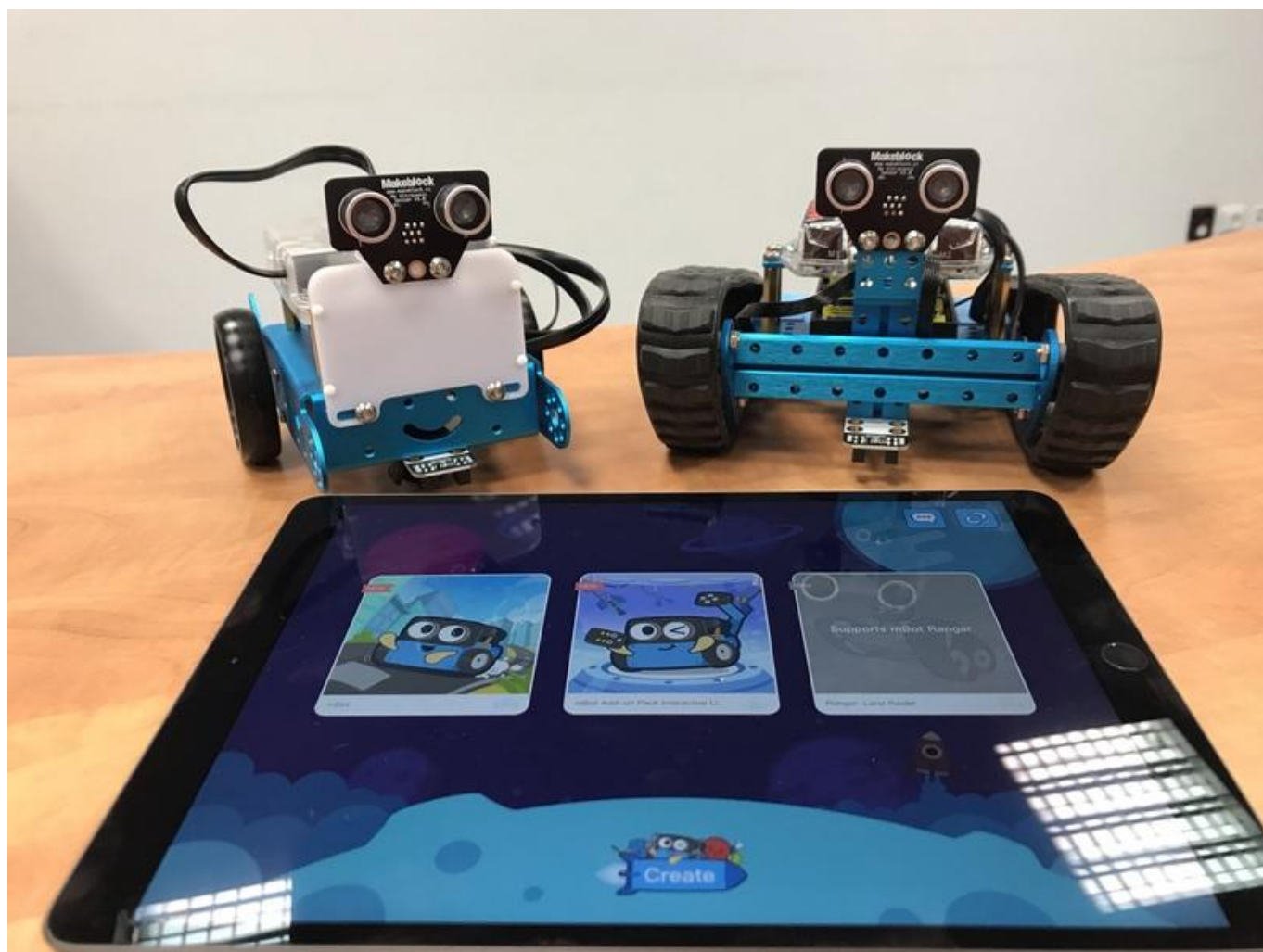
[18] K dispozici jsou i mBoti