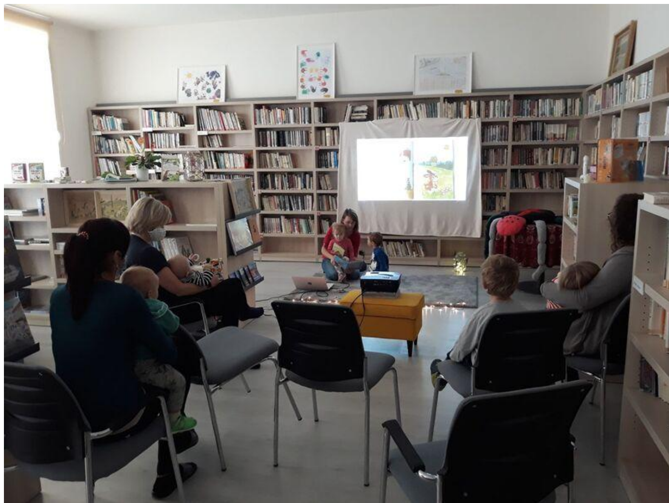
[18] Čtení pohádek s projekcí obrázků při zářijovém setkání