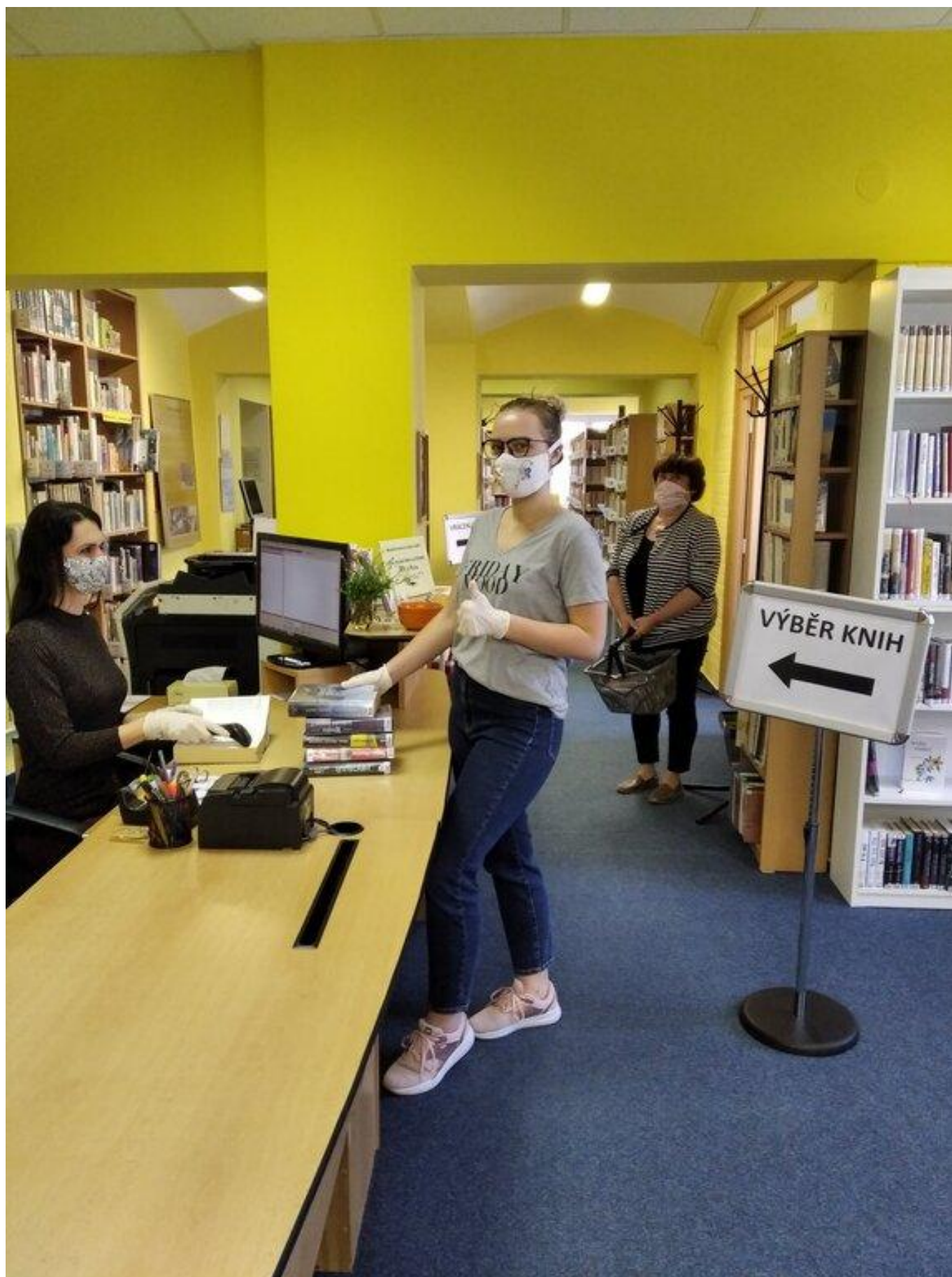
[13] V knihovně při opětovném otevření (27. dubna 2020)