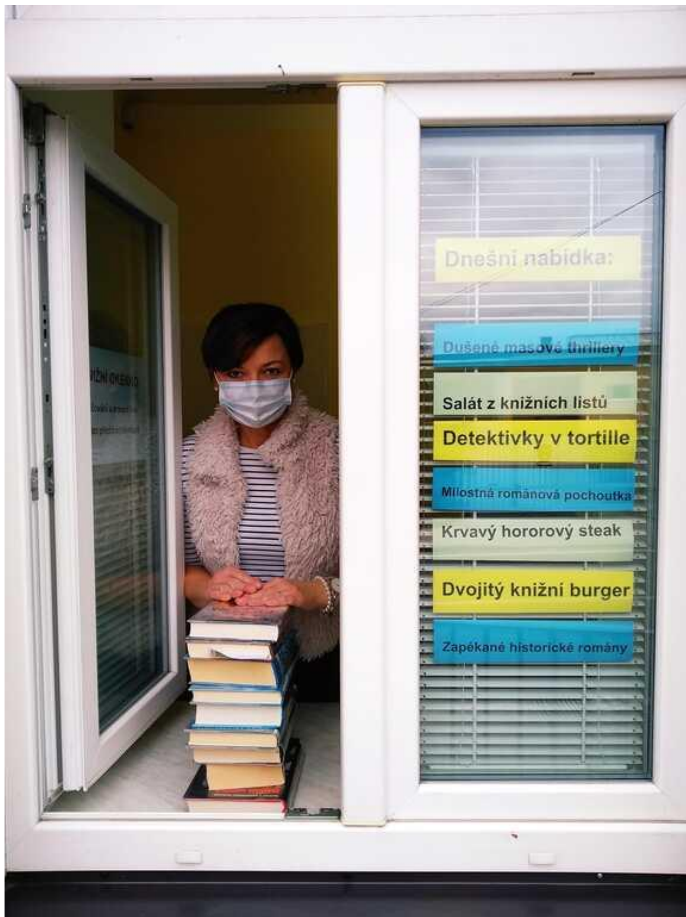
[11] Výdejní okénko neboli hladové okno