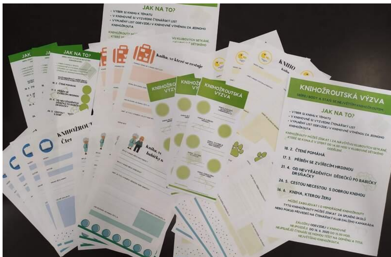
[16] Knihožroutská výzva

Pro rok 2020 měl klub připravenou Knihožroutskou čtenářskou výzvu s cílem oslovit nejen stále účastníky klubu, ale také další dětské čtenáře.