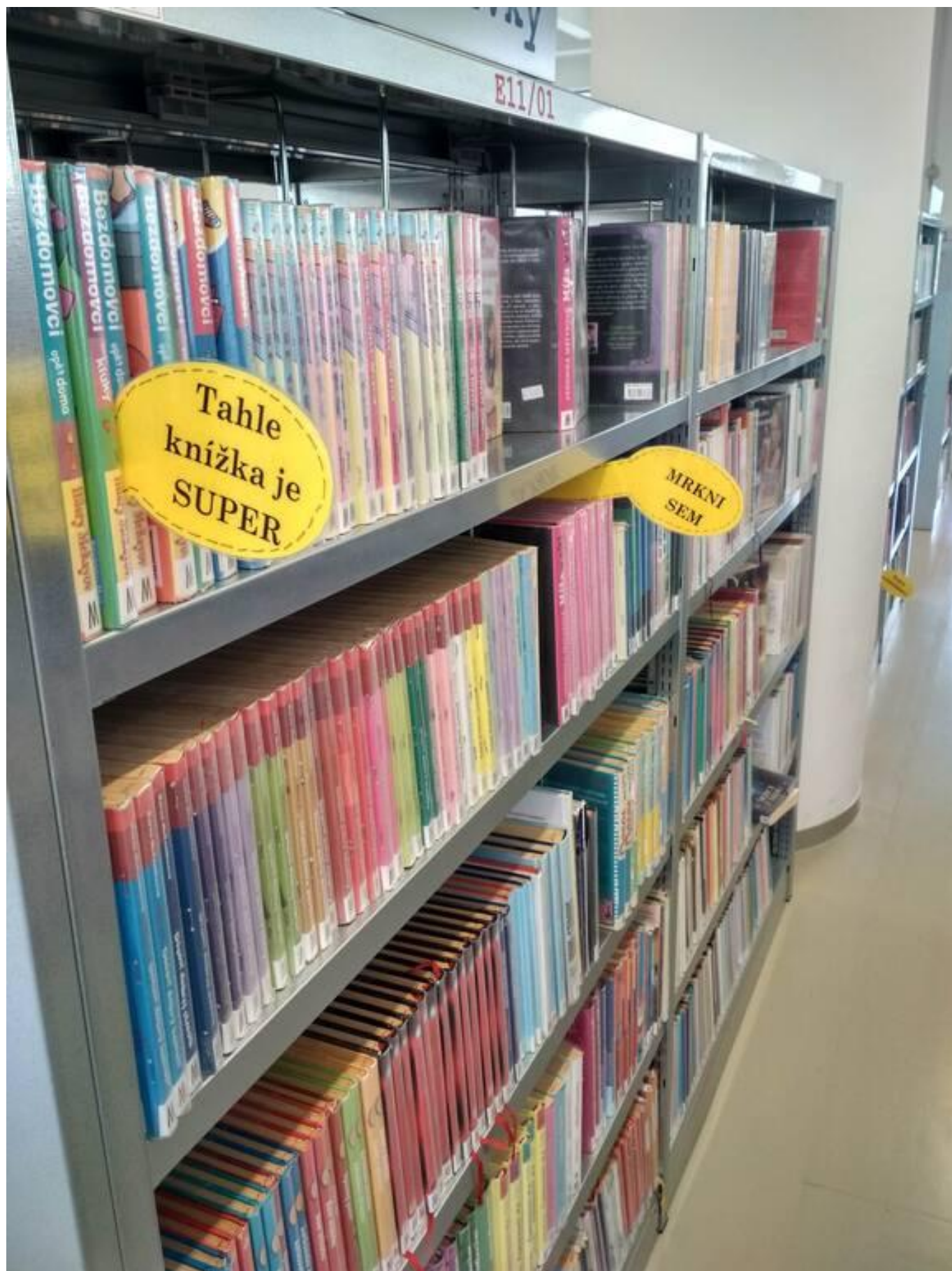
[15] Knihožrouti doporučují knížky