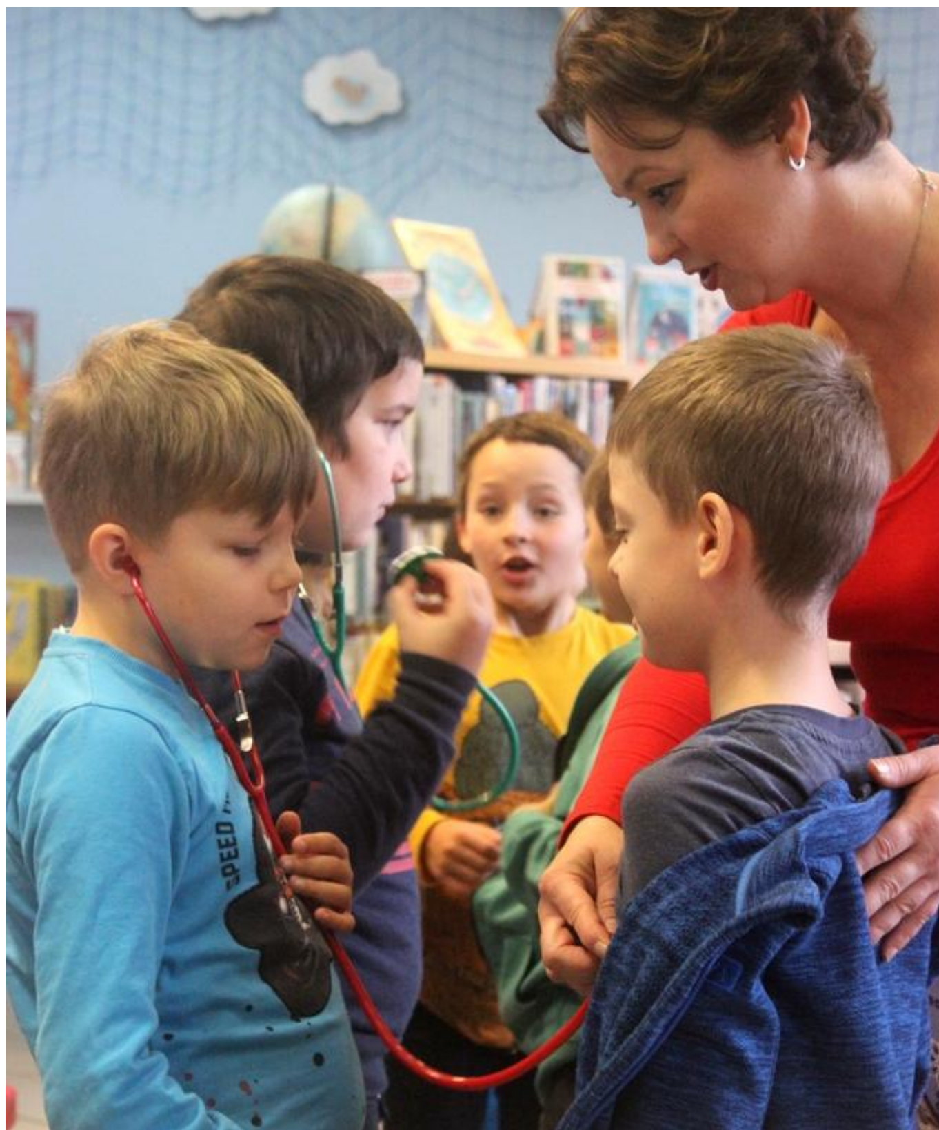
[18] Nechyběly ani stetoskopy