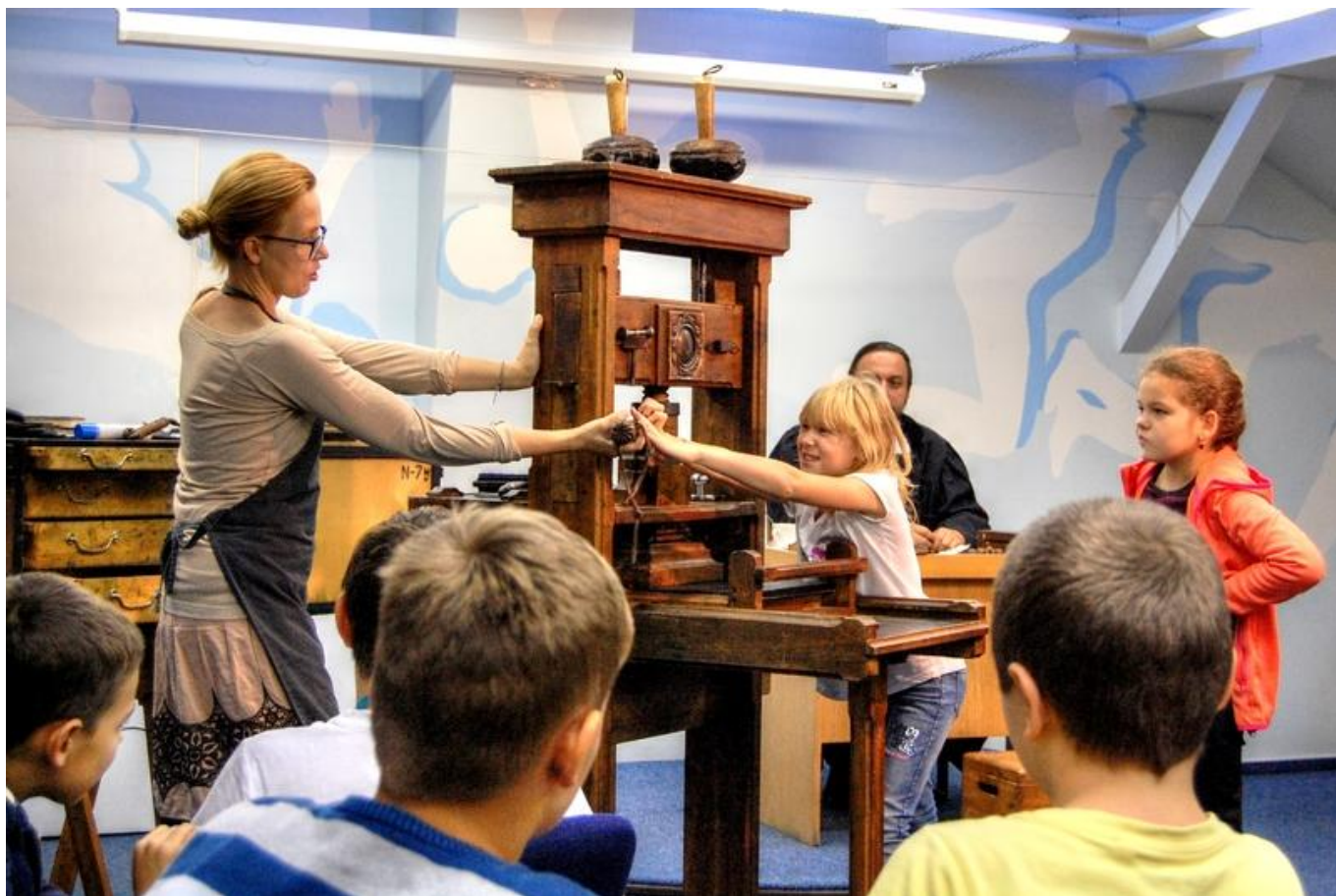
[15] Nezbytnou pomůckou je tiskařský lis