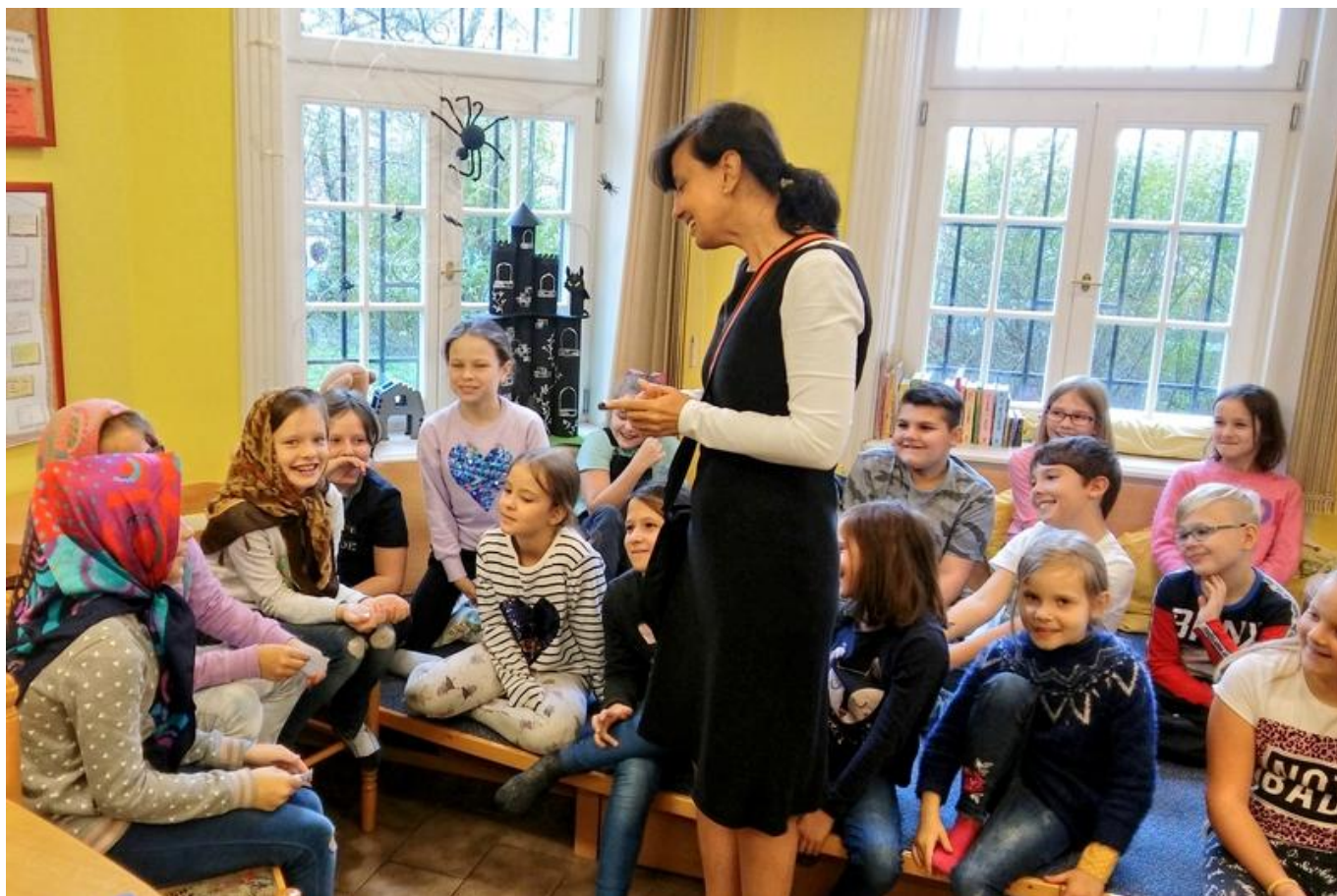
[22] Spisovatelka Lenka Rožnovská