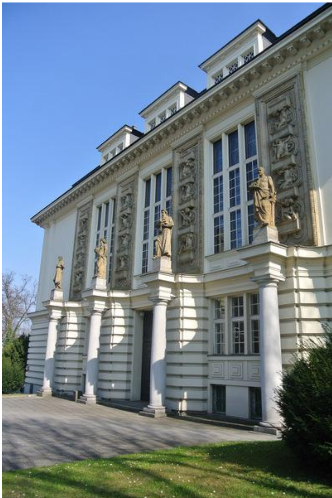
Průčelí budovy (r. 2015)