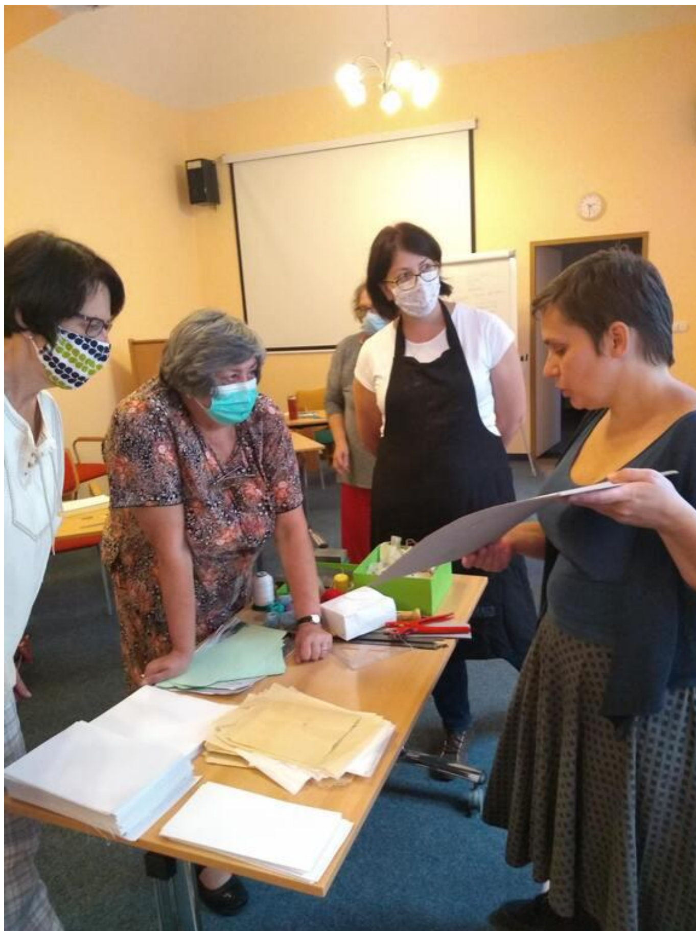
[11] Lektorka ukazuje používané materiály a vazby