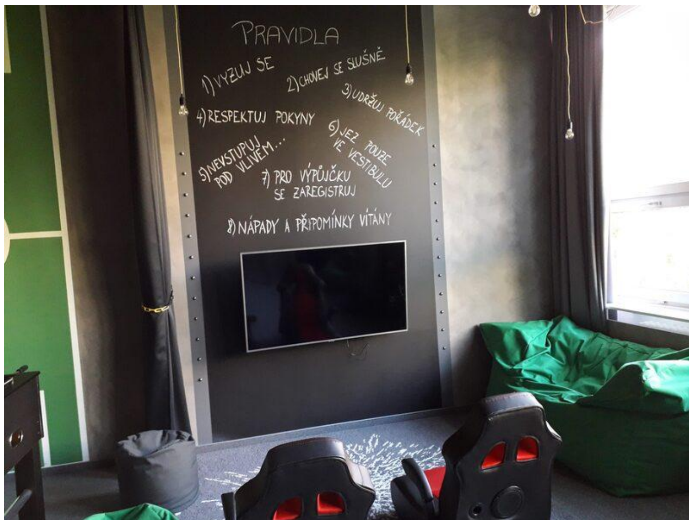
[14] Stěna pravidel

Na dodržování těchto pravidel a celkový chod klubu dohlíží jeden ze zaměstnanců hodonínské knihovny. V jeho kompetenci je zároveň i pořádání akcí v klubu.