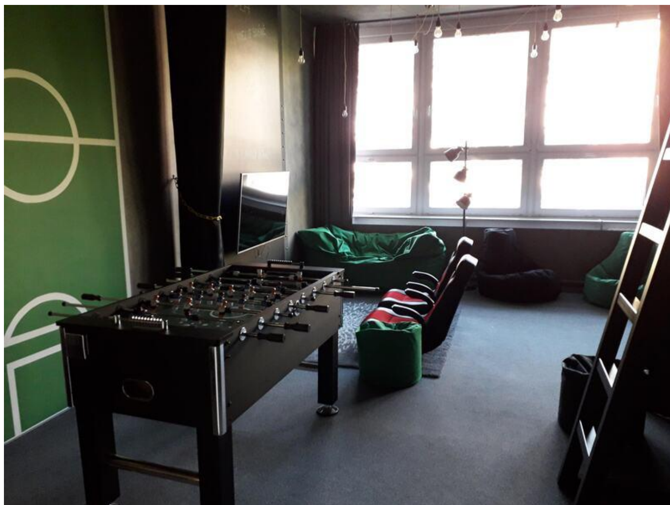
[11] Herní koutek