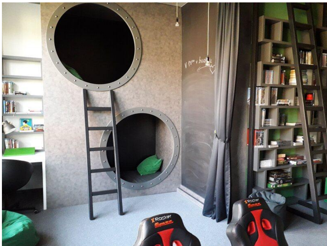
[12] Lehací bunkry