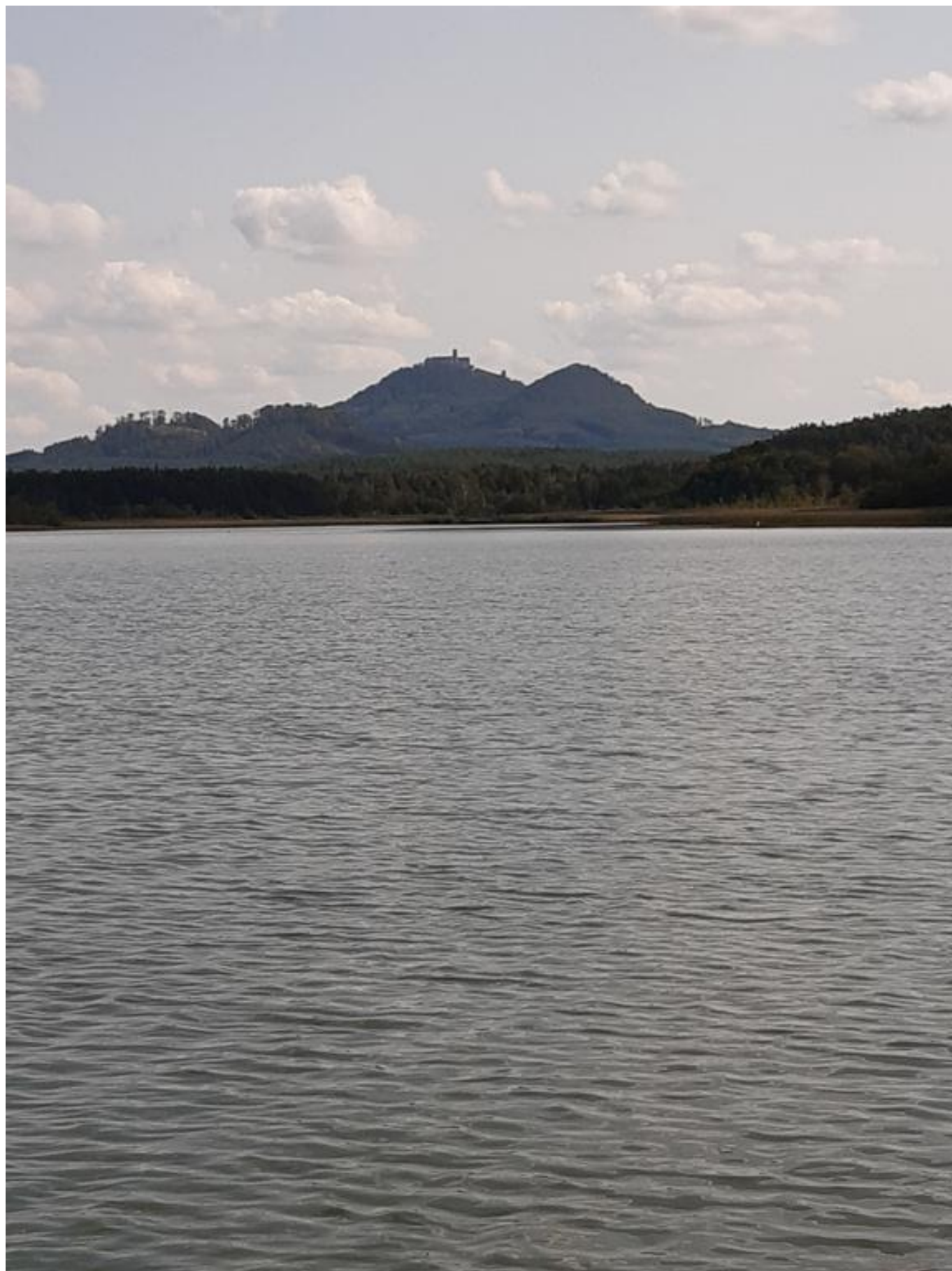
[9] Bezděz z vodní plochy Máchova jezera