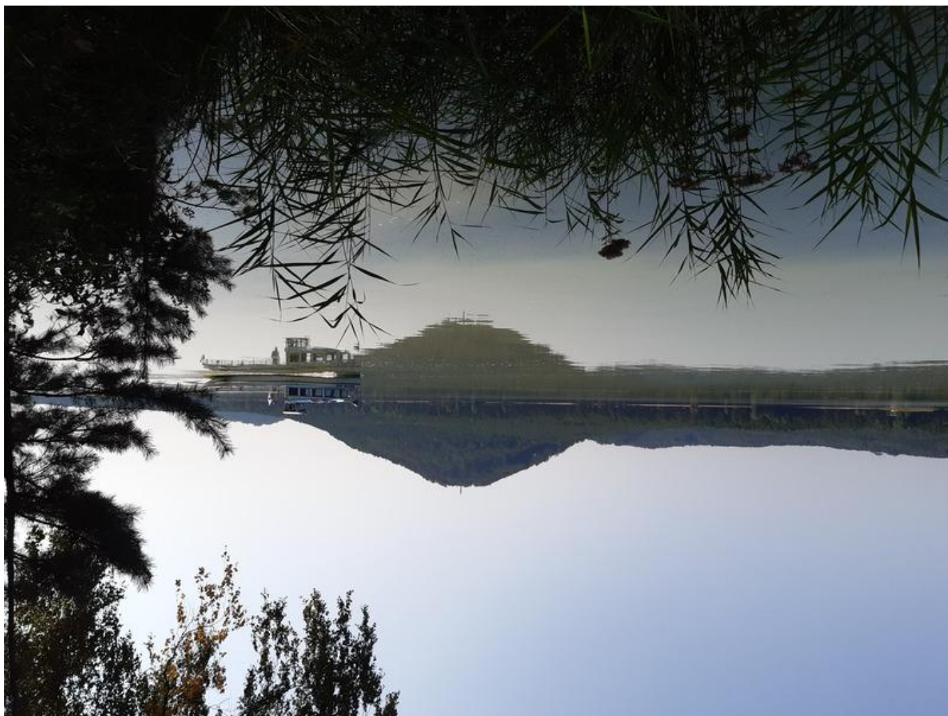
[8] Vrch Borný – symbol Máchova jezera