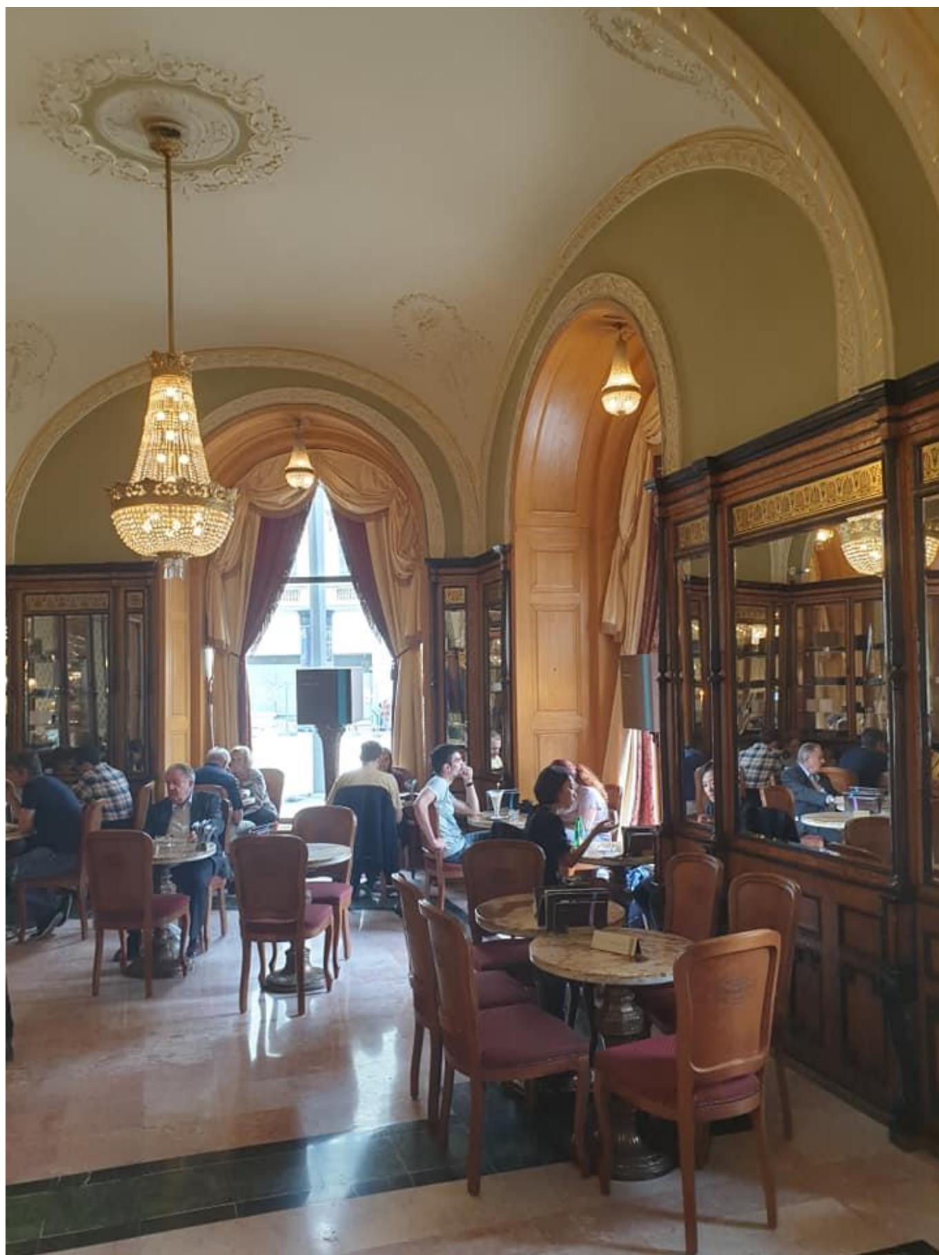
[13] Kavárna Gebaud v Budapešti