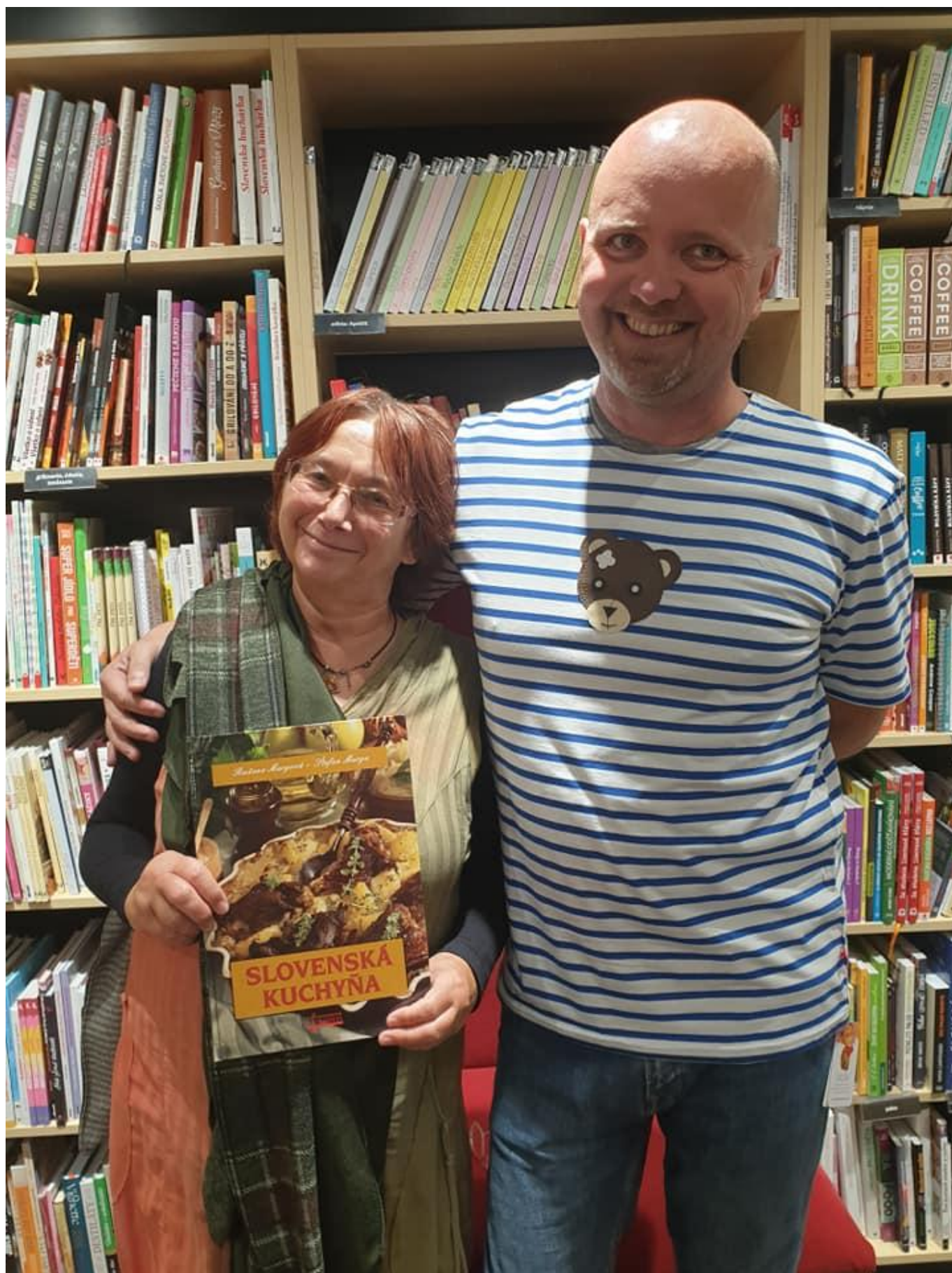
[15] Exkurze v knihkupectví Martinus v Bratislavě