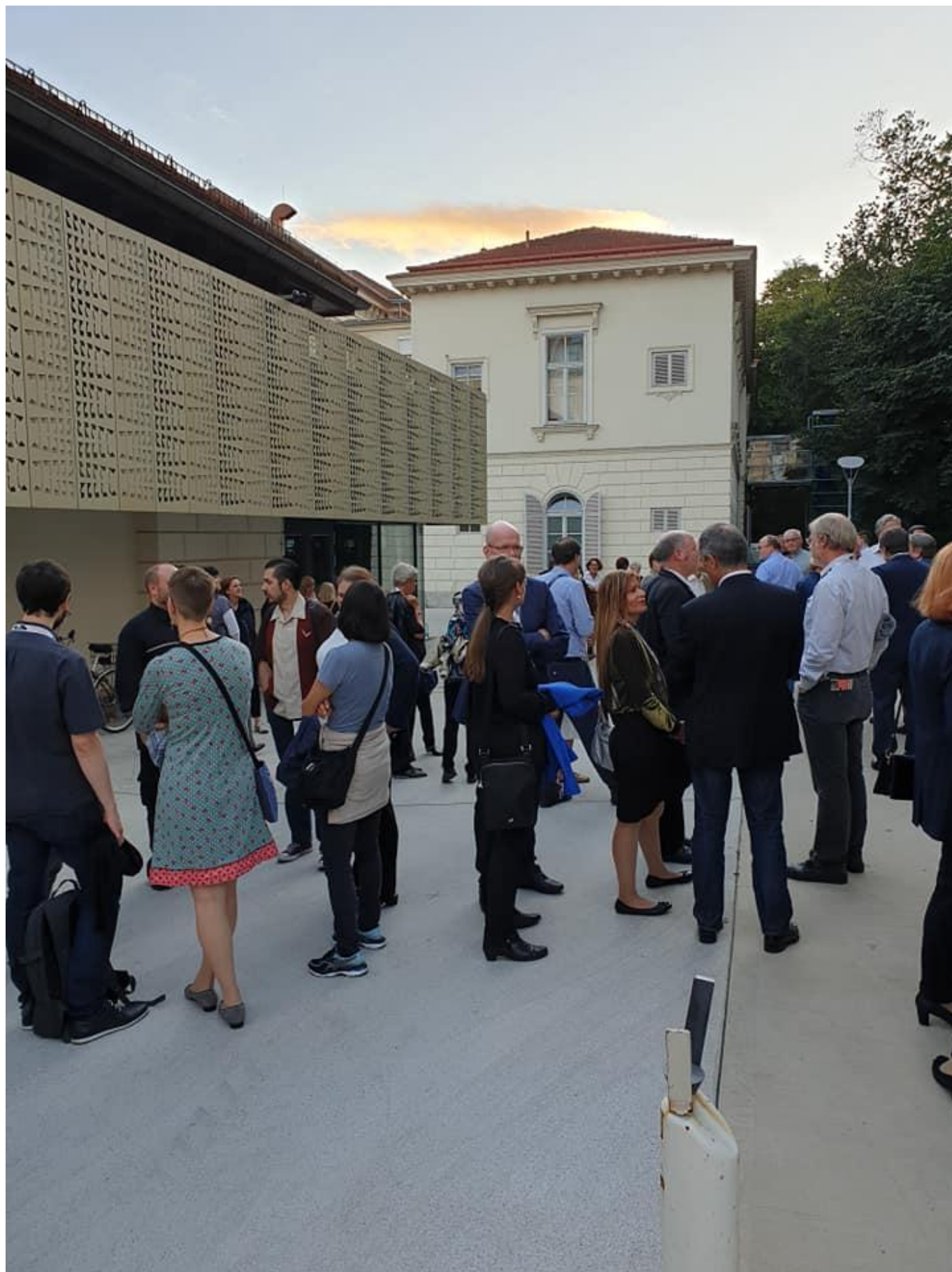
[19] Závěrečný ceremoniál v nové budově katedry hudby Univerzity ve Štýrském Hradci