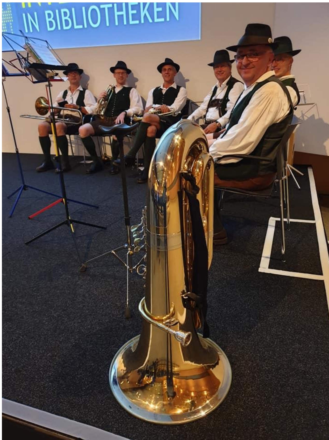
[14] Zahajovací ceremoniál v Kongresovém centru města Štýrský Hradec