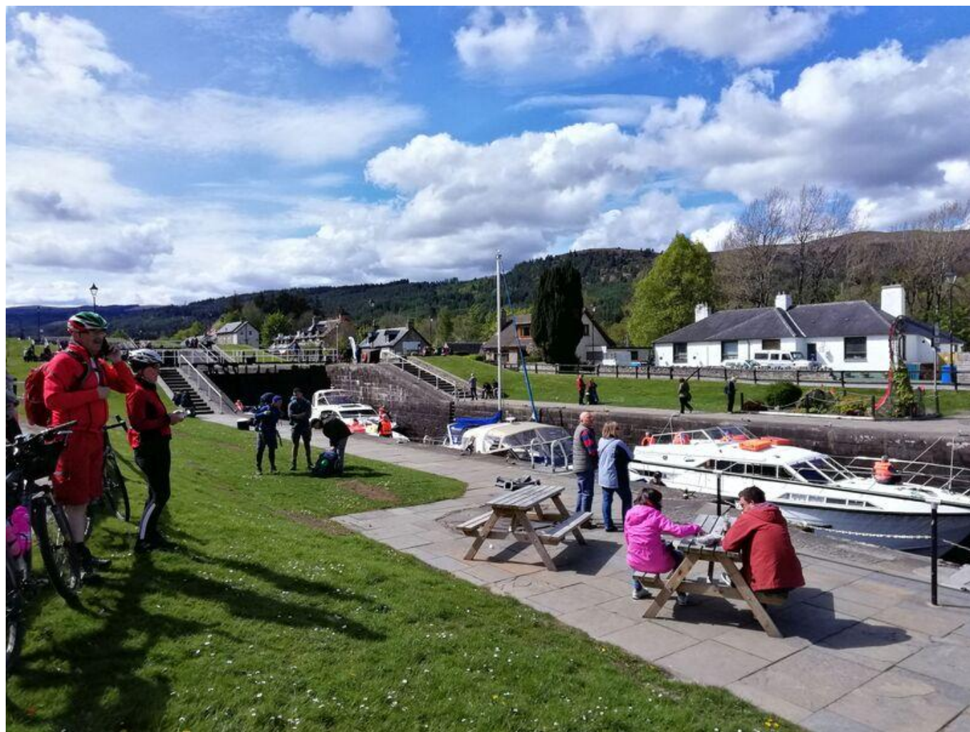
[30] Fort Augustus - pod zdymadly