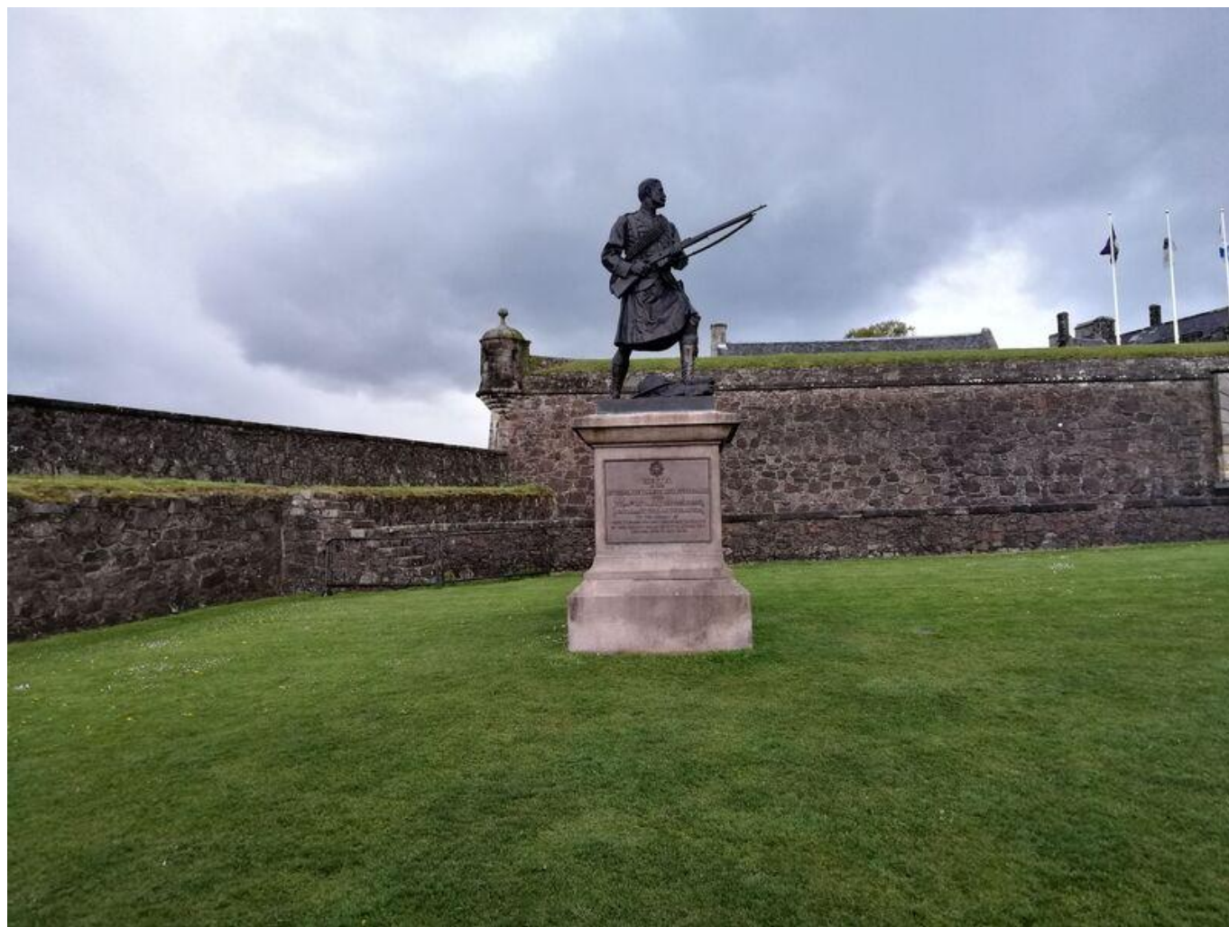
[42] Stirling Castle