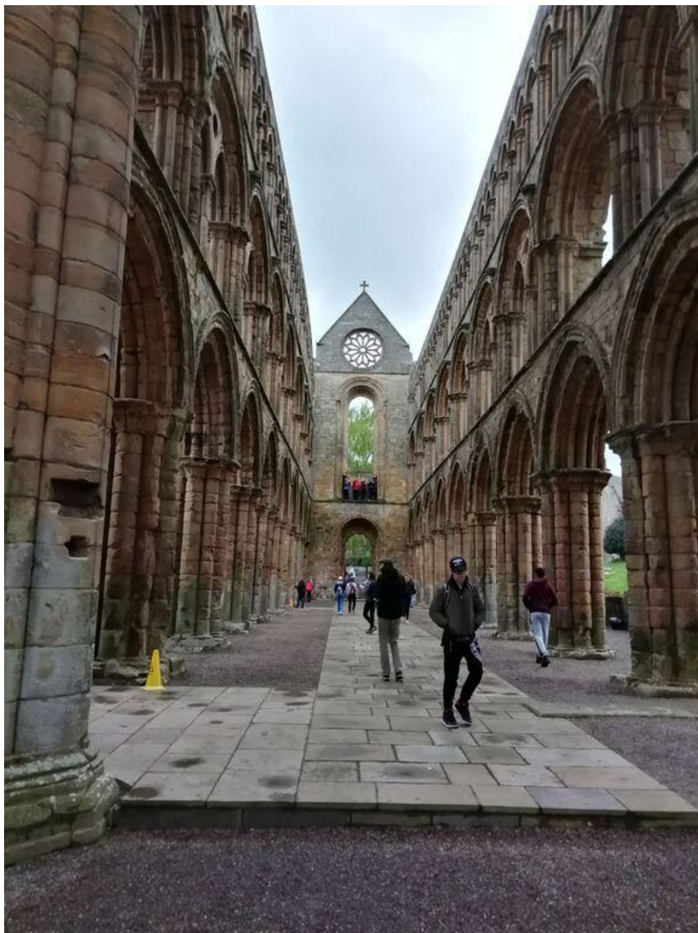
[12] Jedburgh - chrámová loď