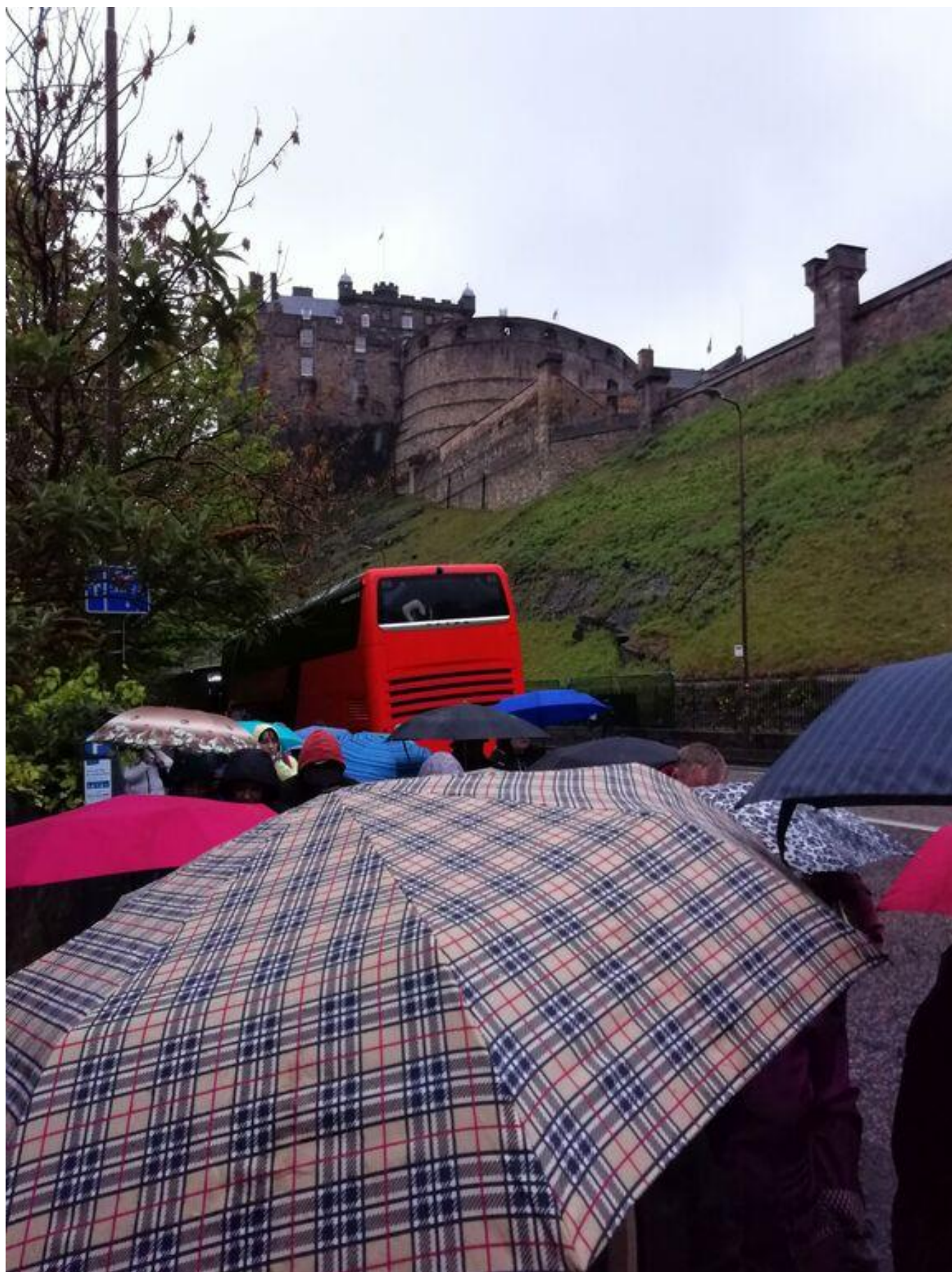
[17] Edinburgh – hrad na skále, deštníky a náš doubledecker