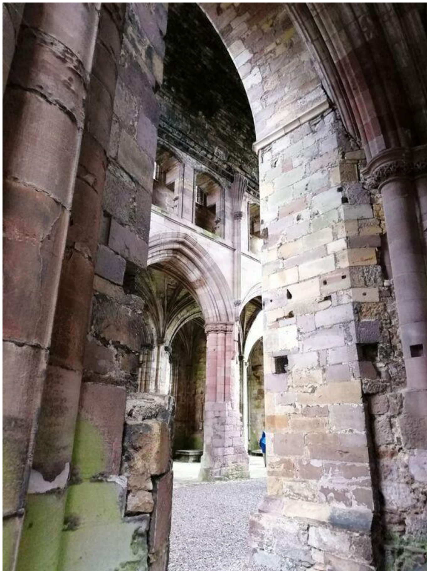
[14] Melrose Abbey - pohled do křížení chrámových lodí