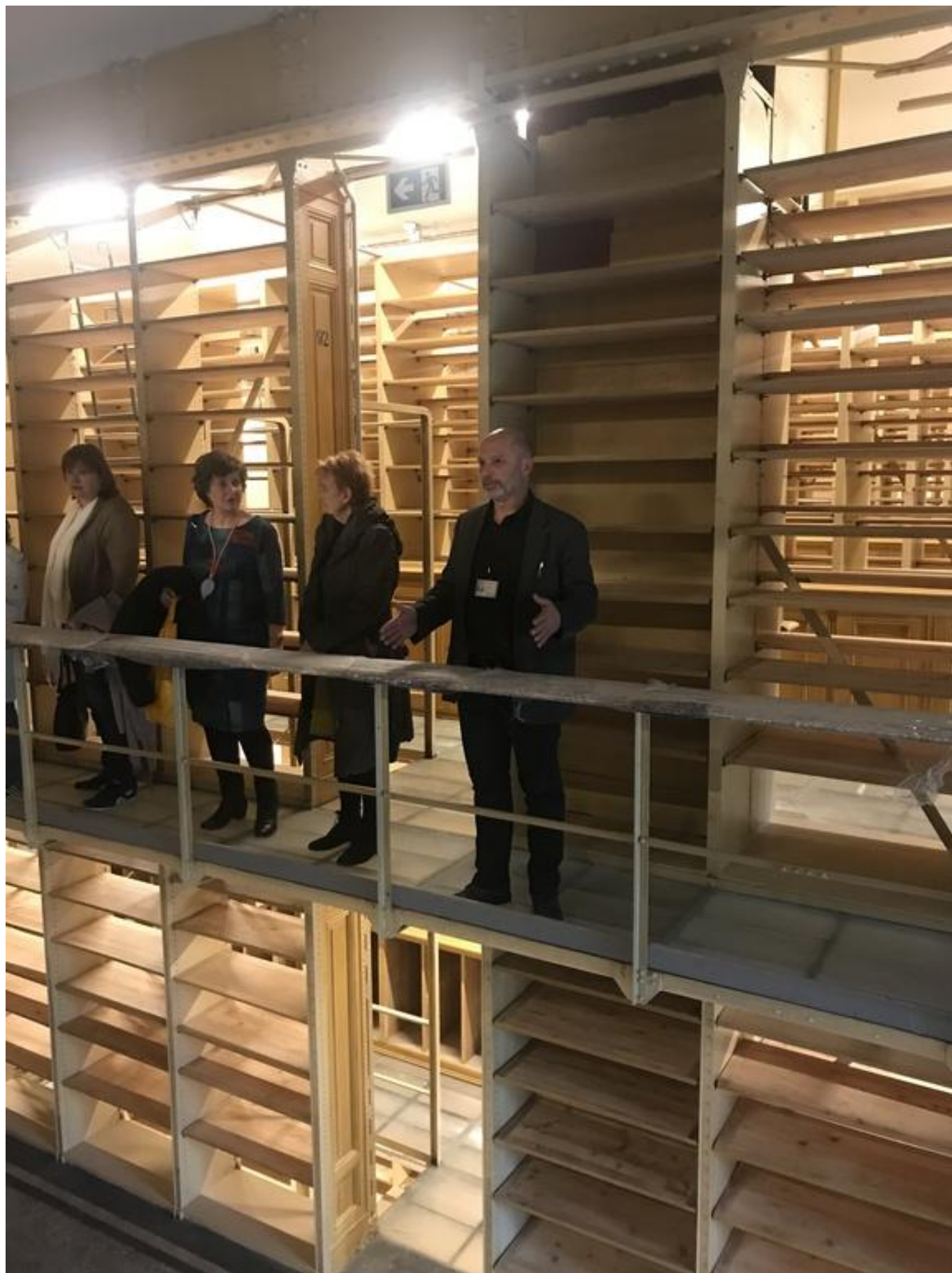
[15] Národní muzeum - zatím prázdné sklady knihovny