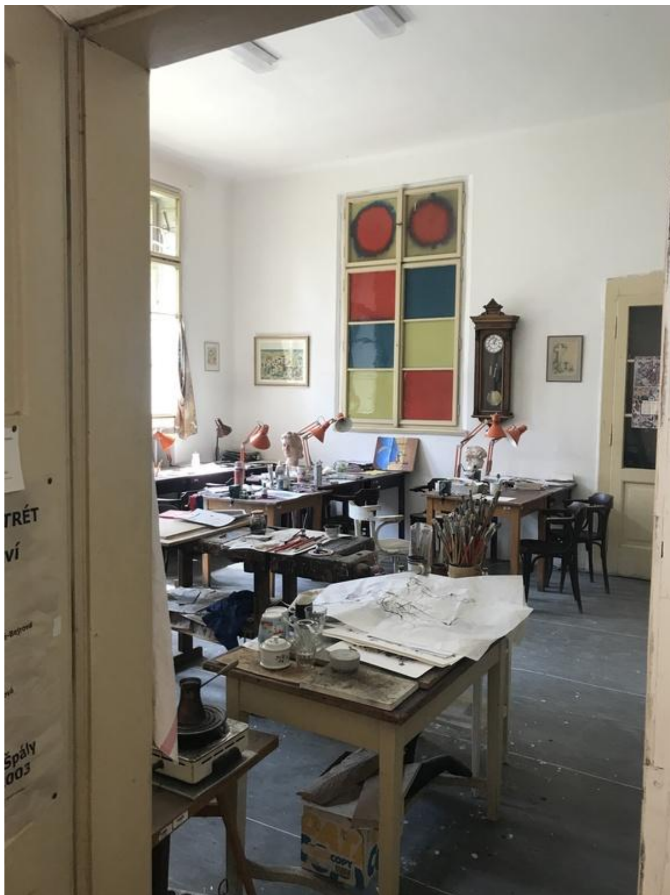
[19] Knihovna Psychiatrické nemocnice Bohnice – terapeutická dílna v knihovně