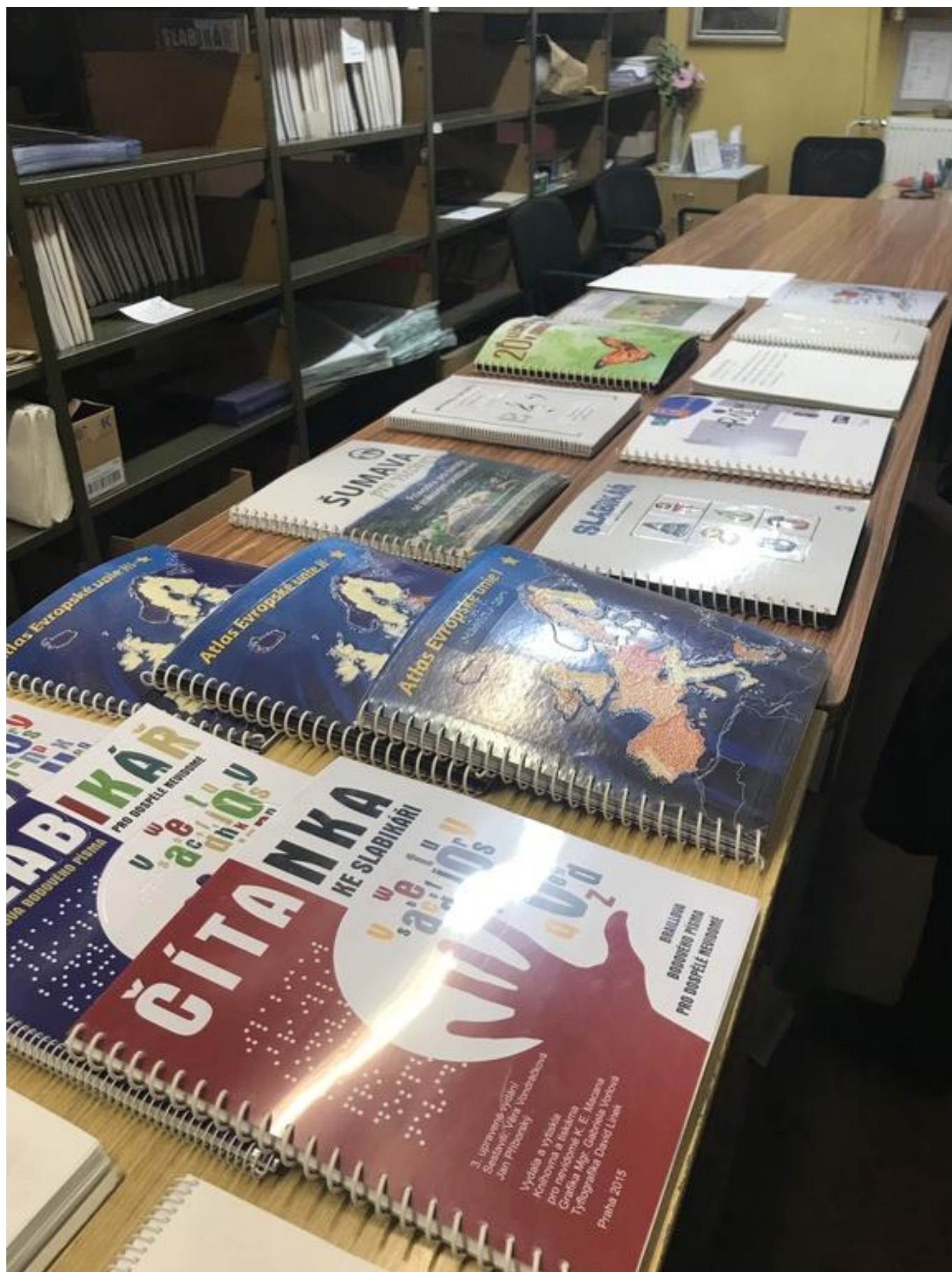
[17] Knihovna a tiskárna pro nevidomé K. E. Macana - produkce tiskárny