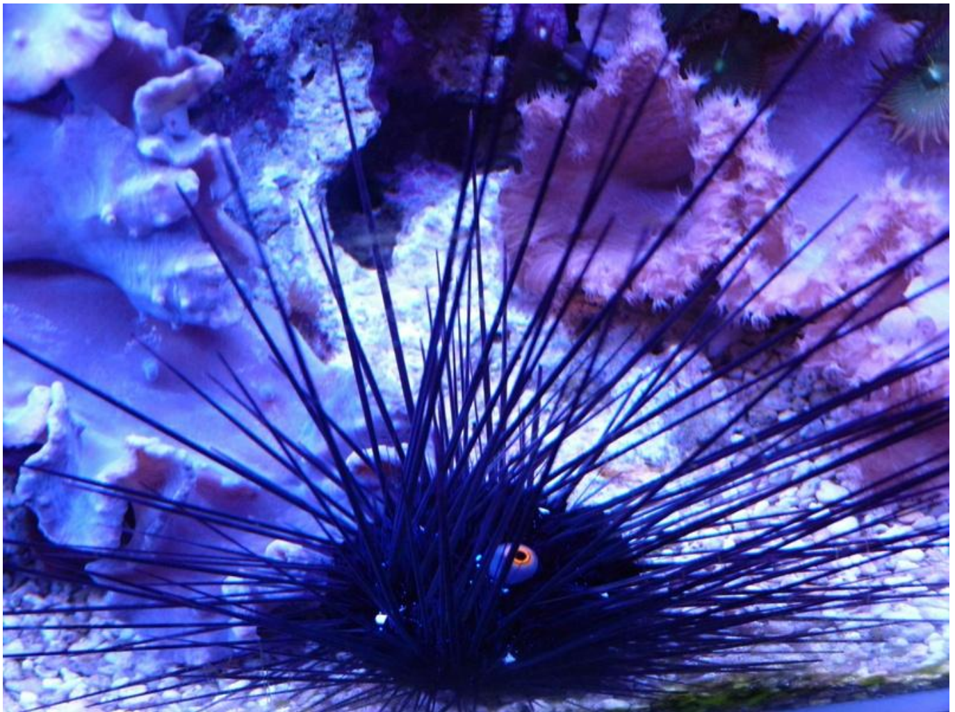
[20] Krásy moře

V kategorii dětí do 15 let se na skvělém 2. místě ze 46 fotografií umístil Šimon Franc z Mokřého s fotografií Krásy moře.