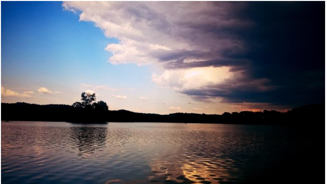
[17] Tajemno přichází