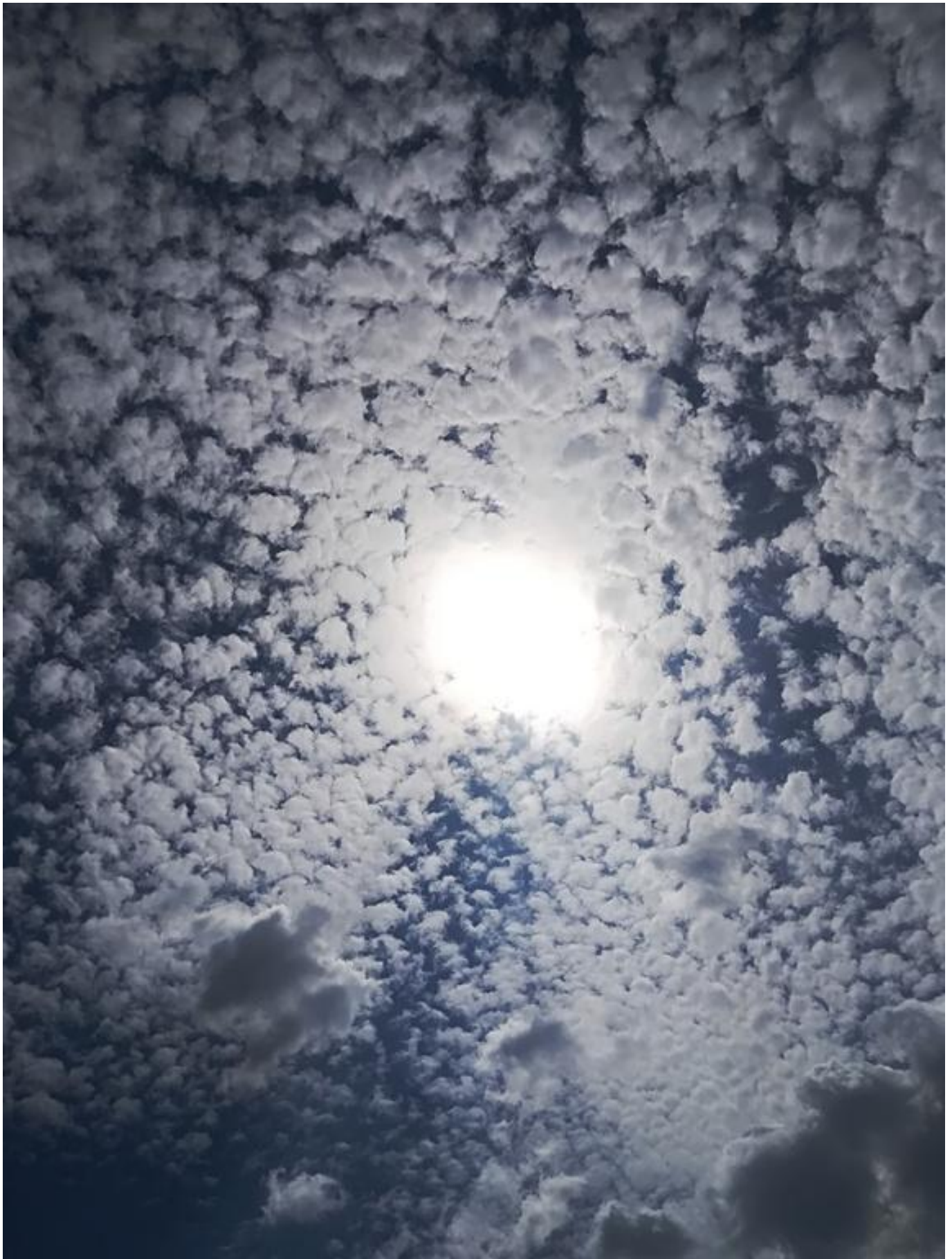
[15] Slunce v pěřinách