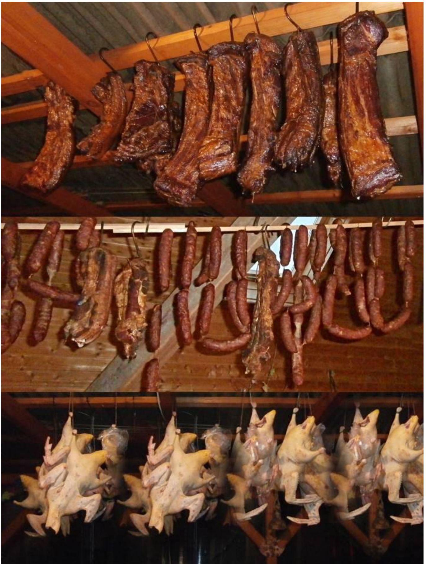
[18] Hvězdokupy třetí generace