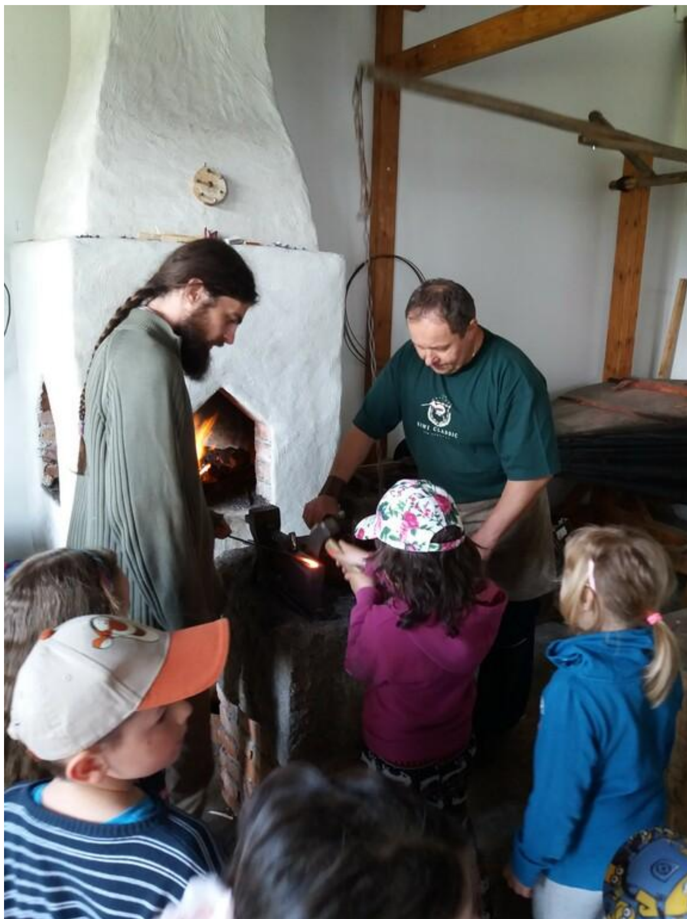
[14] Program Řemesla známá i neznámá