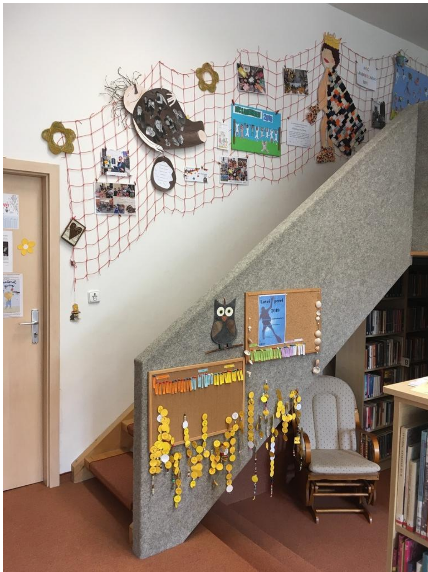
[13] Nyní jsou již doplněny i o koláž z letošního roku (Otesánka)