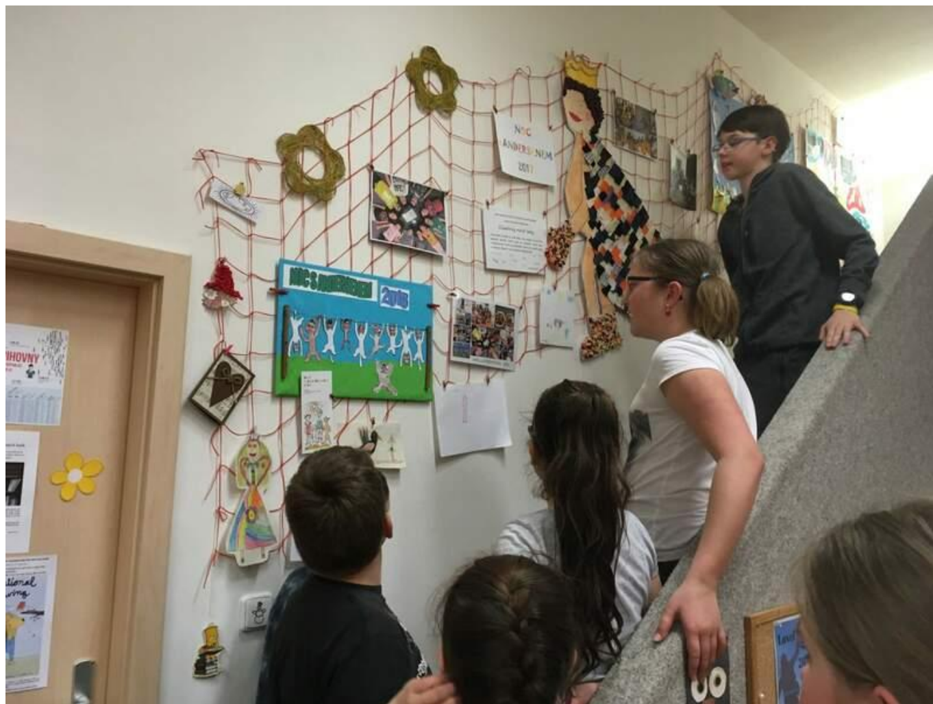
[12] Vystavené koláže z předchozích Nocí s Andersenem