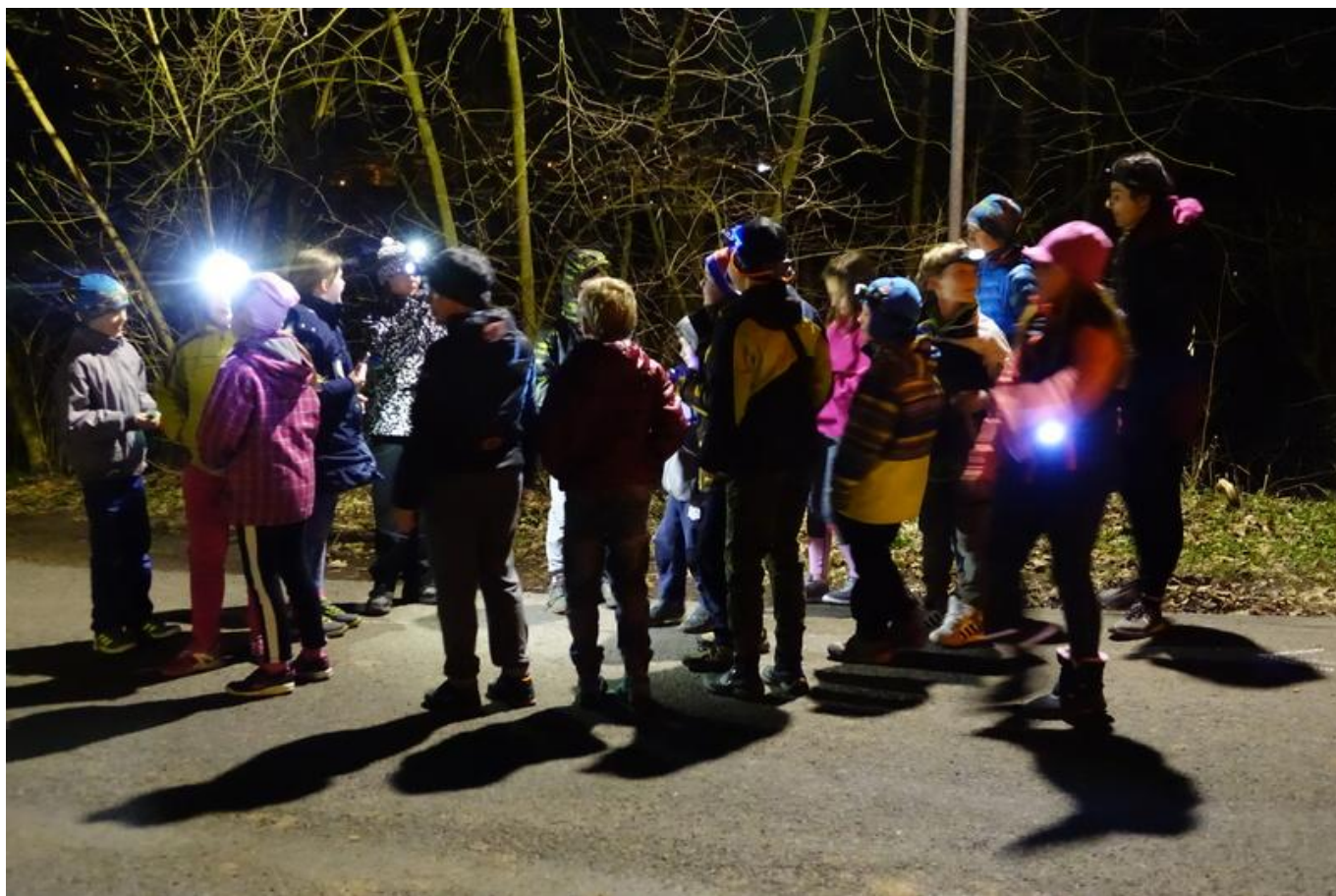
[18] Noční šipkovaná