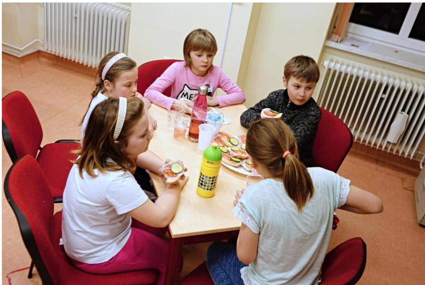
[13] Před další činností je třeba se posilnit