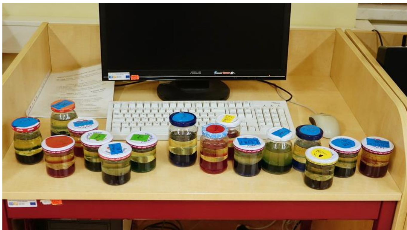
[14] Každý máme svou lávovou lampu