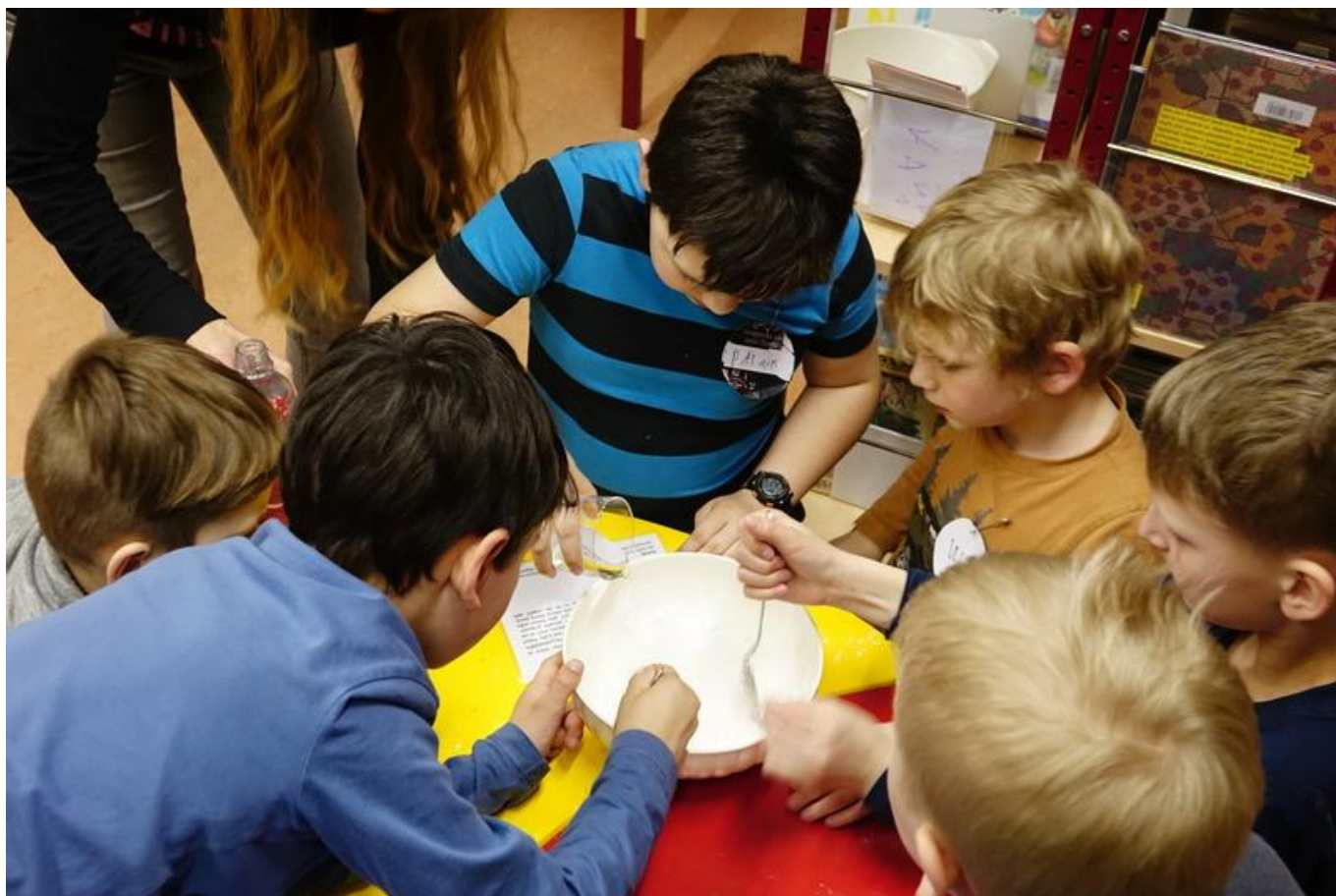
[15] Vyrábíme nenewtonovskou kapalinu