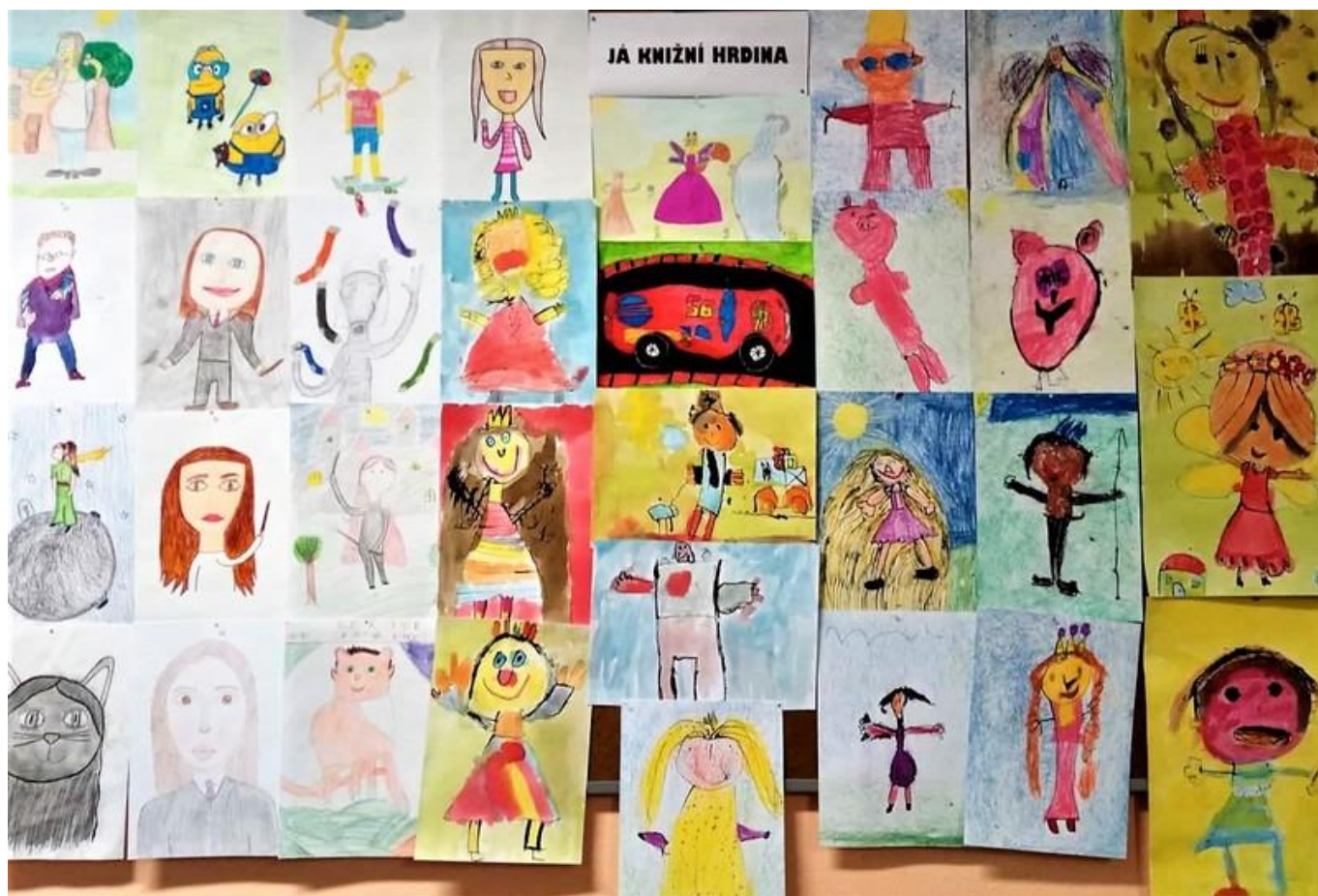
[11] Výtvarná díla našich umělců

Mladší děti také vytvářely krásné a nápadité fantasy komiksové příběhy. Pražské nakladatelství CREW s.r.o. bude oceňovat ty nejlepší a my doufáme, že alespoň jeden šikula z Pardubic zazáří. Pro nás jsou však vítězové všichni.