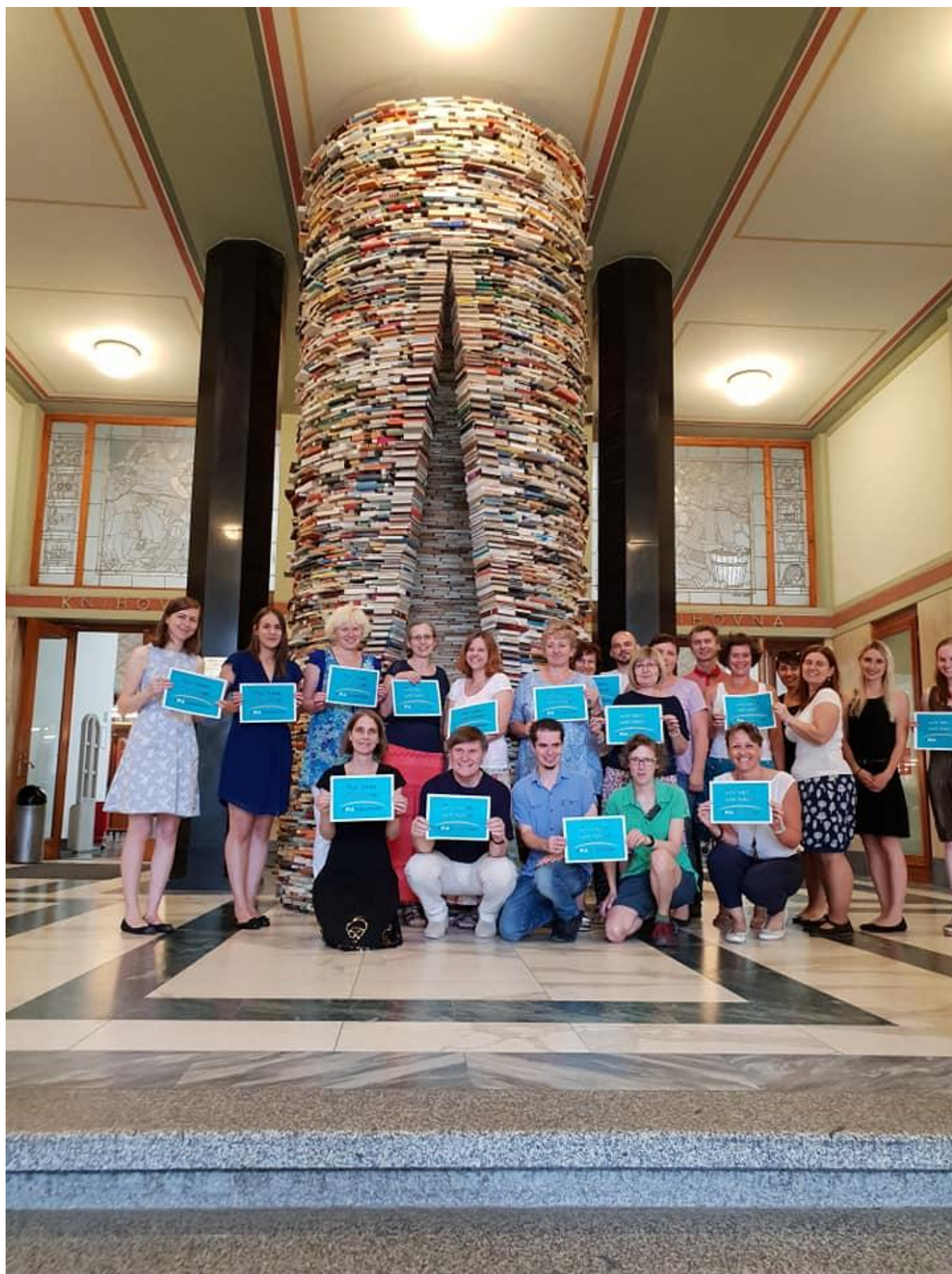
[17] Účastníci prvního workshopu