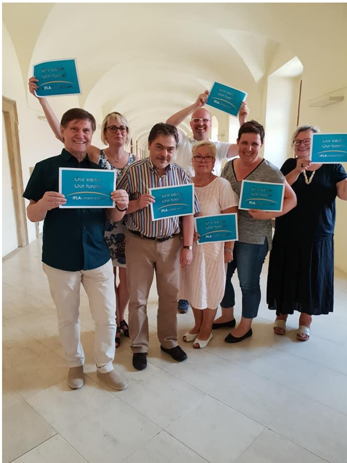
[18] Účastníci druhého workshopu