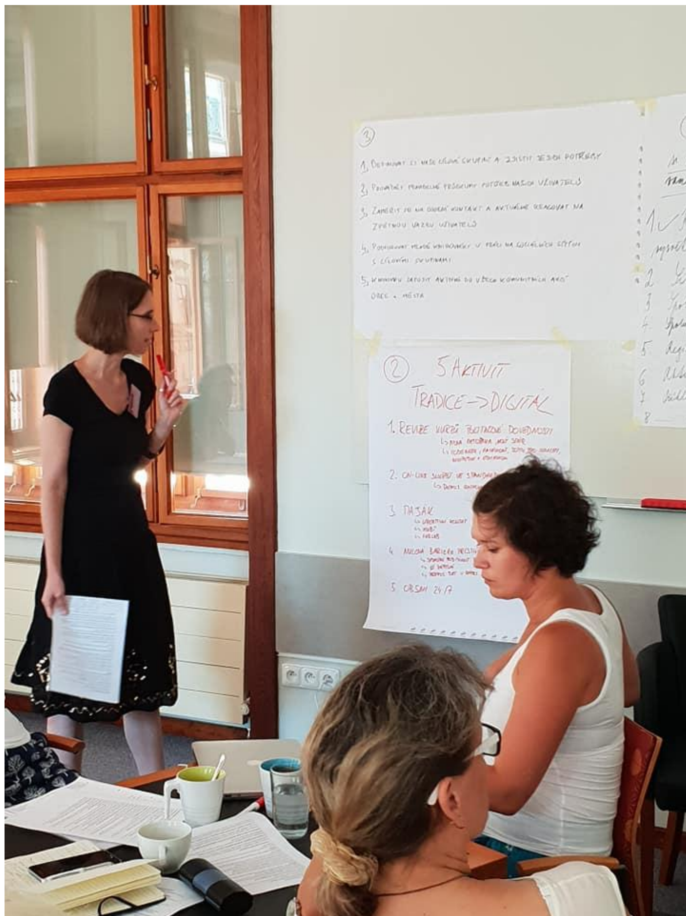
[14] Z prvního workshopu