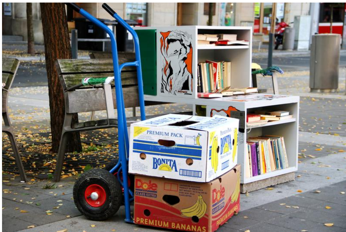
[12] Jiřinka v novém

Další změnou, kterou realizace v průběhu oněch necelých tří let přinesla, je podoba knihovniček. Jednotlivé regály byly před rozbíjením počasí chráněny dvířky z plexiskla. Ta se však nějakým záhadným způsobem často rozbíjela, a tak – protože jsme neměli prostředky na doporučený typ plexiskla užívaný na hokejových stadionech – jsme se rozhodli vydat jinou cestou. Korpus laviček jsme nabídli dalšímu brněnskému studiu, tentokrát výtvarníkům z ateliéru Malujeme jinak [11] (ateliér se specializuje na velké nástěnné malby v interiéru i exteriéru, ale také grafiku a ilustrace), a dali jim poměrně volnou ruku s jednoduchým zadáním vytvořit z laviček výtvarné dílo. Předpokládali jsme, že lavičky s unikátní malbou budou vandalům odolávat lépe, a jsme rádi, že se tento předpoklad potvrdil. Za necelý rok existence laviček ilustrovaných graffiti stylem jsme nezaznamenali jediný šrám na kráse.