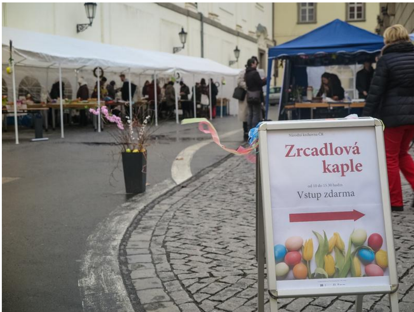
[19] Pozvánka do Zrcadlové kaple