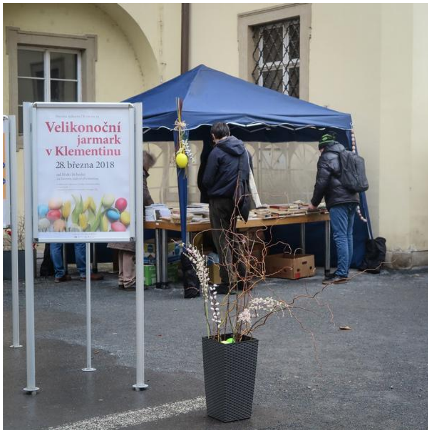
[18] Bazar knih