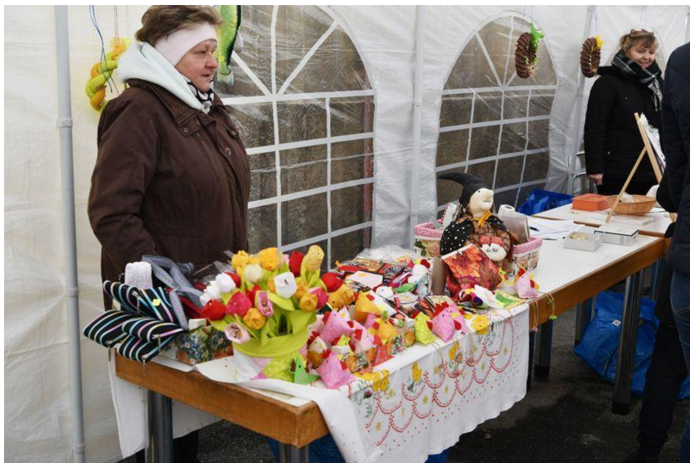
[22] Šité tulipánky a slepičky (foto: Eva Hodíková, Národní knihovna ČR)