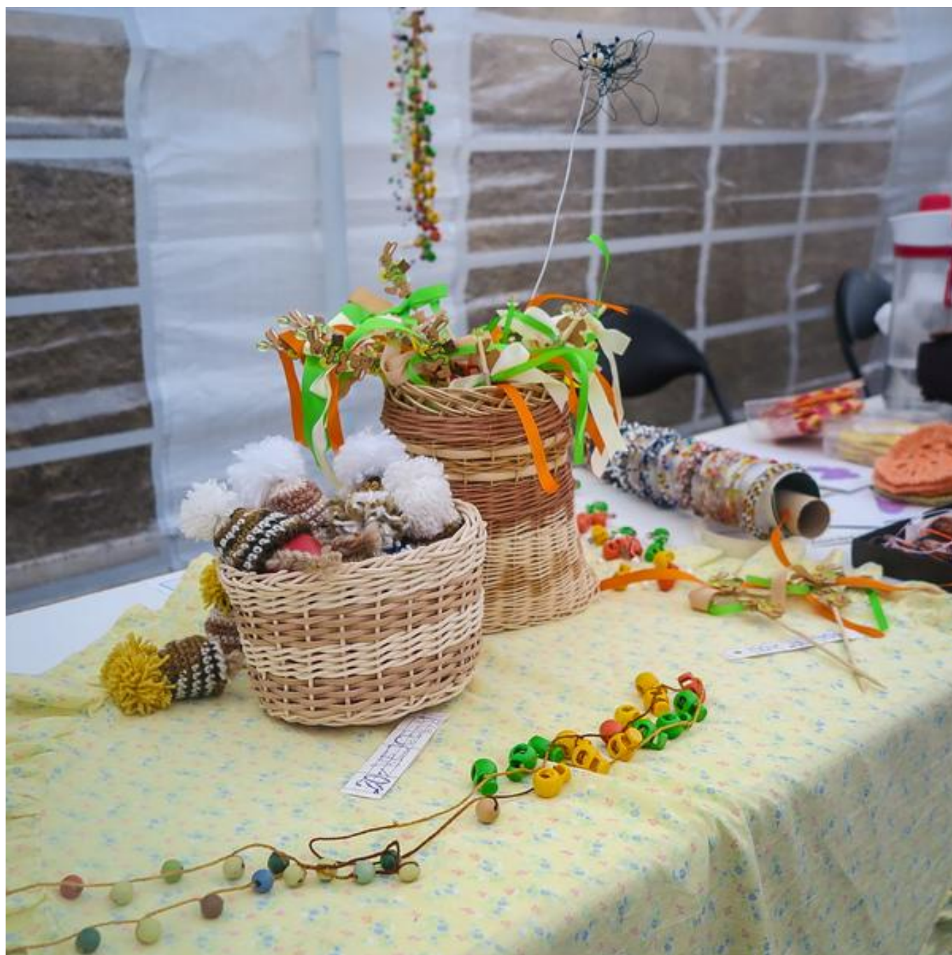
[32] Košičkářské zboží kolegyně z Liberce