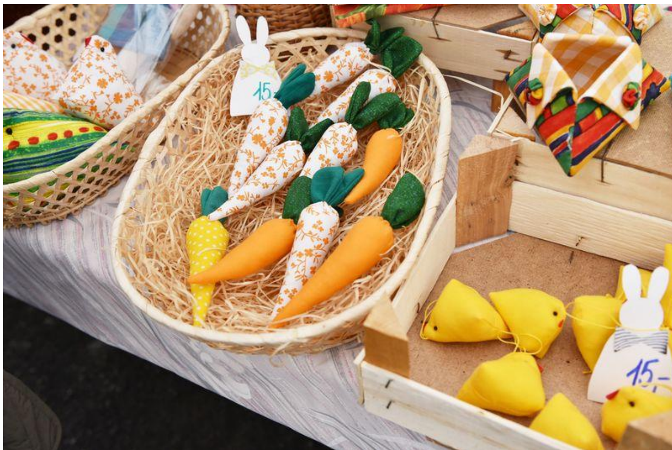
[25] Šitá kuřátka a mrkvičky