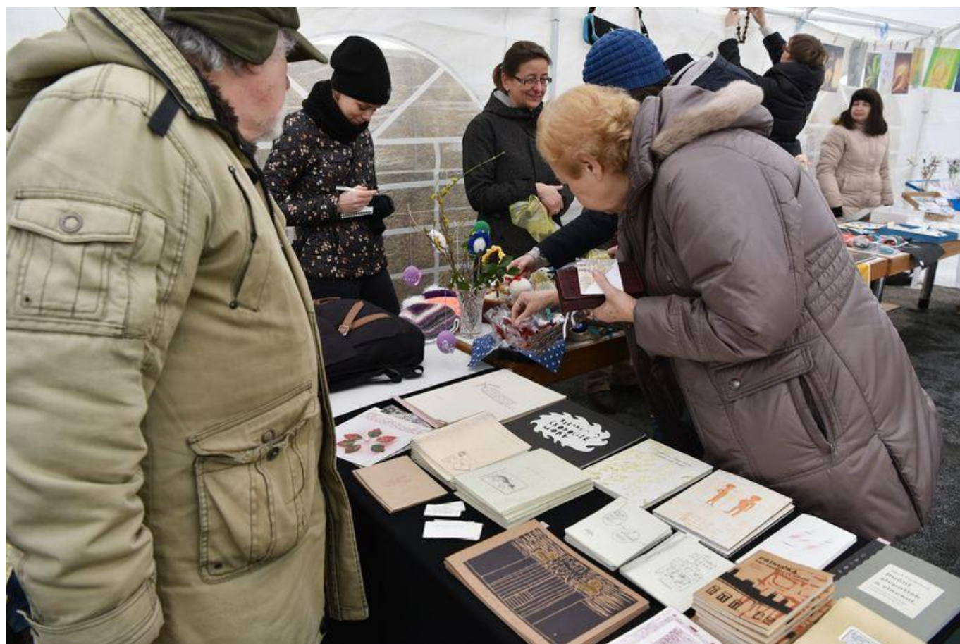
[26] Knihy nakladatelství Bylo nebylo