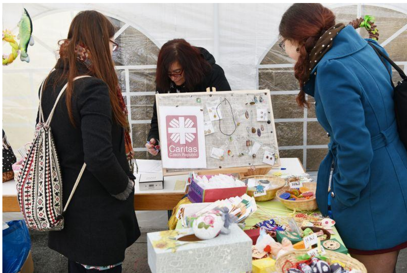
[23] Výrobky Farní charity Praha 1