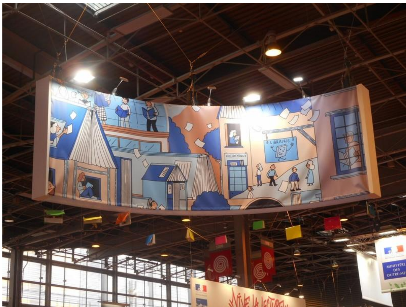
[12] Výzdoba v hale