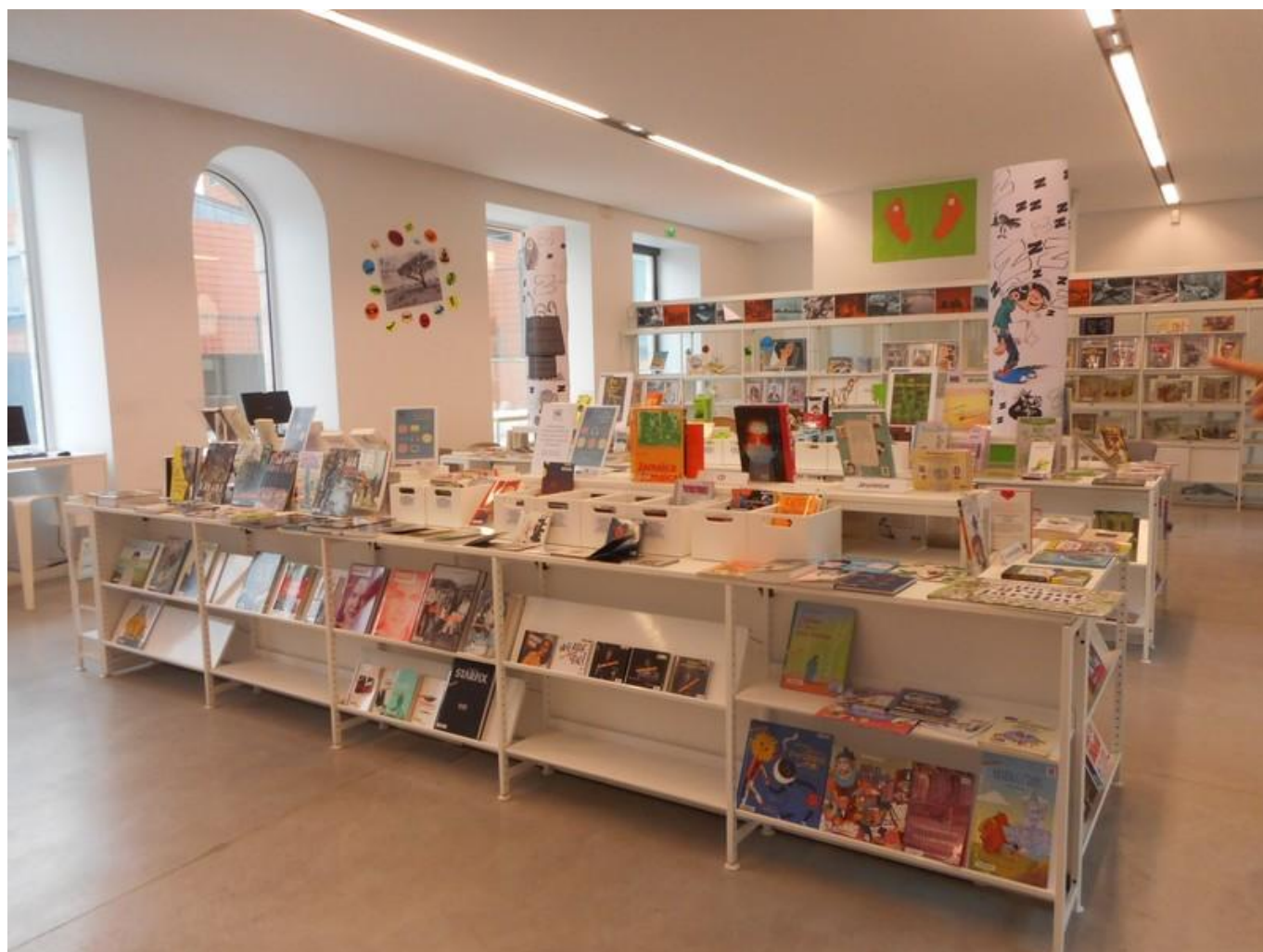
[24] Médiathèque Françoise Sagan - za vstupem