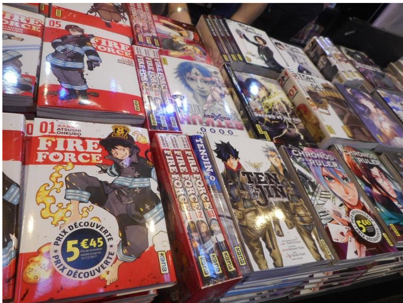
[14] Jeden z oblíbených žánrů – manga