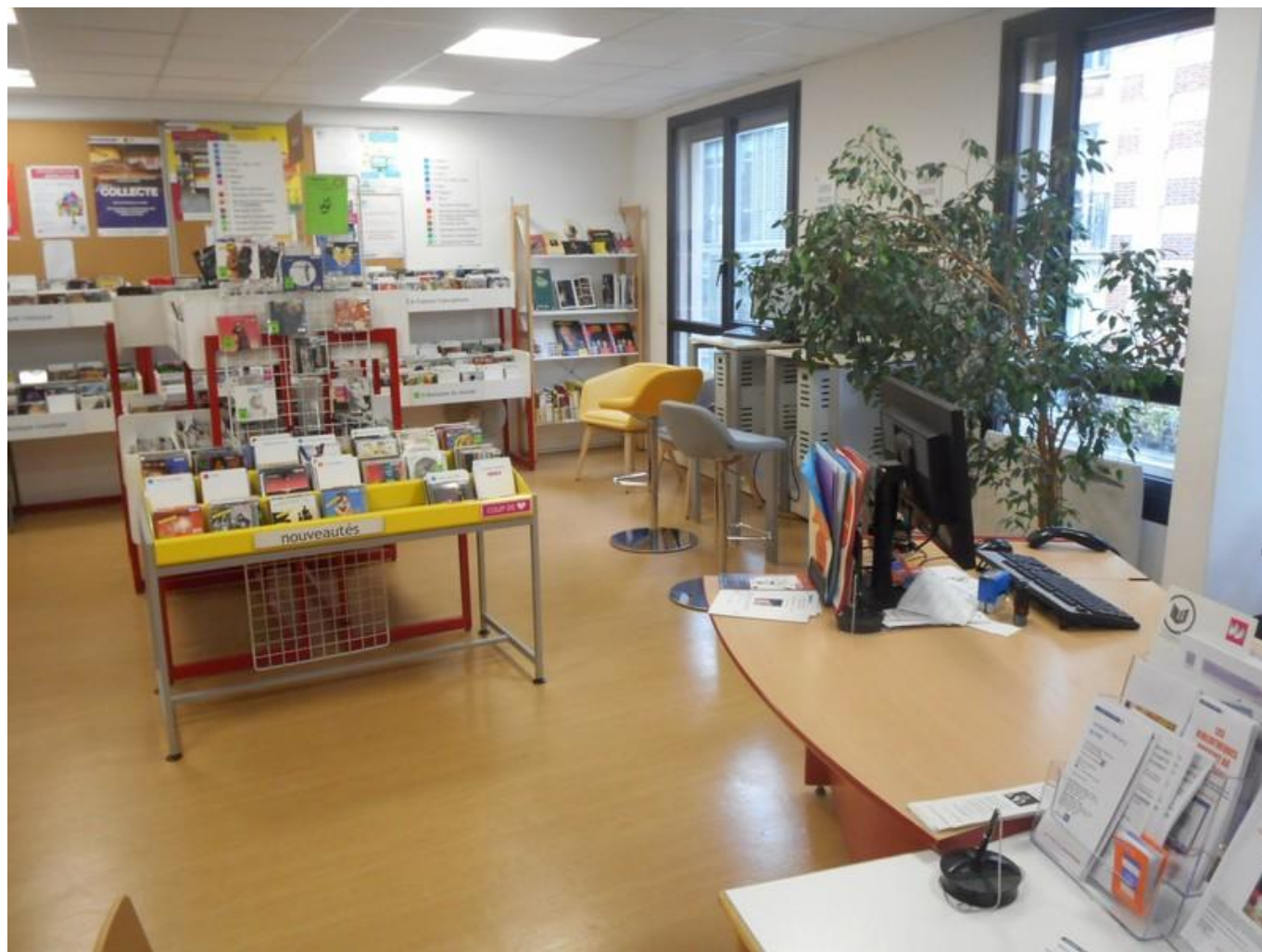
[28] Bibliothèque Amélie - interiér