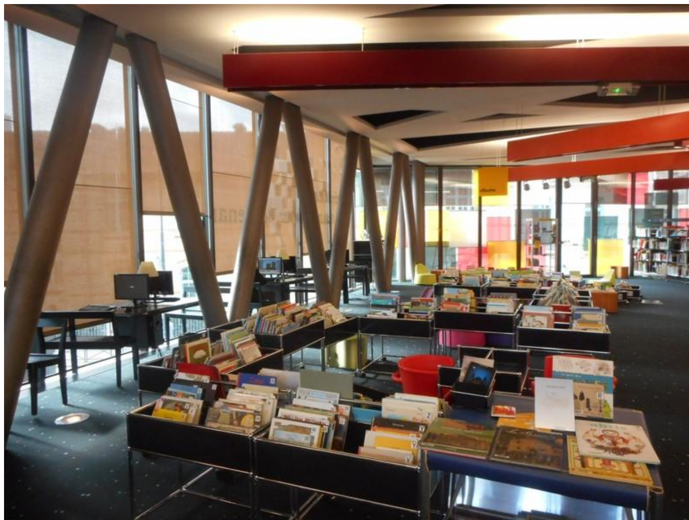
[32] Médiathèque Marguerite Yourcenar – část volného výběru