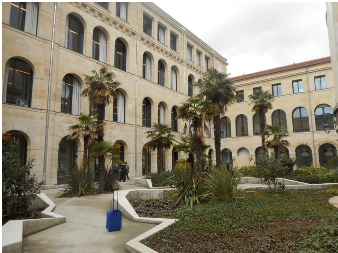
[23] Médiathèque Française Sagan – exteriér knihovny

Knihovna Françoise Saganové [22] působí v 10. městském obvodu. Je to část města s multikulturním obyvatelstvem. Rozlehlé prostory byly pro knihovnu upraveny v roce 2016. Knihovna má k dispozici i střešní terasu, ze které se nabízí netradiční pohled na město. Pořádá velké množství jazykových a vzdělávacích kurzů. Nachází se v těsném sousedství školy.