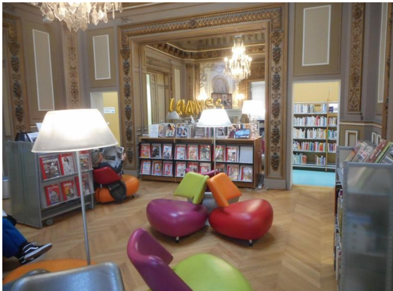
[37] Bibliothèque Chaptal - nečekané prostředí v jednom ze sálů