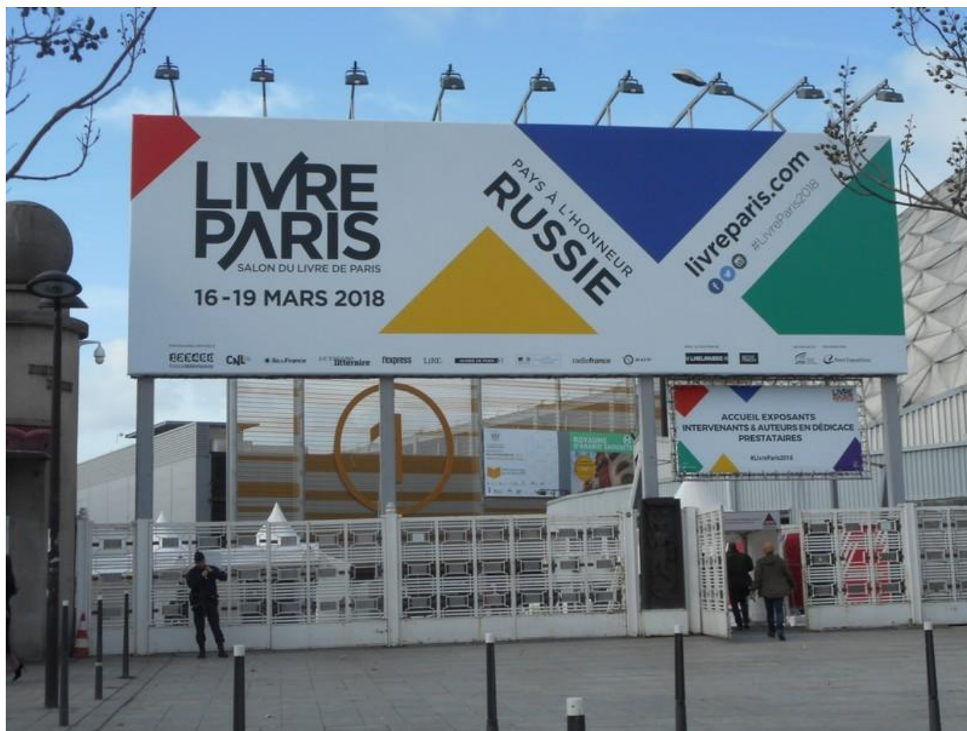
[11] Vstup do areálu výstaviště