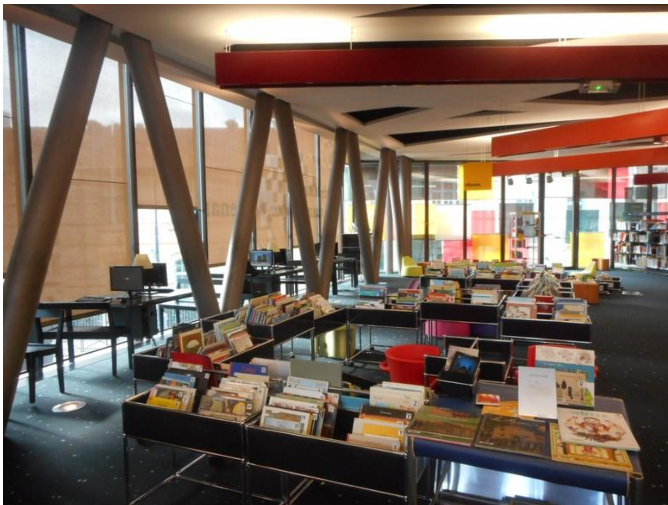
[32] Médiathèque Marguerite Yourcenar – část volného výběru