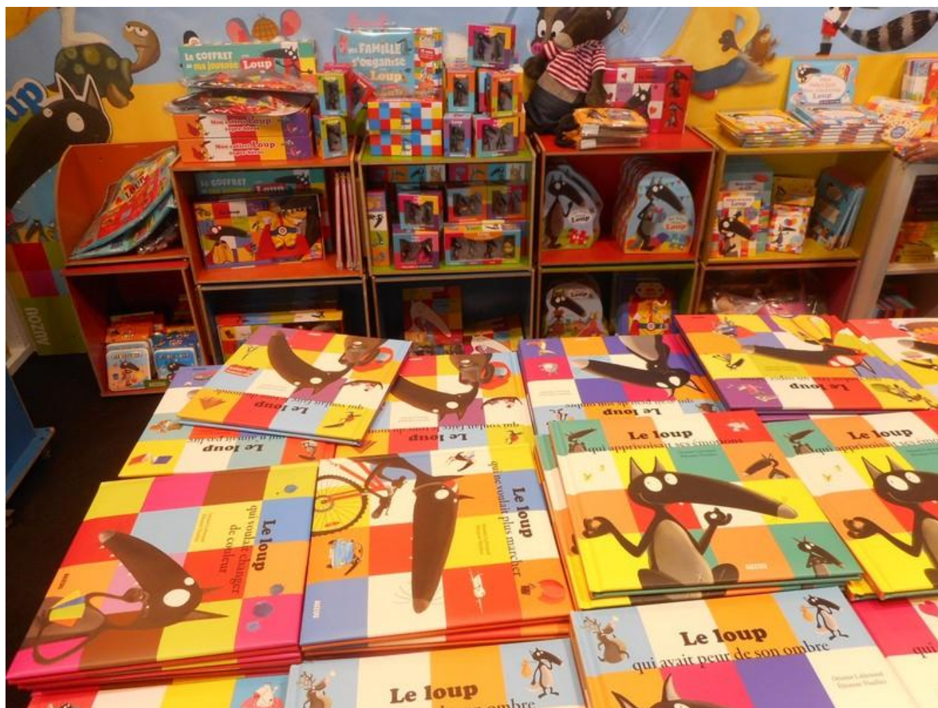
[13] Barvy, hravost, inspirace