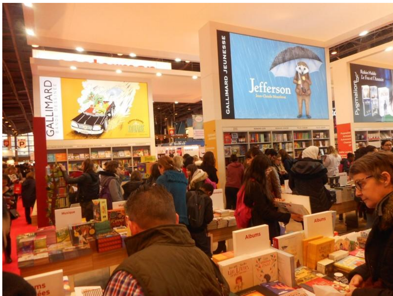
[15] U jednoho z největších vystavovatelů