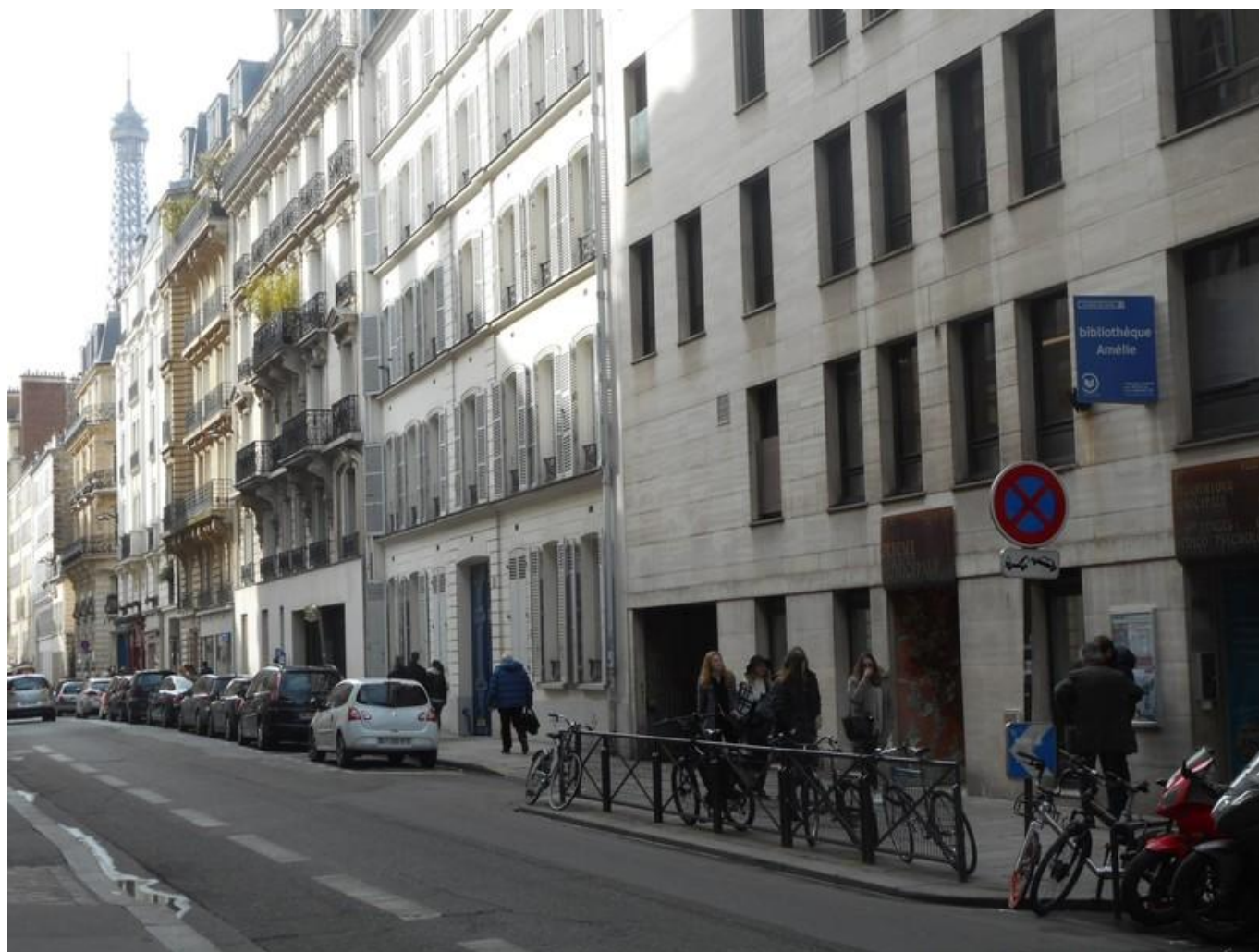
[27] Bibliothèque Amélie - knihovna v ulici Grenelle