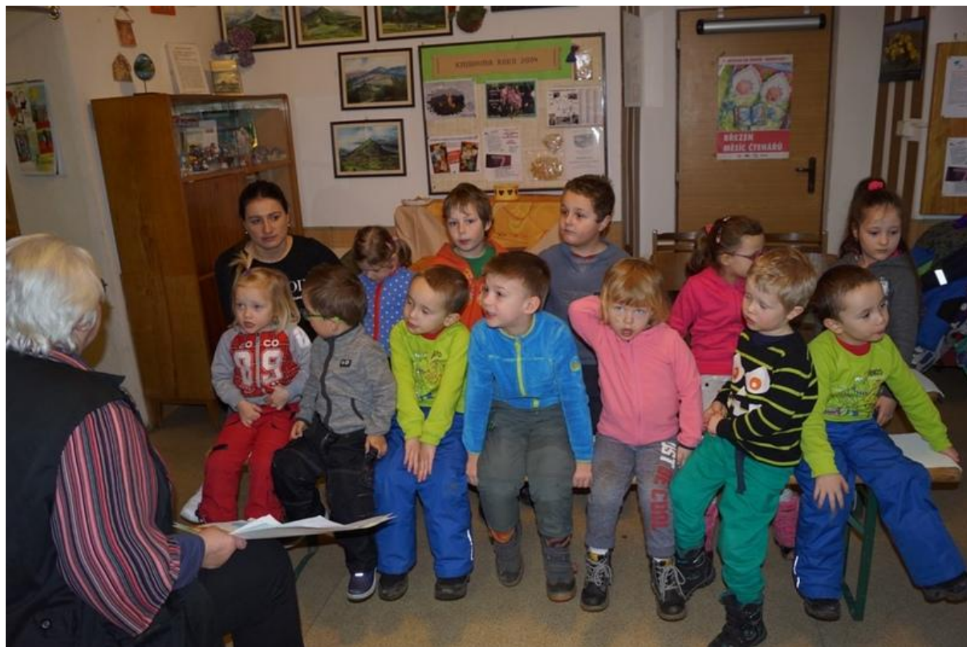
[19] Děti z mateřské školy poslouchají vyprávění

O týden později - v úterý 20. března - se na dvou besedách vystřídali žáci druhého stupně ZŠ. Tématem bylo osmdesáté výročí prvního vydání Rychlých šípů. O nich i o autorovi - tedy Jaroslavu Foglarovi - se pak vyprávělo i soutěžilo. Ježek v kleci šel (se střídavými úspěchy) z ruky do ruky.