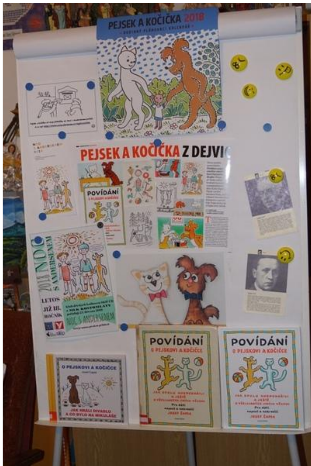
Výzdoba pro besedy