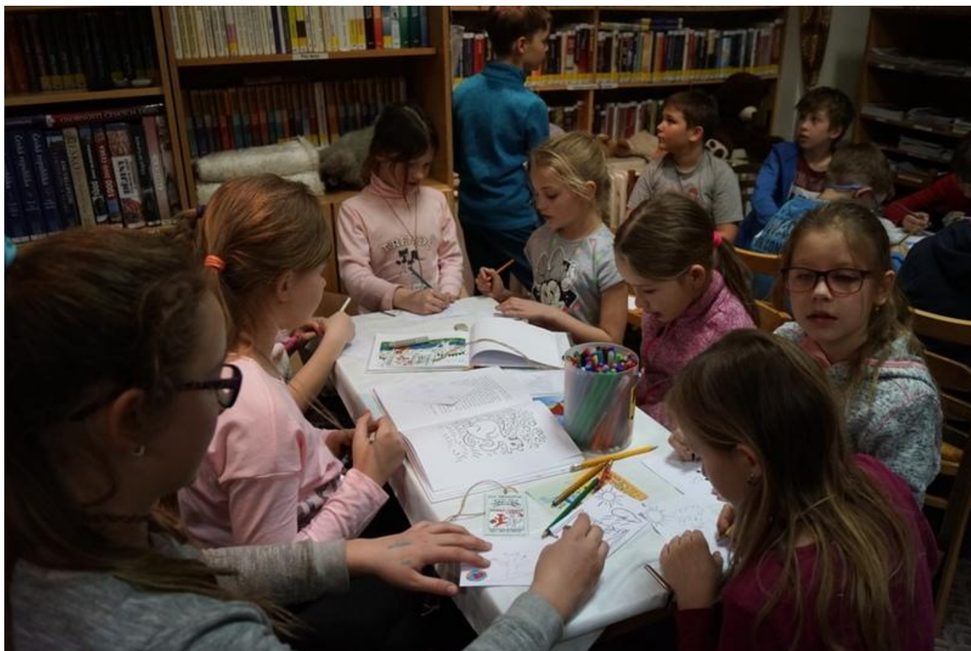
[26] Malujeme pohledy