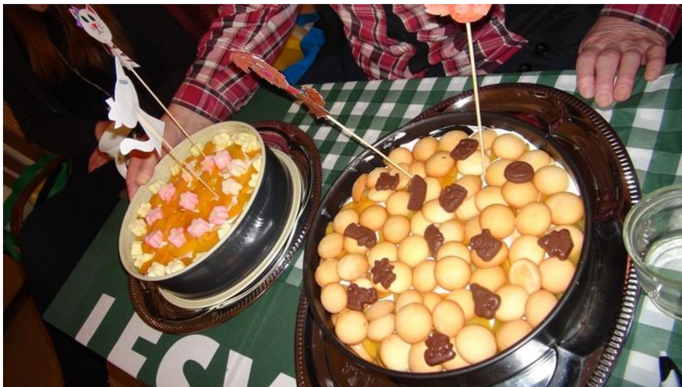
[23] Dorty pejska a kočičky