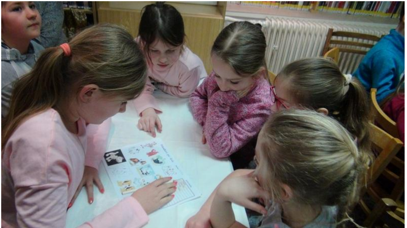
[24] Hádáme jména pejsků