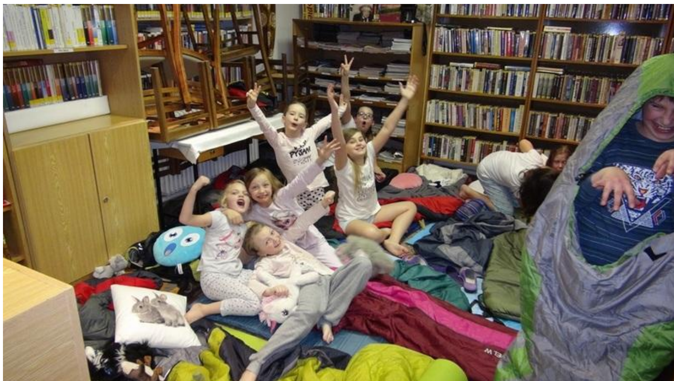
[29] Chystáme se ke spánku