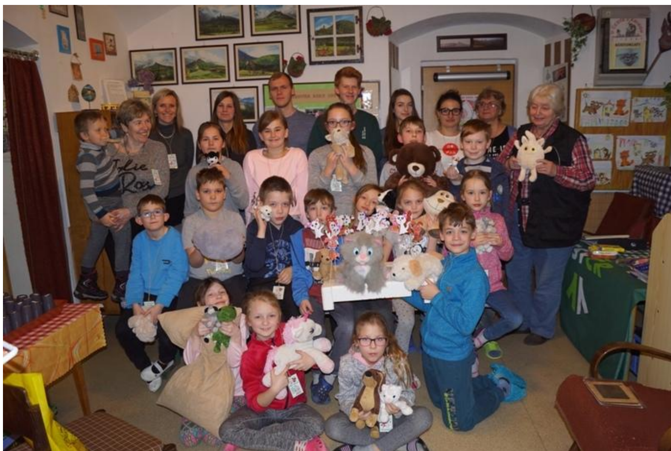
[22] Andersenčata se svými plyšáky

rozběhly soutěže, kvízy a také tvoření figurek dvou symbolů letošního nocování. Knihovnu navštívila i paní starostka s rodinou a účastníkům popřála příjemnou zábavu. Ale to už se vybrané dvojice pustily do výroby dortů, sice ne z těch dobrot jako v knížce, ale k snídani chutnaly a zmizely oba. A zase se soutěžilo a také četlo. Znalosti o lesní zvěři si vyzkoušel pan hajný - lesní pedagog. Po malé ochutnávce dobrot od maminek a babiček přišel hlavní chod - výborné voňavé párky od pana řezníka. Písničku o pejskovi a kočičce se děti s pomocí vytištěného textu naučily perfektně. Ještě stačily namalovat pohledy s oblíbenými motivy, které se budou rozesílat známým osobnostem a příznivcům knihovny. Vlastně stačily vybrat i titul knížky do Ankety nočních spáčů, tedy opět ankety Suk. Připravované noční hře ovšem zabránilo nepříznivé počasí. Po druhé večeři už se děti chystaly do pelíšků a usínání jim usnadnilo sledování příběhů pejska a kočičky. Ráno se pomalu trousily na ranní hygienu a pak hned na snídani. Následovalo vyhodnocení soutěží a předávání diplomů a dárků. O nějaký bodík vyhrálo družstvo Kočiček, ale spokojeni byli všichni. Jen neochotně odcházely děti se svými rodiči domů.