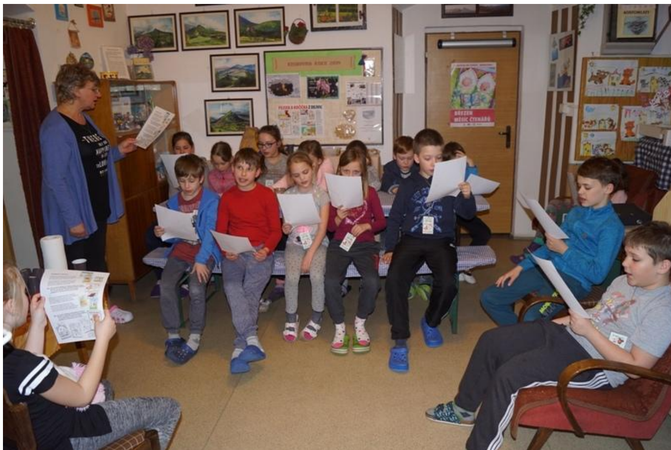
[27] Učíme se písničku o pejskovi a kočičce