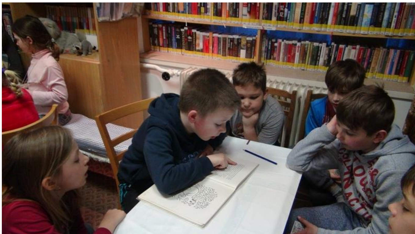
[25] Hodně se četlo