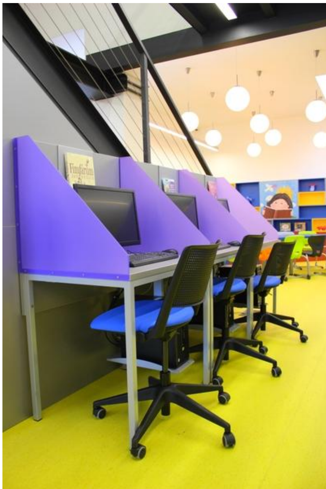
Jeden ze dvou počítačových koutků