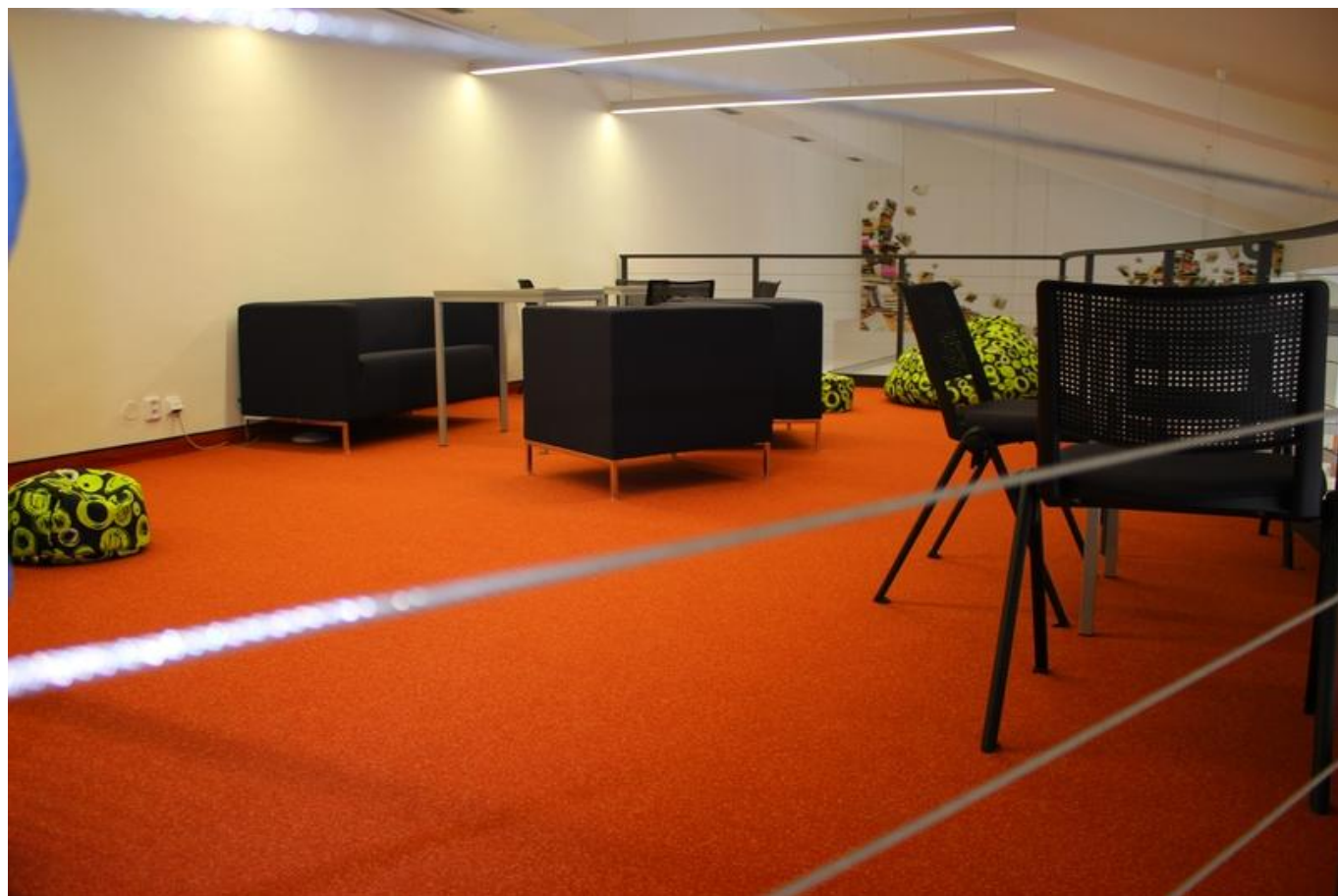
[12] Patro, které mají v oblibě především teenageři