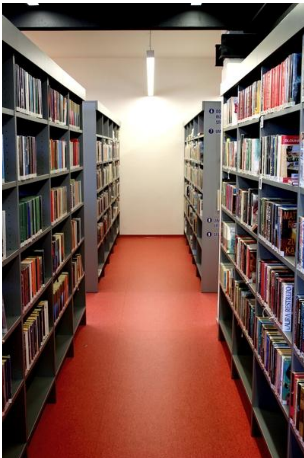
Regály s beletrií a naučnou literaturou pro dospělé