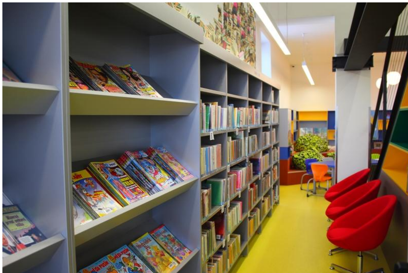
[17] Zákoutí s knihami pro náctileté