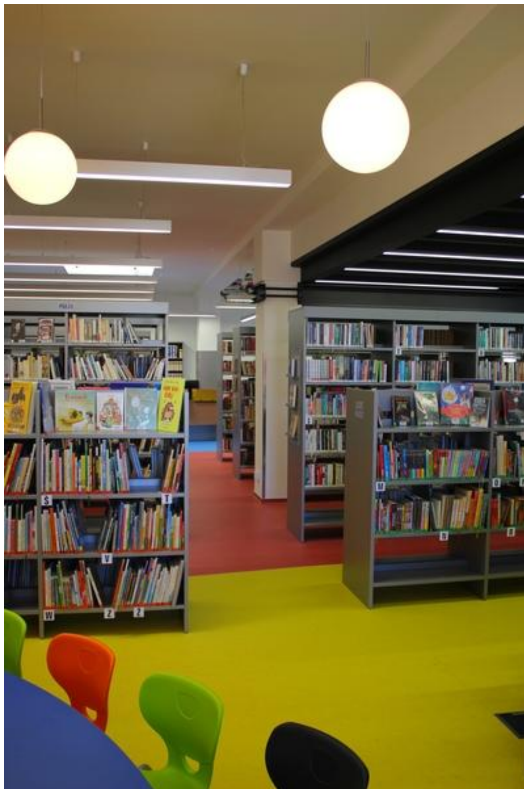
Pohled přes celou knihovnu k výpůjčnímu pultu