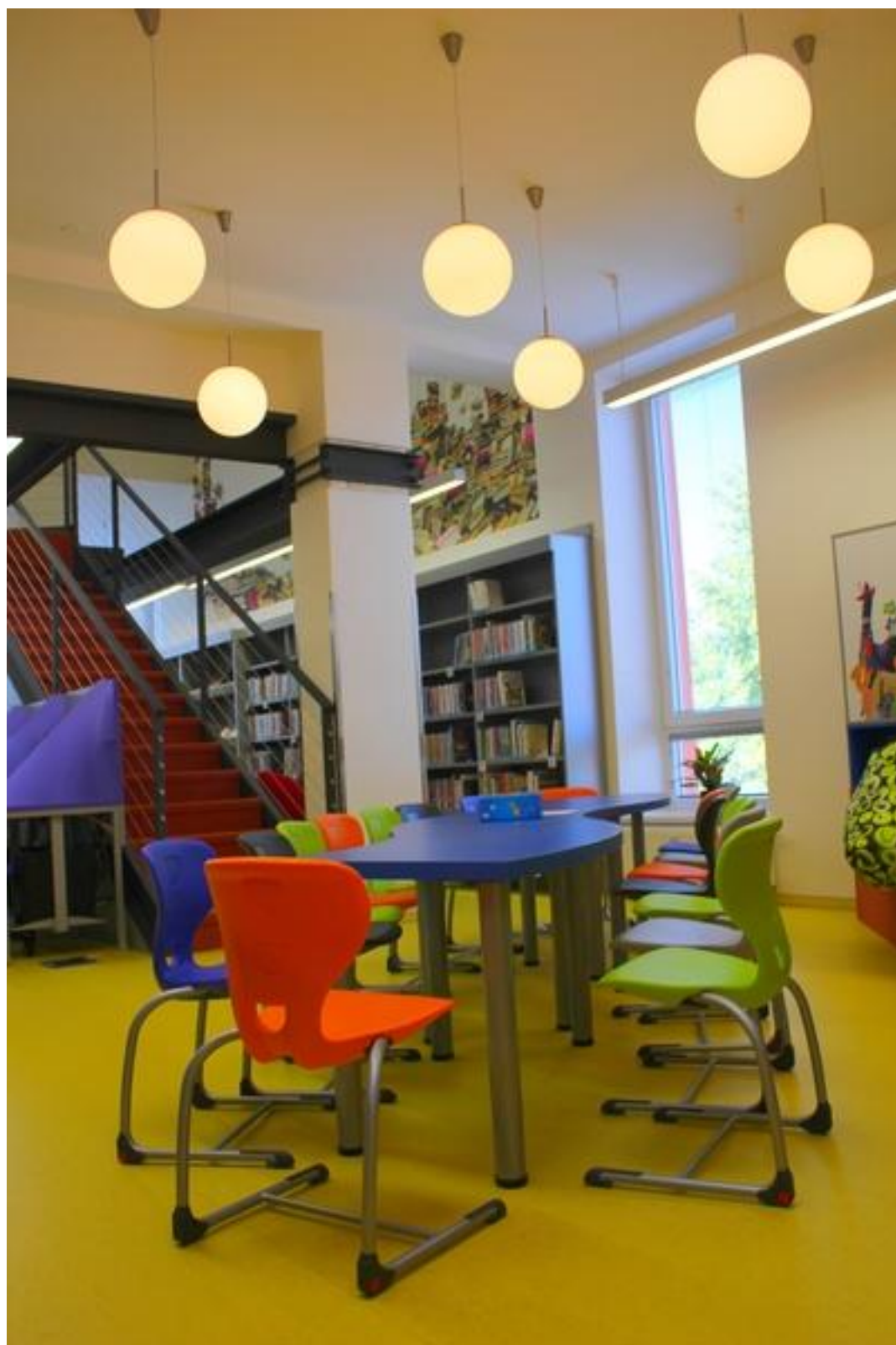
Dětský koutek se schodištěm do patra