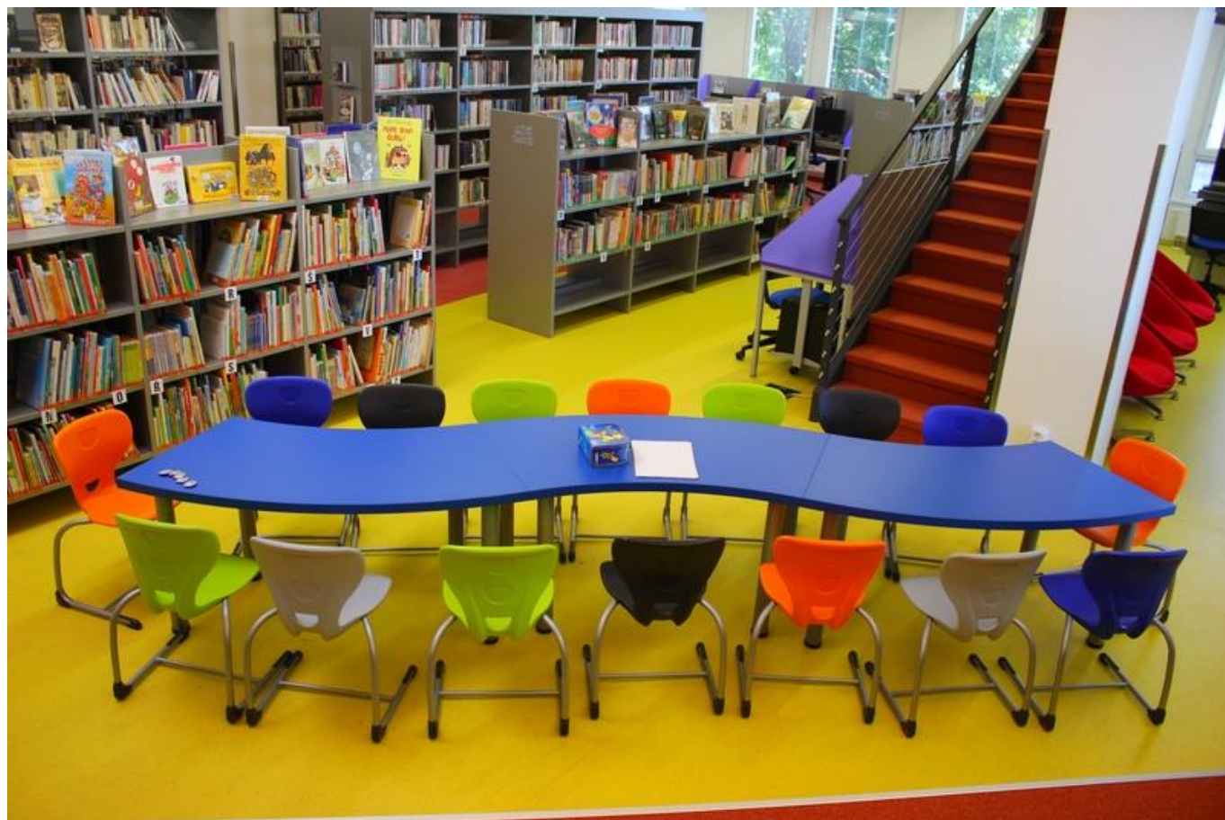
[14] Dětský koutek