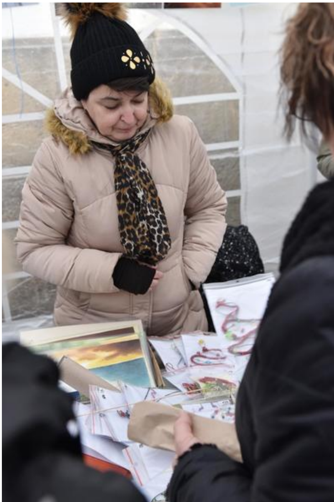
Obrázky a šperky