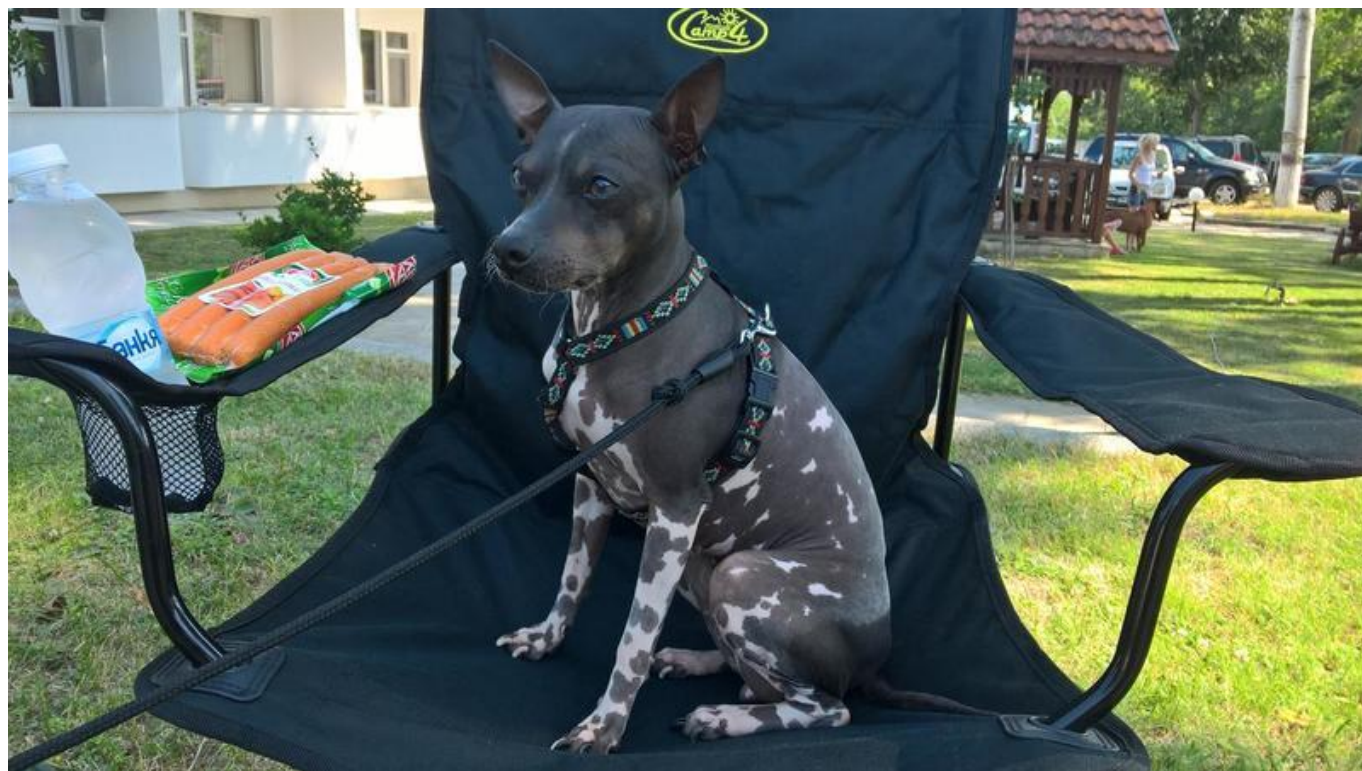
[14] Fenka Bára na dovolené v Bulharsku