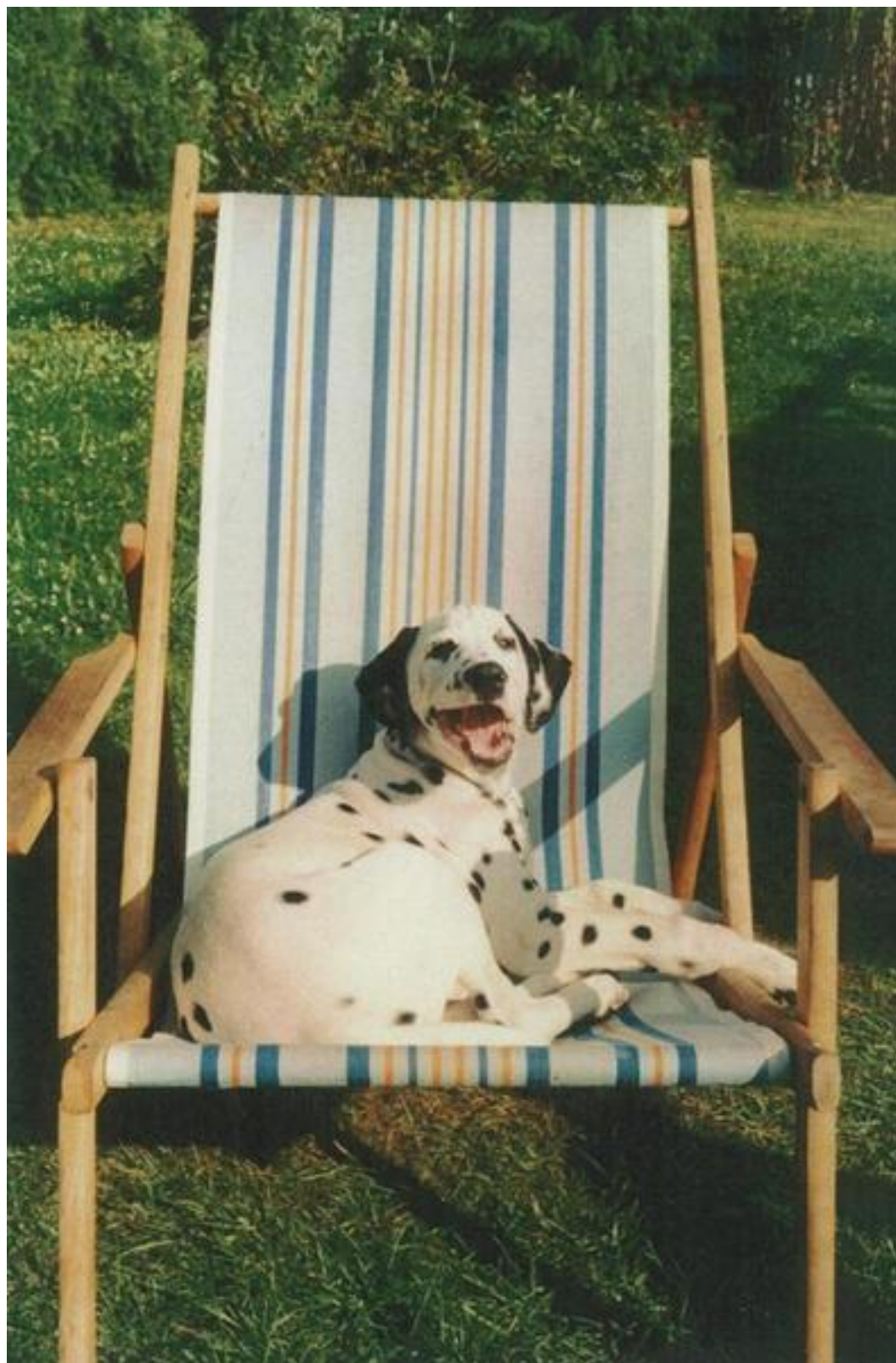
Dalmatin Marko na páníčkově lehátku