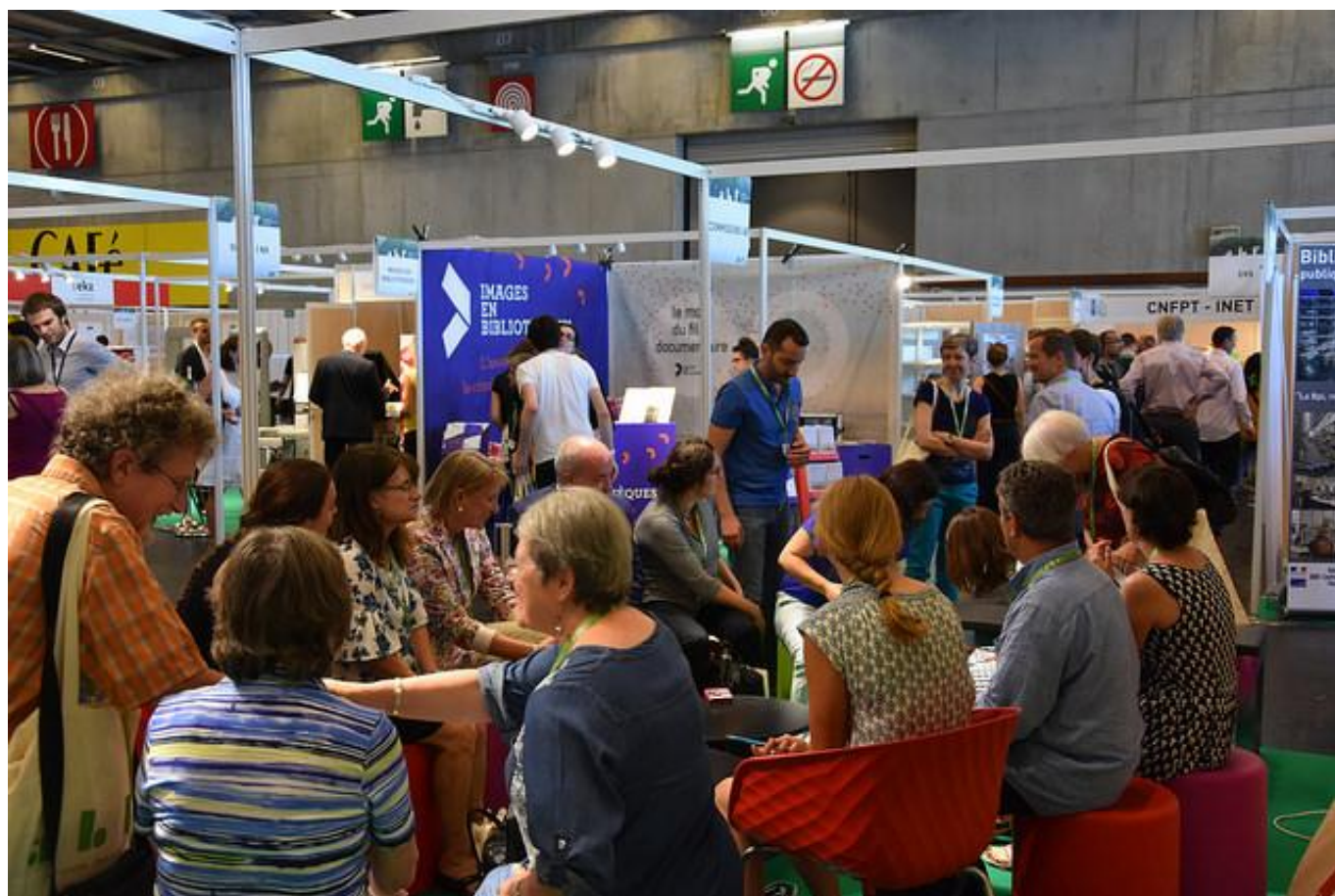
[11] Jednání jedné z komisí ABF