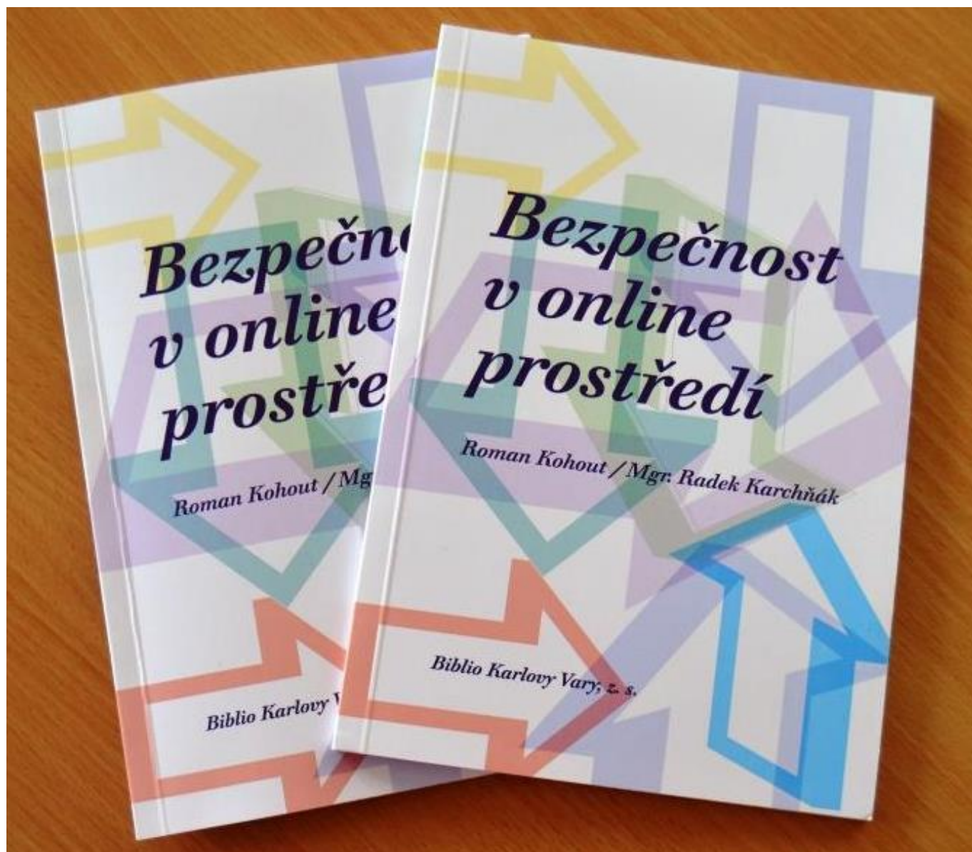
[12] Publikace Bezpečnost v online prostředí