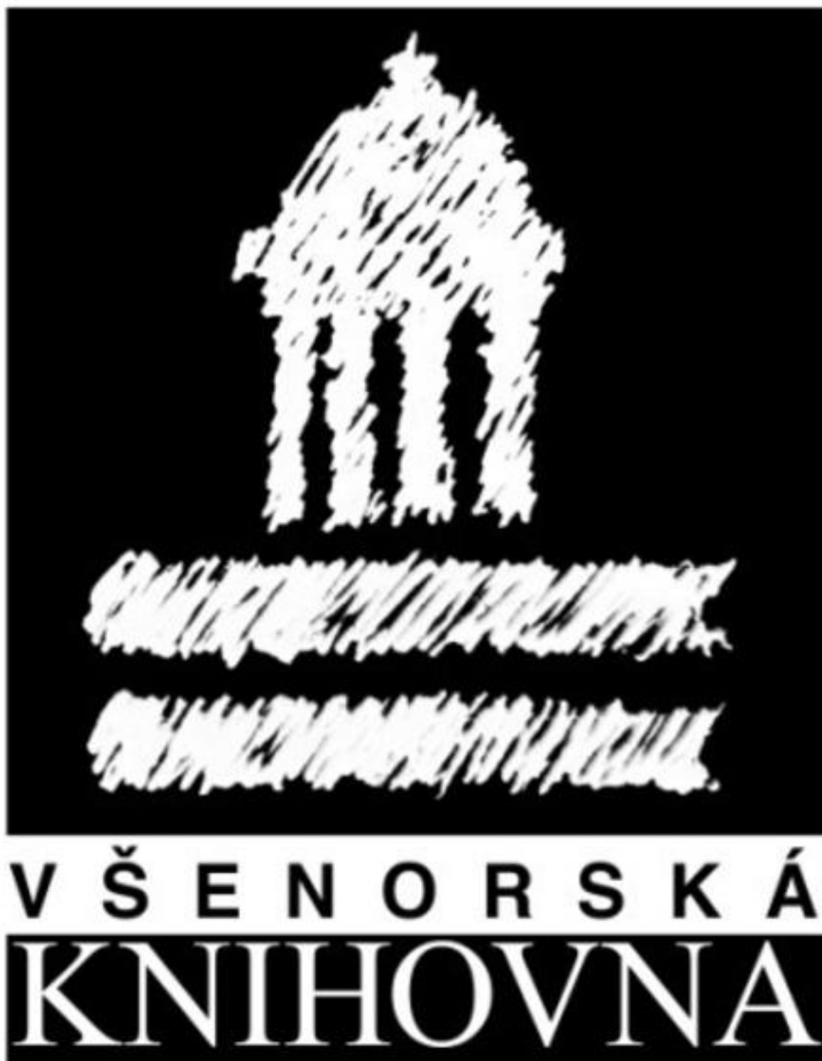
Logo Všenorské knihovny