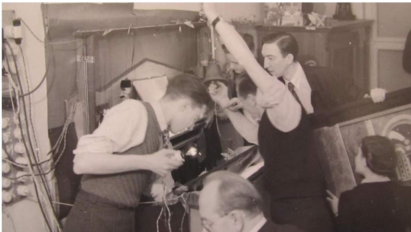
[20] Zákulisí divadla při představení