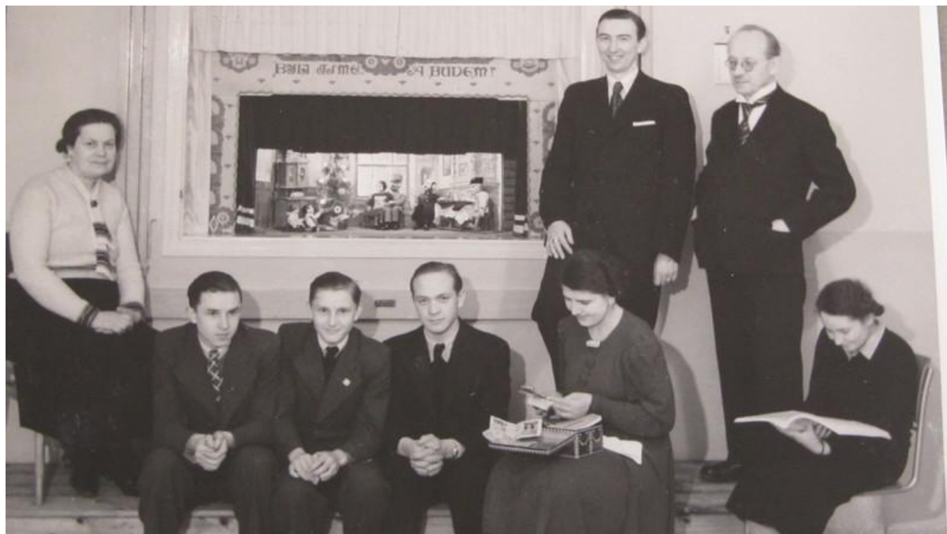
[18] Herci před loutkovým divadlem