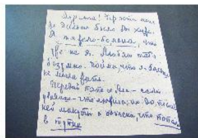
Poslední dopis vyčerpané a nemocné Mariny Cvětajevové synovi Georgijovi