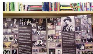
Pohled do expozice.