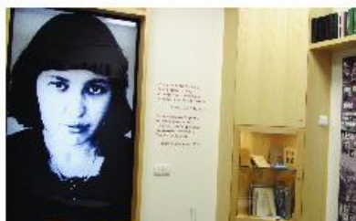
Pohled do expozice.