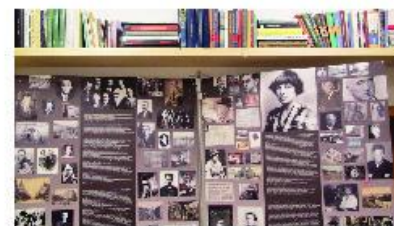
Pohled do expozice.