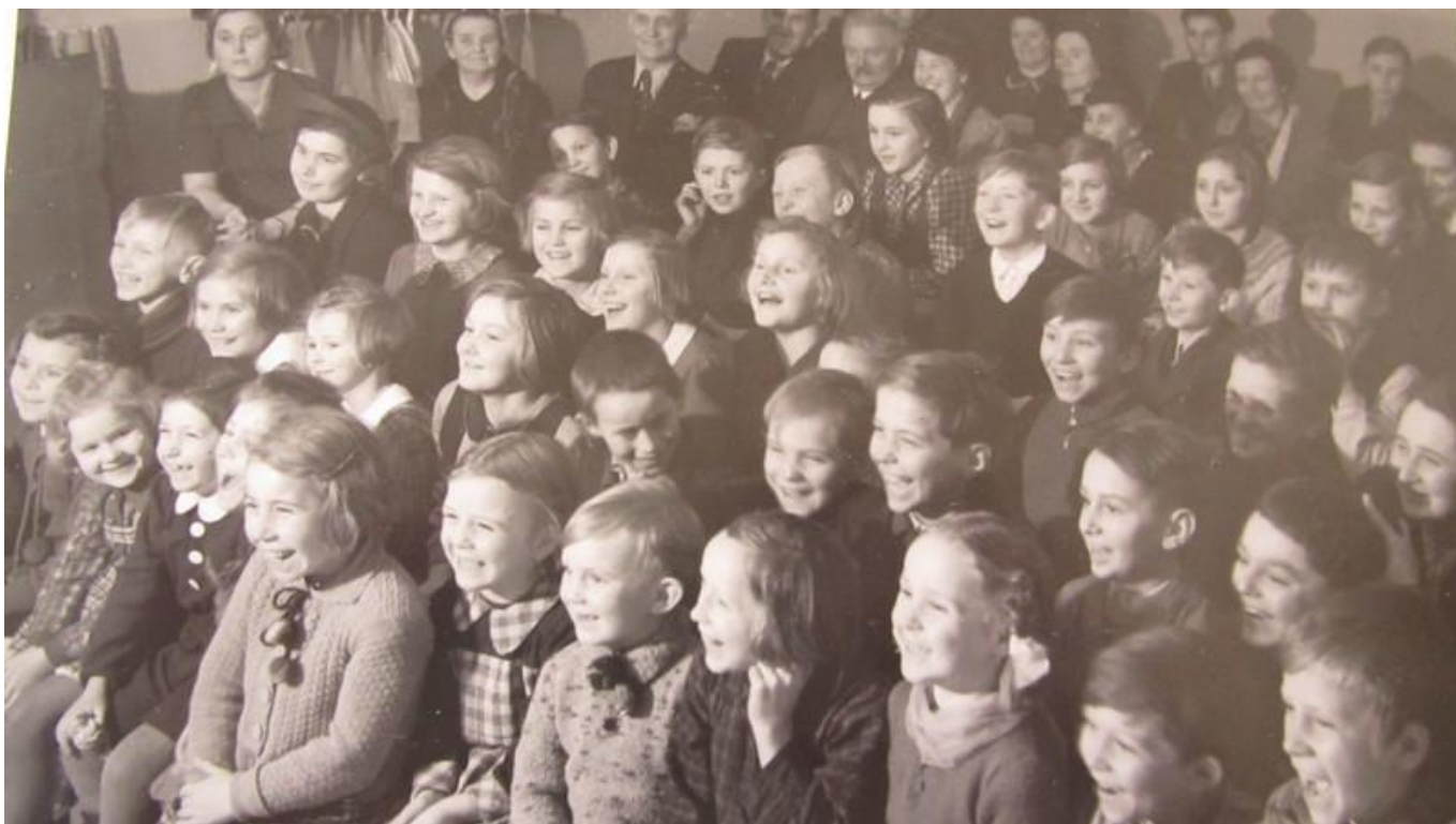
[21] Šťastné děti

Hrdiny odehraných představení byli mj. Kašpárek, Zlatovláska a Spejbl a Hurvínek. Podle pamětníků se však loutkové divadlo hrávalo ještě v šedesátých letech.