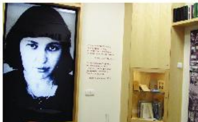
Pohled do expozice.