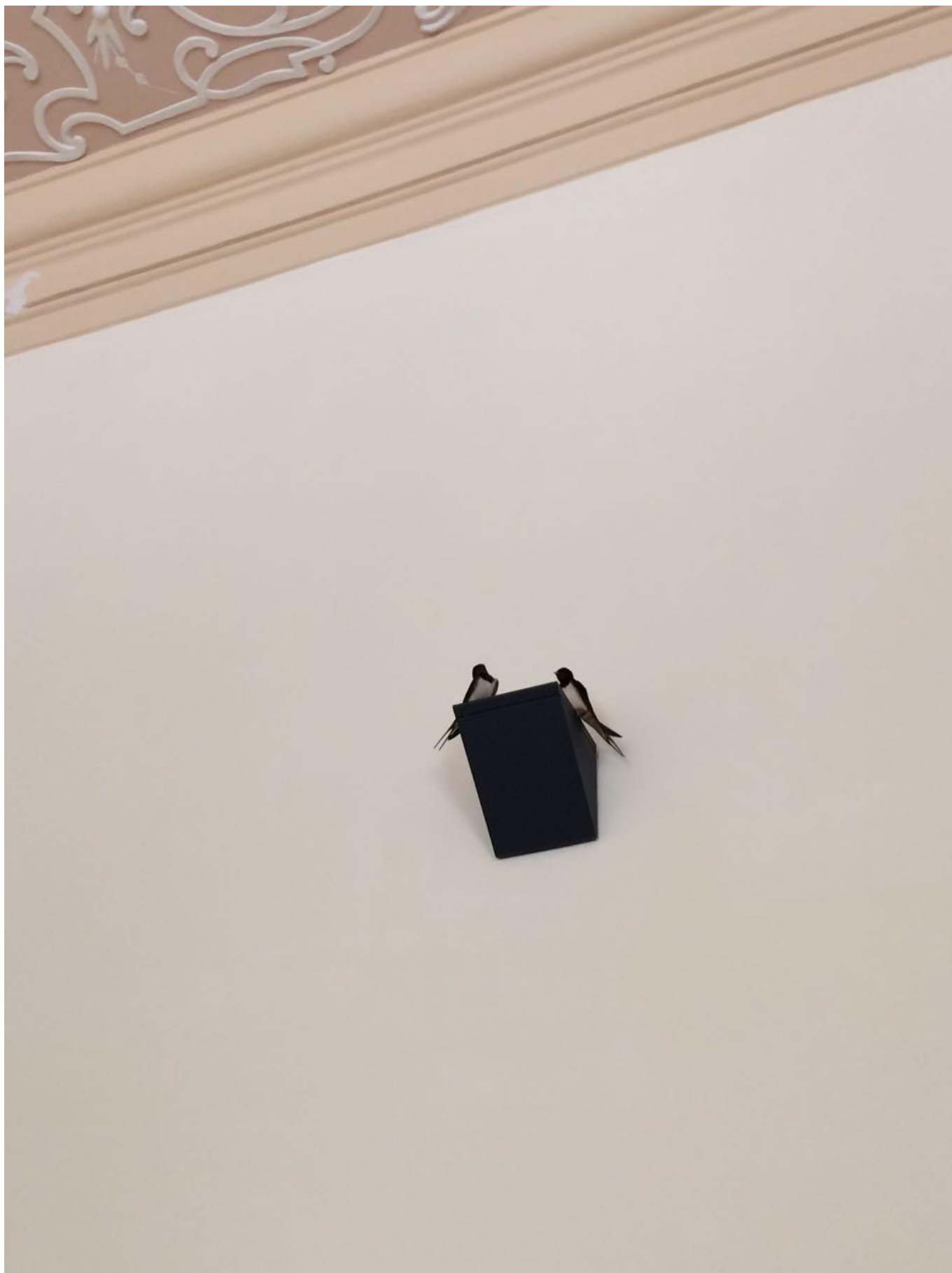
[11] Vlaštovky v učebně NK ČR