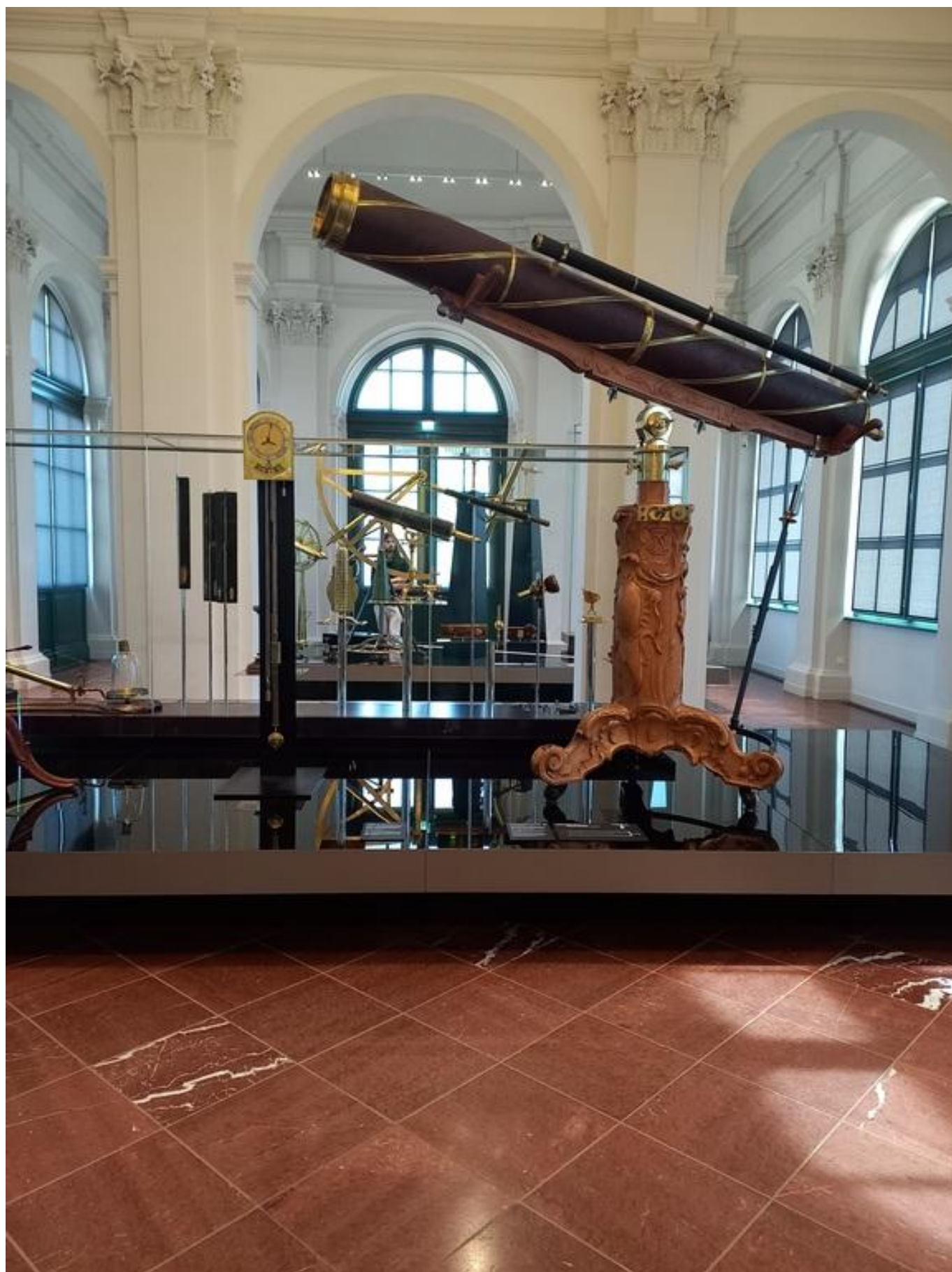
[34] Matematicko-fyzikální salon ve Zwingeru