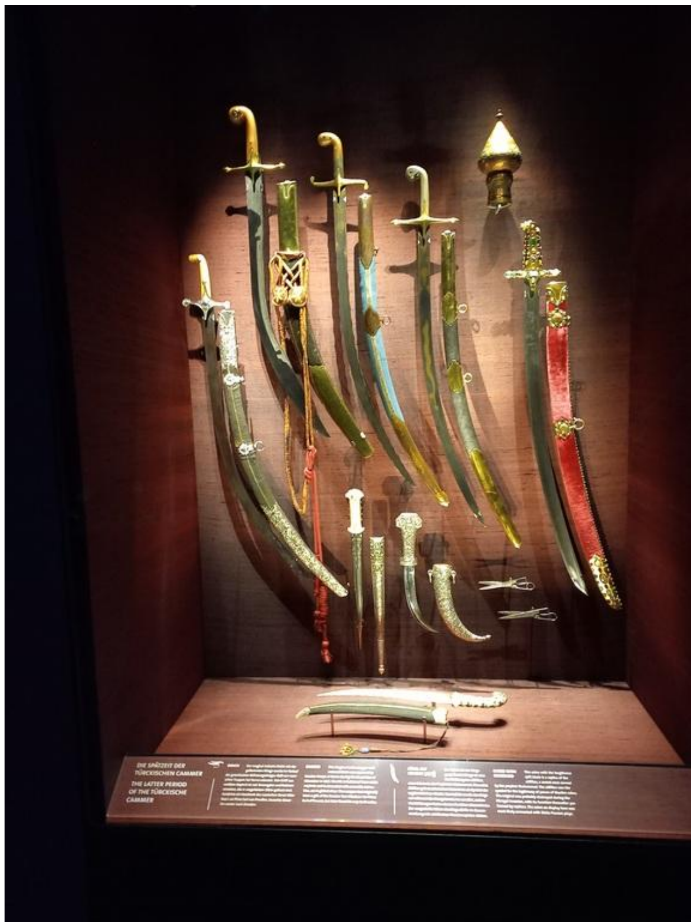
[46] Zbrojnice