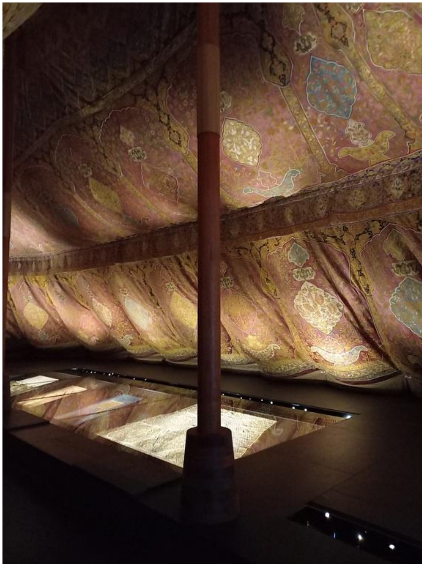
[41] Turecký stan