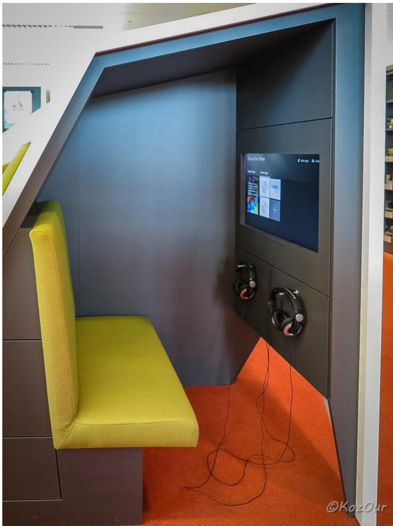
[25] Pohodlný úkryt skýtá soukromí při hře nebo poslechu