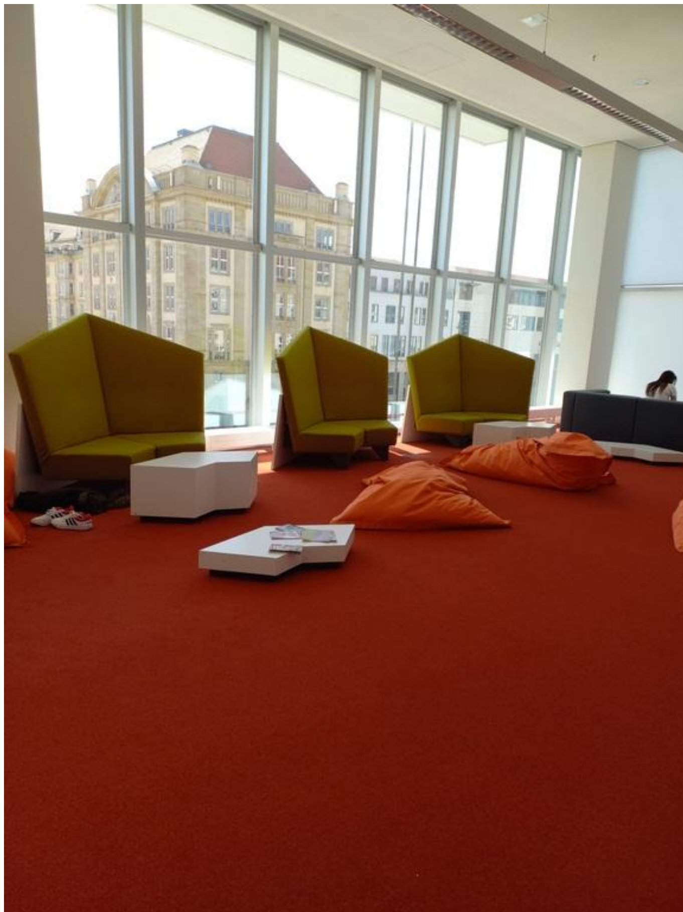
[22] Oddělení pro děti a mládež