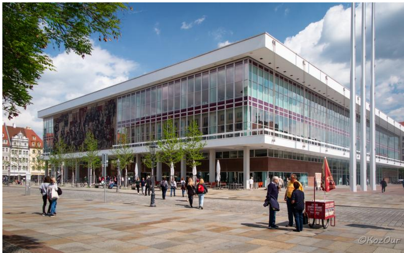
[18] Palác kultury, v němž sídlí Ústřední knihovna