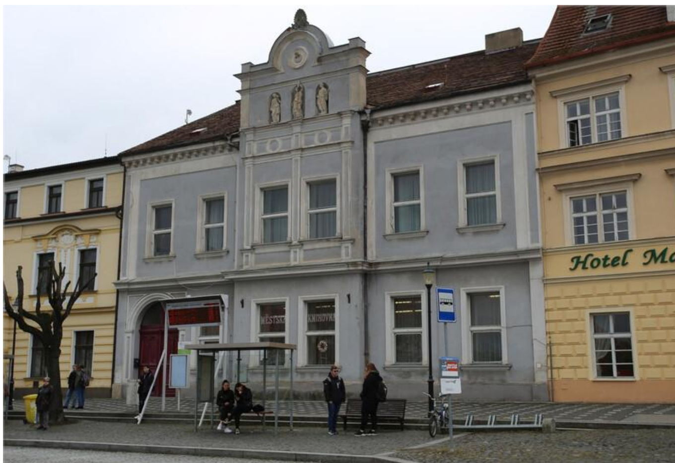
[9] Před rekonstrukcí

výměnu oken a dveří, kompletní výměnu elektroinstalace a osvětlení, položení nových podlahových krytin a změnu dispozice sociálních zařízení včetně toalet pro osoby s omezenou schopností pohybu.