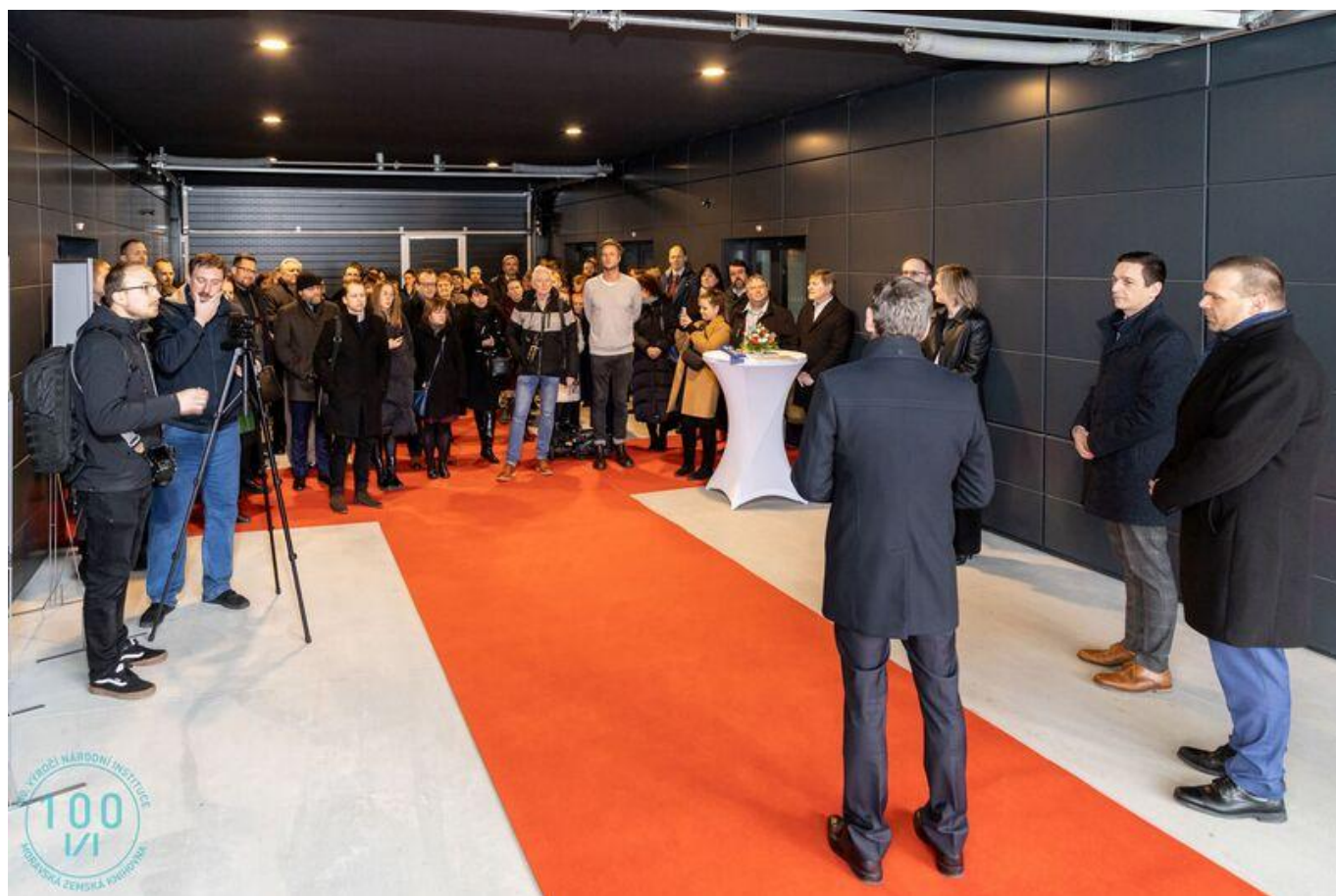
[15] V průjezdu